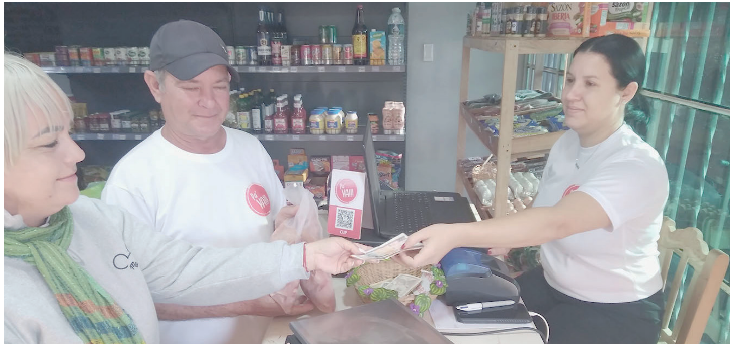
El control estricto de las ventas es una necesidad en cualquier forma de gestión.

no estatal en Cuba que, de alguna manera, favorecen el comercio y los ingresos municipales.