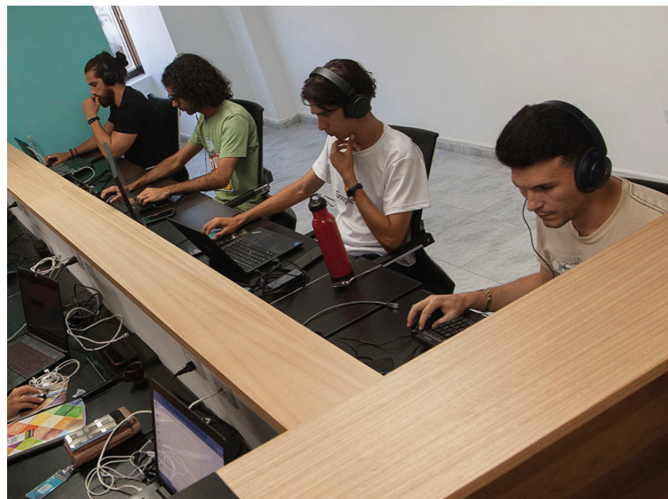
Las mayores dificultades al parecer no transitan tanto por lo organizativo, sino por las complejidades financieras que deben sortear las nacientes mipymes.