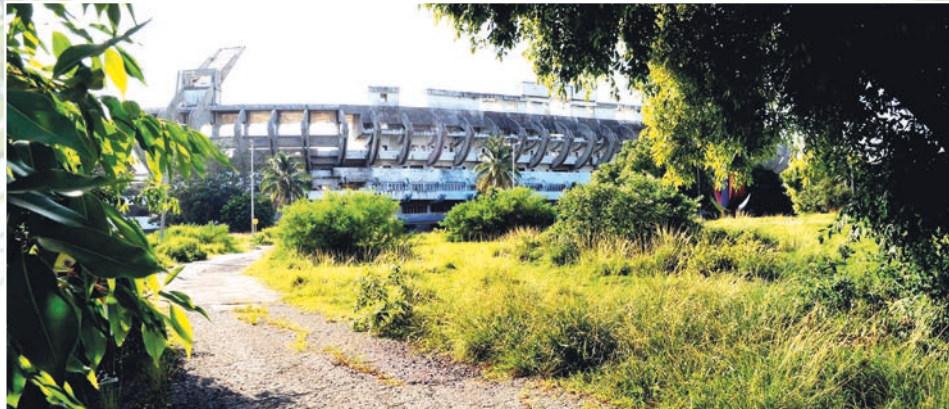
En los alrededores del Estadio Panamericano se observan las altas hierbas y lo tupido de la vegetación.