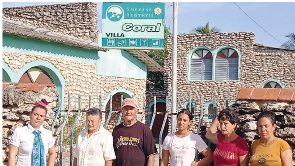
Una parte del pequeño grupo que se agiganta en defensa de la recreación colectiva.

Esos trabajadores merecen estímulos que tampoco llegan ni mediante los ingresos, pues laboran por un salario básico que oscila entre los 2 mil 100 y los 2 mil 500 pesos, alejados de sus esfuerzos y resultados, “porque somos una unidad perteneciente a una empresa con pérdidas”, remarca Margarita.