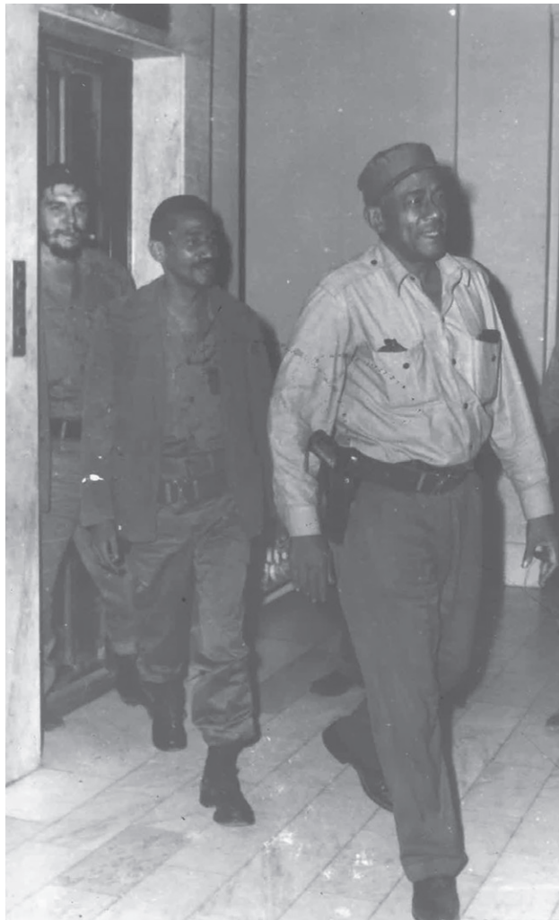
Una imagen poca conocida de Lázaro Peña, junto a los comandantes Juan Almeida y Ernesto Che Guevara.

“Hay que ligarse a la masa, porque es la única manera que la gente sabe qué derechos no le están cumpliendo, o se creen que no le están cumpliendo, o se creen que no le están satisfaciendo. Cuando el dirigente no tiene contacto con la masa, contacto vivo, se entera poco de los derechos, porque de los derechos se habla en la masa, cuando su contacto diario vivo es solo con la dirección, entonces siempre se entera de