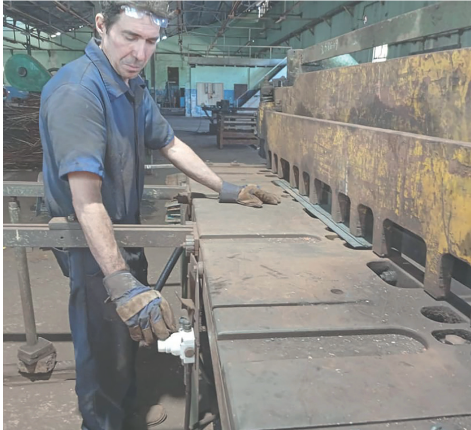
Trabajadores de Conformat cuestionan que al incluir los años de servicios en los pagos adicionales, en ese acápite del D 138 no es estimulante.

“Cualquier diseño incluye al sindicato y debe ser de mutuo acuerdo. Su análisis y aprobación debe llevarse a la asamblea general de afiliados y trabajadores, y plasmarse en el Convenio Colectivo...”, advierte quien también es responsable de