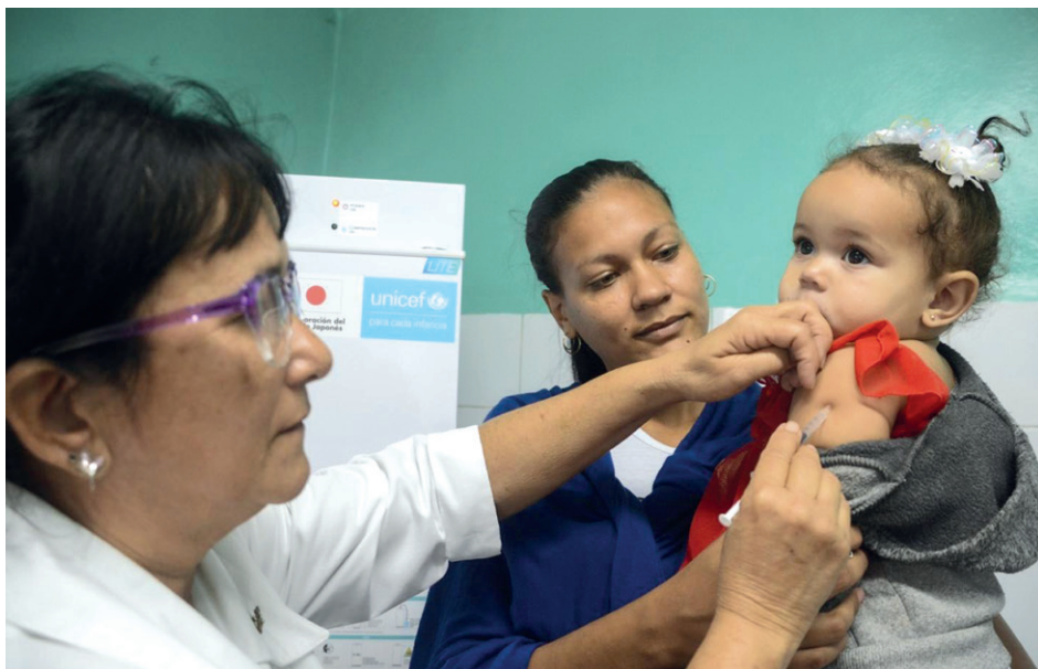
Vacunación pediátrica contra la COVID-19, a partir de los dos años de edad.

“El paludismo es otra enfermedad transmitida por el mosquito Anopheles albimanus . En Cuba hay criaderos aunque existe una vigilancia sobre la afección a partir del control sanitario internacional gracias a la cual no la tenemos en el país”.