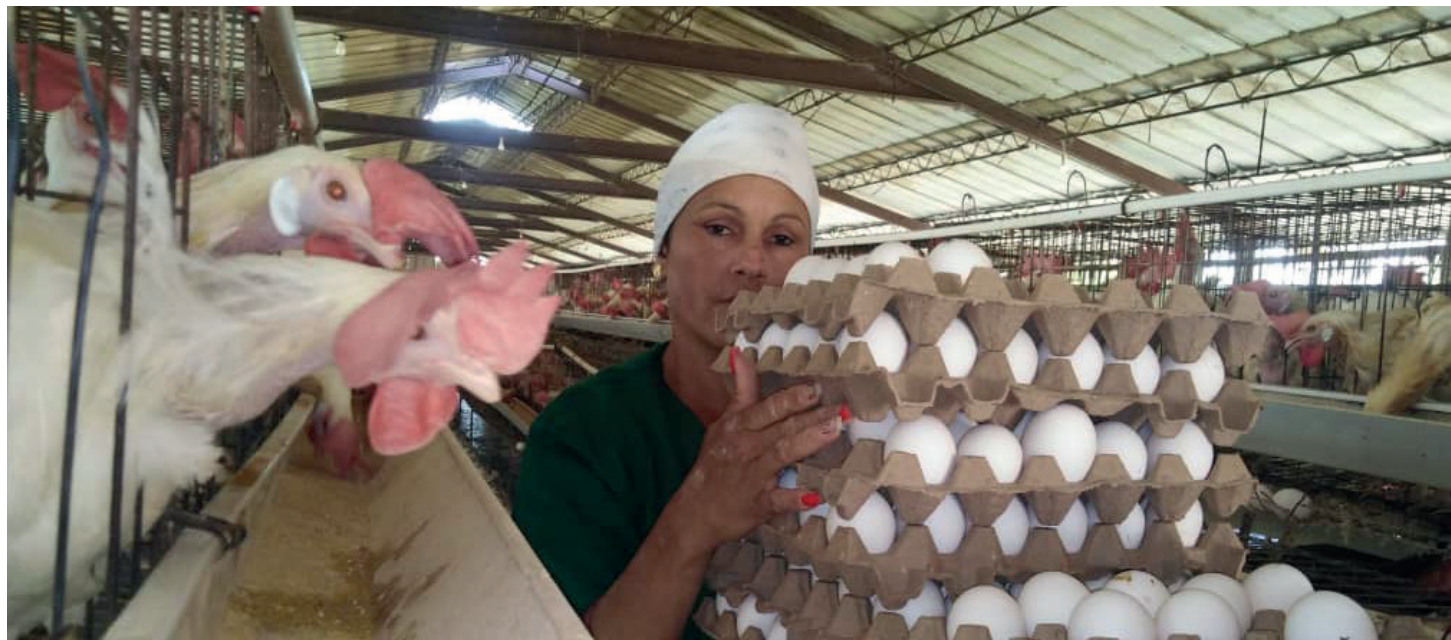
El suministro de pienso a las aves ponedoras se ha estabilizado. Junto a las trabajadoras sufren menos de estrés en las naves de la unidad cercana al avileño poblado de Santo Tomás.

Antes, su paso por la granja Emilio González Morales, enclavada en la comunidad Becerra, del municipio capital de la provincia de Las Tunas, no le había resultado fácil, tampoco a sus compañeros de labor. Tras cifras millonarias en la producción de huevos, fue implantada como navera,