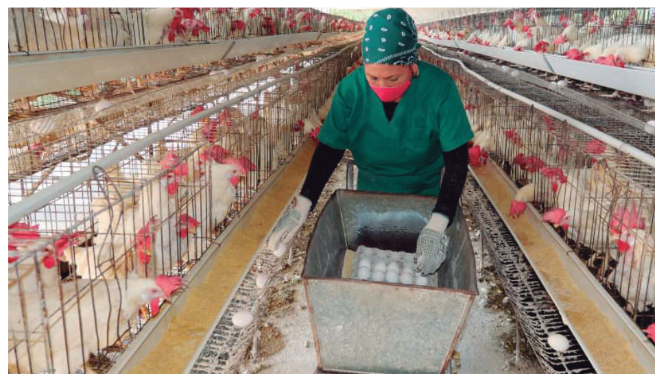
Anadelia, la navera de la granja tunera José Mastrapa. Allí está obligada a cumplimentar estrictas medidas de seguridad.

“Con una producción tan deprimida hubo que asumir un proceso de disponibilidad y acordamos con el grupo que todos los reubicados fueran hacia otras producciones agropecuarias y donde resultara posible quedaran en las mismas unidades avícolas. Así se