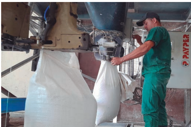
Hasta niveles ínfimos descendió la producción en la UEB Fábrica de Piensos Holguín ante la falta de materias primas.