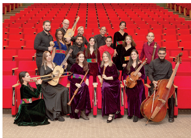
Como parte de la celebración por los 30 años de fundado, el Conjunto ofreció un concierto con piezas del compositor Claudio Monteverdi (1567-1643) en el que, además de las voces, pudo escucharse el sonido del arpa, el laúd renacentista, las flautas de pico, sacabuche, bajón, chirimías y otros instrumentos que sonaron por primera vez en Cuba gracias a Ars Longa. En esa ocasión, la dirección de la OHCH le entregó al Conjunto el sello conmemorativo, acuñado en plata, por los 500 años de la fundación de la Villa de San Cristóbal de La Habana.

Por eso, más allá de la simple lectura de notas musicales, Ars Longa concibe cada concierto como una recreación de los modos sonoros y visuales de su época. Toma en