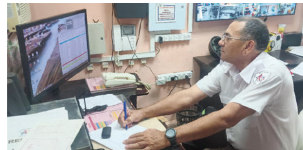
Esprot se distingue por la eficiencia en el empleo de medios técnicos de alarmas y cámaras de vigilancia en el resguardo de instalaciones estatales.

Servicios Técnicos de Esprot recibió el pasado jueves la Bandera de Proeza Laboral por ofrecer soluciones integrales en materia de seguridad y respaldo a la zafra azucarera en varias provincias del país. La entidad valida la calidad de sus prestaciones y sustenta una gestión empresarial orientada a la expansión de su objeto social, al desarrollo del talento de su capital humano y a la innovación con un enfoque de sostenibilidad económica.