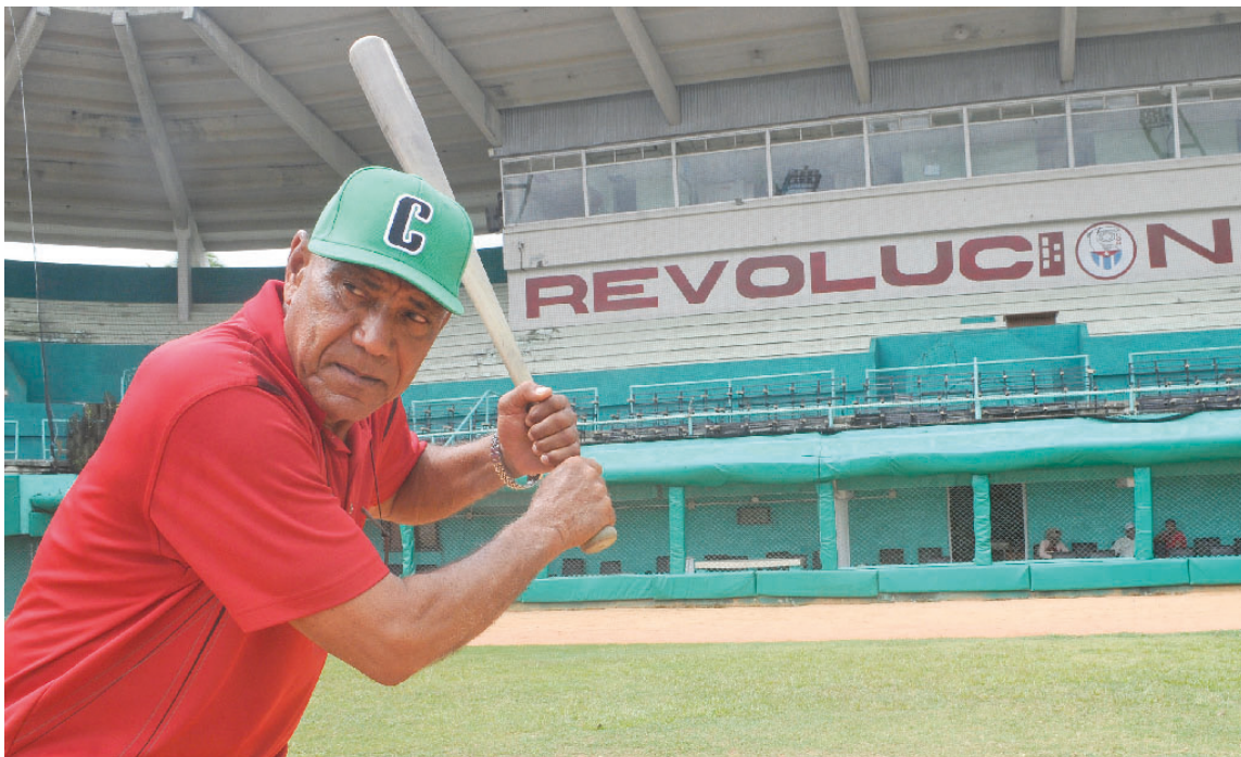
Recordando cuando daba batazos por Cuba.

Son tiempos de dificultades evidentes, objetivas y hasta crueles; su ejemplo es un canto al instinto de no cejar. Él no esconde sus sueños, prefiere aferrarse a ellos y echarlos a andar. Es su manera de asumir la vida. Respetársela es un deber y más cuando desde que se irguió como ser humano decidió hacer y nunca rendirse.