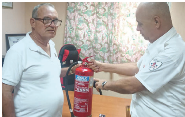
La UEB Servicios Técnicos de Esprot en Sancti Spiritus incorporó a sus prestaciones el mantenimiento y puesta en marcha de extintores en desuso.

“Certificamos los medios, entre ellos el compresor, los manómetros de presión y la pesa. También diseñamos la pistola de recarga a partir de un equipo inutilizado. Habilitamos el taller donde, además de rellenar los cilindros, reponemos los principales accesorios elaborados a partir de