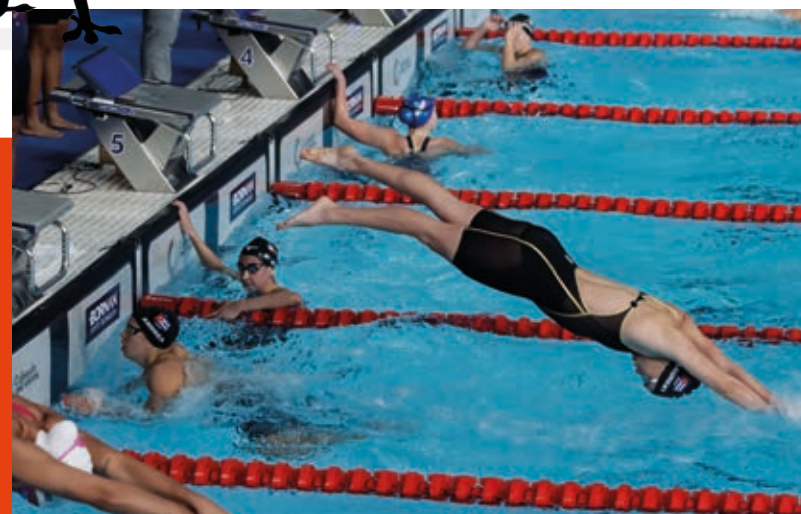
Cuba rompió el récord nacional en el 4x100 libres (f) con tiempo de 3:44.97 minutos, válido para un quinto lugar.