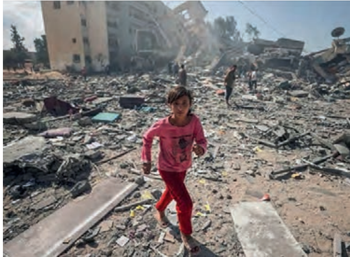
Tras dos semanas de bombardeos, Israel ha destruido 5 mil 500 edificios residenciales (unos 14 mil 200 apartamentos); 133 mil 370 viviendas sufrieron daños parciales, 10 mil 127 de ellas quedaron inhabitables. También fueron devastadas decenas de instalaciones de servicios, 4 hospitales, 160 escuelas y 17 mezquitas.

Las acciones diplomáticas para detener la masacre no han prosperado, por el contrario, Israel persiste en invadir Gaza mientras las fuerzas de Hezbolá, en el Líbano,