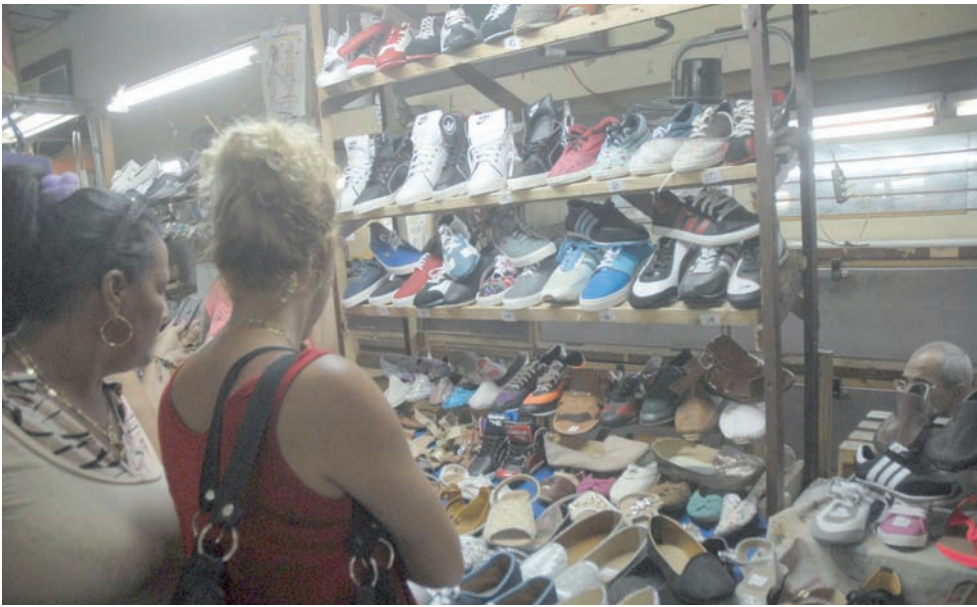
Para todos los gustos.

intereses, las cuestiones en las cuales consideran debe seguirse trabajando.