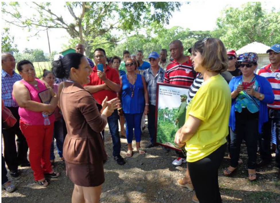
El sitio histórico de Birán fue escenario apropiado para el emotivo encuentro.

Luego de recorrer la casa natal, escuela rural y demás instalaciones y conocer detalles de su funcionamiento, los participantes en el singular evento, el primero de su tipo organizado por el Sindicato y el Ministerio de la Construcción, se reunieron en la antigua valla de lidias para defender sus ponencias, criterios y hasta poe-