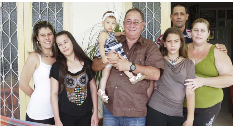
Junto a su familia.

Agradezco muchísimo a Fidel, a Raúl, a Machado, que me hayan dado la posibilidad de estar aquí, interpretar y aplicar sus ideas, el pensamiento de la máxima dirección del país, esa que fraguó los cimientos del gran edificio que es la Revolución. A las demás generaciones solo nos ha tocado levantar un piso.