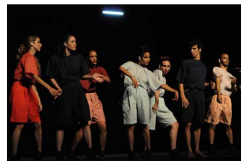
El estreno tuvo lugar en el Gran Teatro de La Habana Alicia Alonso.

gunas de sus principales figuras. Lo hemos dicho más de una vez: Danza Contemporánea de Cuba es una excelente compañía, pero también es una gran escuela. | Yuris Nórido