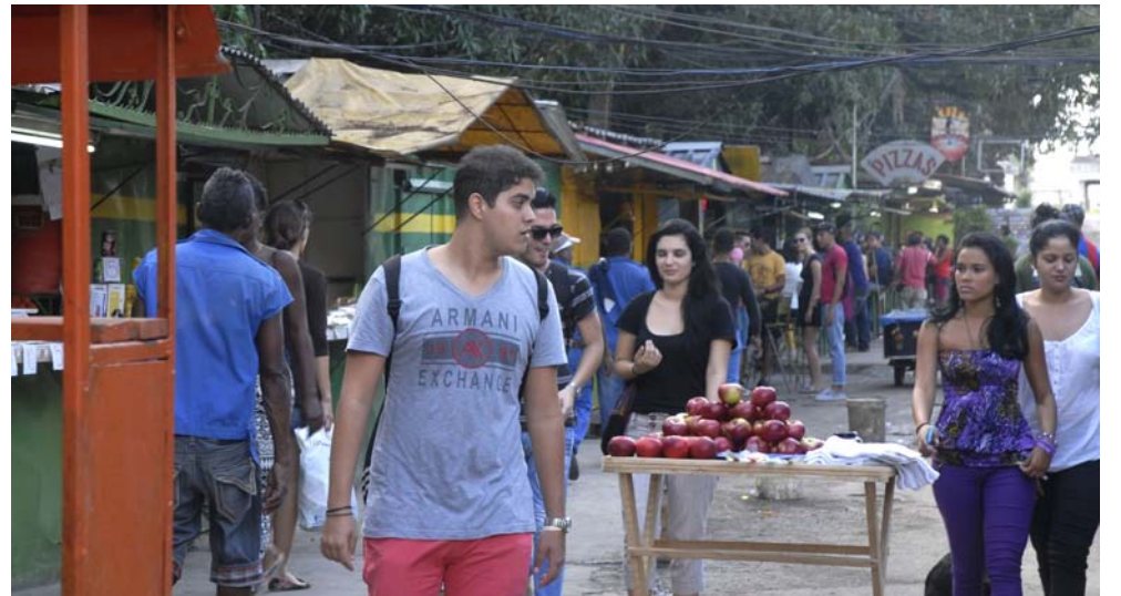
Son muchos los estudiantes que acuden al área cercana a la Cujae, en la cual se expenden variados alimentos.

En septiembre, dijo, realizarán un activo juvenil, a raíz de un acuerdo adoptado en el X Congreso, el cual busca precisamente una retroalimentación con los integrantes de diferentes sectores y a la vez transmitirles los