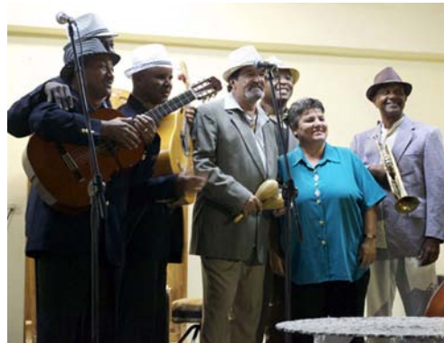
Integrantes actuales de Los Naranjos.