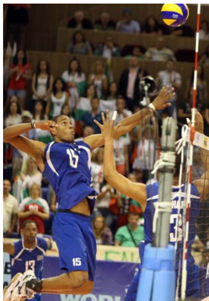
Albo lideró el ataque cubano.

Primeros resultados: HAB venció a ART 4x1; VCL a MAY 3x1; MTZ a CFG 4x0; CAV a CMG 10x5; SSP a LTU 7x5; SCU-HOL fue sellado; PRI-IJV no celebrado.