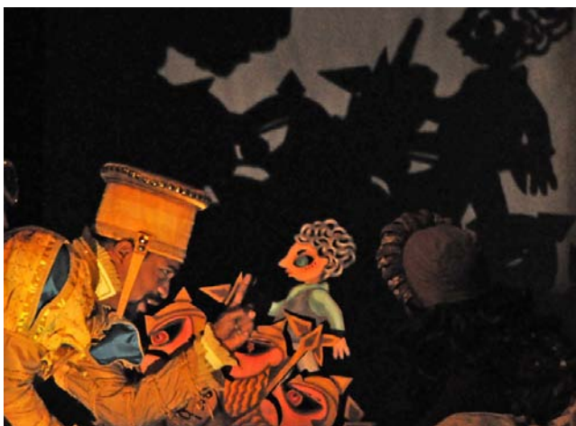
Los dos príncipes , por Teatro de las Estaciones.

Fíjense en el verbo: “encarnar”. Lauten va más allá de una interpretación lírica y canónica. No es la santa (suficientemente recreada por piadosas obras eclesíásticas y seculares); sino más bien la mujer, criatura matizada por las dudas y la vocación, cuerpo en trance, ejemplo de entereza ante la adversidad y el prejuicio.