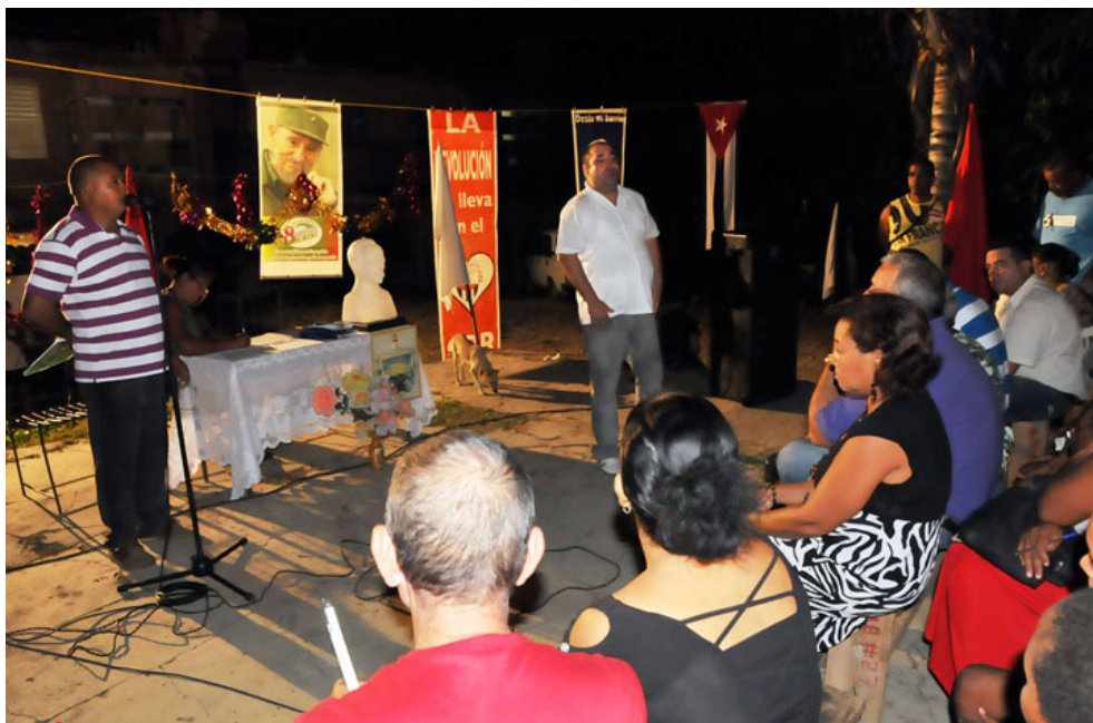
Reuniones de rendición de cuenta, ejercicio directo de participación y democracia.

El presidente de la Asamblea Nacional, Esteban Lazo, ha hablado del significado de esta estrategia de comunicación, pero además en nuestro accionar nos han ayudado los planteamientos del VII Congreso del Partido, los objetivos de la Primera Conferencia y los Lineamientos, destacó.