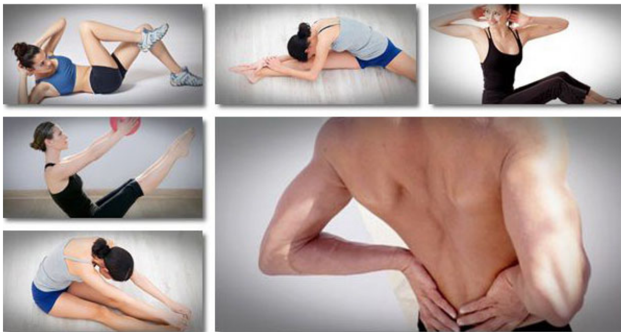
Ejercicios para evitar el dolor de la ciática.

Según las fuentes consultadas, la ciática no es una enfermedad en sí, sino el término médico empleado para describir síntomas causados por otros problemas en la parte baja de la espalda.