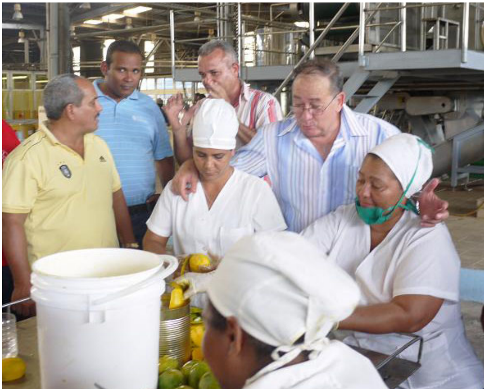
El pueblo, que sabe de las inagotables fuerzas de Lázaro para enmendar entuertos, aprovecha cualquier ocasión para mostrarle cariño sincero, premio mayor a un liderazgo que está fuera de serie.

Yo diría que un privilegio. Es un pueblo increíble, superó mis expectativas. Me comentaron que era difícil, incluso cuando me mandaron para acá algunos me dijeron: "¿Te doy el pésame o te felicito?", siempre respondí: Felicítame, yo no me equivoqué.