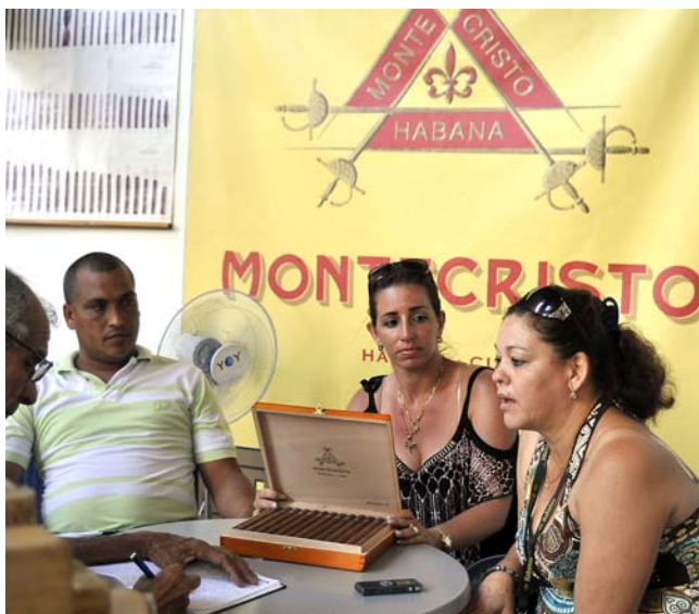
La producción de tabacos para la exportación es uno de los principales rubros del territorio artemiseño.

Como parte de esa experiencia fue creado un grupo de dirección empresarial que concentra