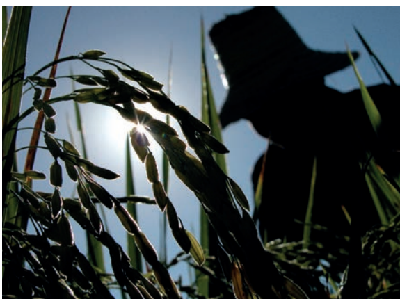
Agricultura. | foto: René Pérez Massola