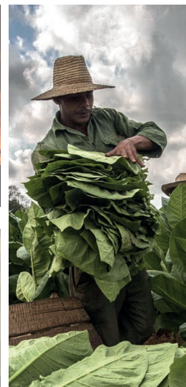
Cosecha de tabaco.