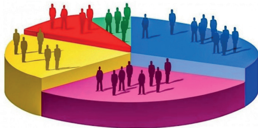
La composición sociodemográfica de la población será actualizada durante el CPV. Diagrama Censo de Población.

Las respuestas de ese cuestionario amplio y diverso emanarán del Levantamiento Censal, la última etapa del proceso recién iniciado en el que empeño e intelecto se unirán a fin de garantizar las condiciones que permitan a Cuba declararse lista para su décimo noveno Censo de Población y Vivienda.