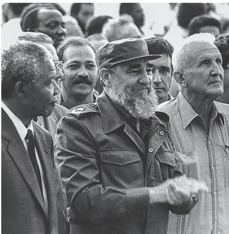
Amistad, Fidel.

La exposición fotográfica itinerante del colectivo de fotorreporteros de Trabajadores fue inaugurada en el Teatro Nacional de Cuba como prelude de la gala por nuestro aniversario 55. En los próximos días ocupará los salones del Palacio de los Torcedores para luego trasladarse a la sede de la Unión de Periodistas de Cuba (Upec)