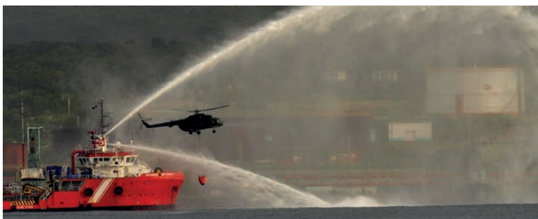
Valientes.