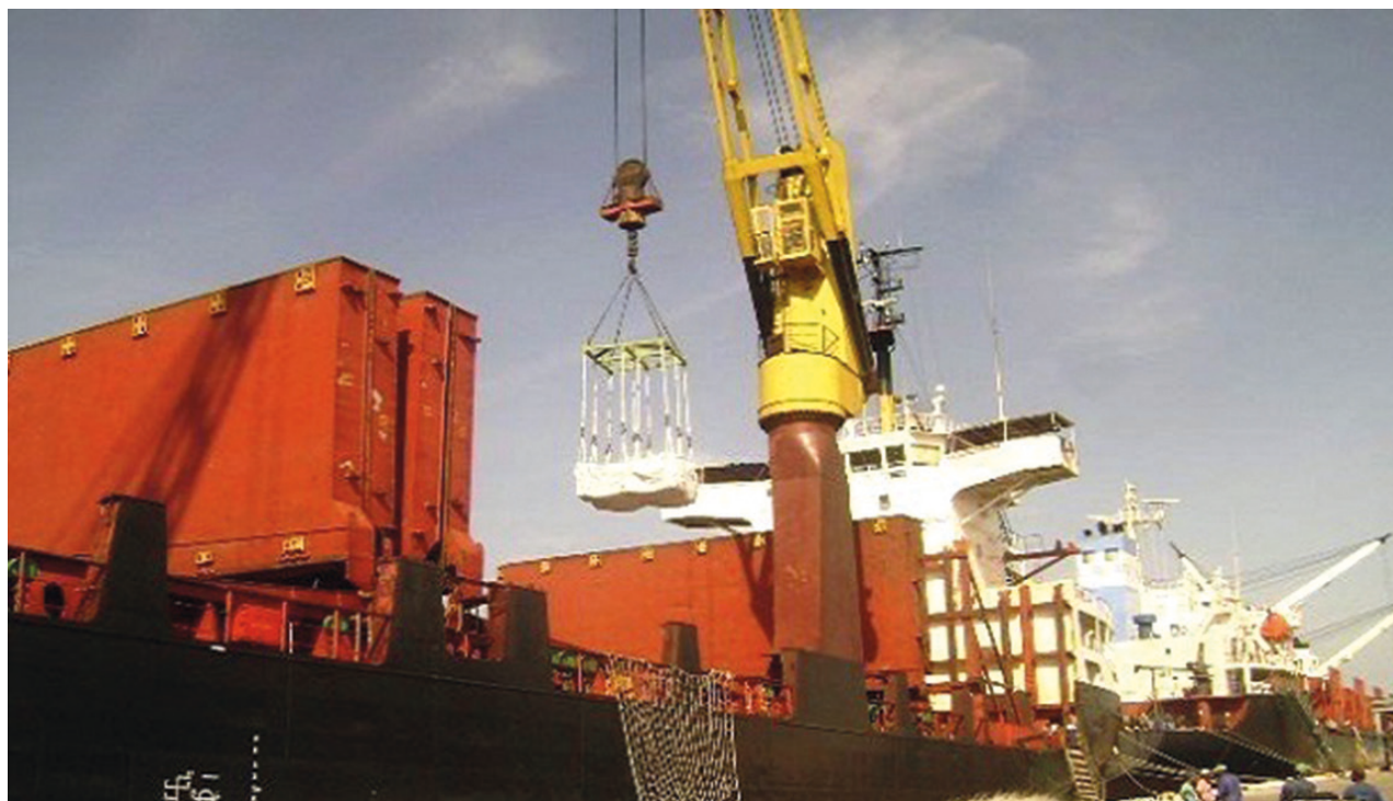
Puerto de Cienfuegos.

“Si no llegan barcos, hay que pagarles el salario y las utilidades, y en caso contrario la entidad tiene entonces que declararlo interrumpido, lo que no ocurre siempre. Al final surge una gran contradicción porque el interrumpido no tiene derecho al cobro de utilidades, mientras quien fue llamado y espera, sí. A ello se une que en no pocas ocasiones también el barco está cobrando estadía. Es decir, la economía nacional pierde tres veces”.