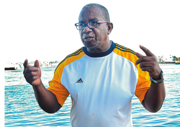
Con Guanabacoa no hay medias tintas.

“El estado de los baños es crítico, muy difícil. A pesar de una gran inversión para instalar taquillas, estas carecen de seguridad, por lo que son frecuentes las pérdidas de pertenencias personales.