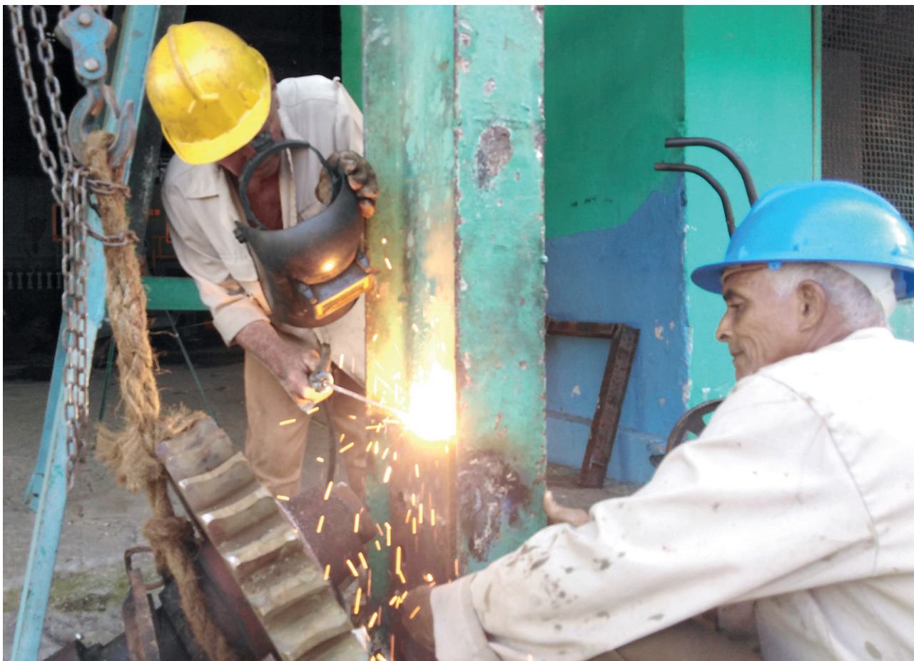
El alto desempeño merece ser recompensado.

Esa opinión parece no tenerse muy en cuenta en centrales como el Ciro Redondo. Allí, el aludido honorario es como una materia extraña, similar a las basculadas cada zafra.