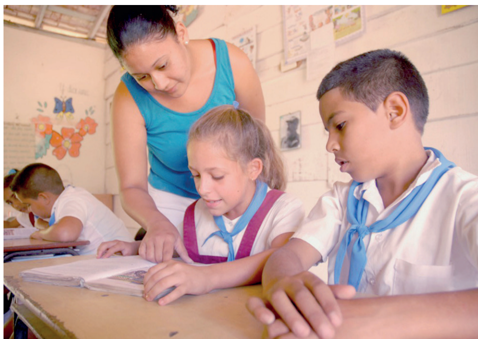
En el currículo de la escuela cubana el elemento de la formación ciudadana está presente desde las primeras edades.

“Este es un problema controvertido, siempre ha sido muy discutido, ya hace unos cuantos planes de estudio que la Ética desapareció como una asignatura que se recibía en la carrera pedagógica de Marxismo Leninismo e Historia, eso influyó en que para 1997 fundáramos la Cátedra de Ética aplicada a la Educación, en la Universidad de Ciencias Pedagógicas Enrique José Varona, para mantener la línea de investigación en el campo de la educación ético-moral, en valores y ciudadana, así como la docencia de una asignatura que surge en el