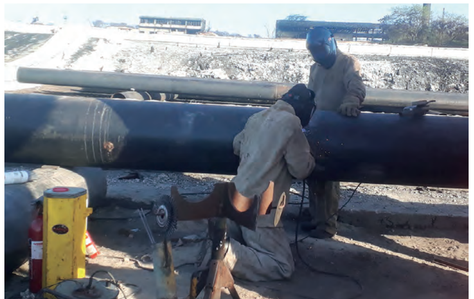
En esta fase recuperativa se sustituyen los tramos de tuberías que lo requieran para darle vitalidad a la Base de Supertanqueros.

| Juanita Perdomo Larezada