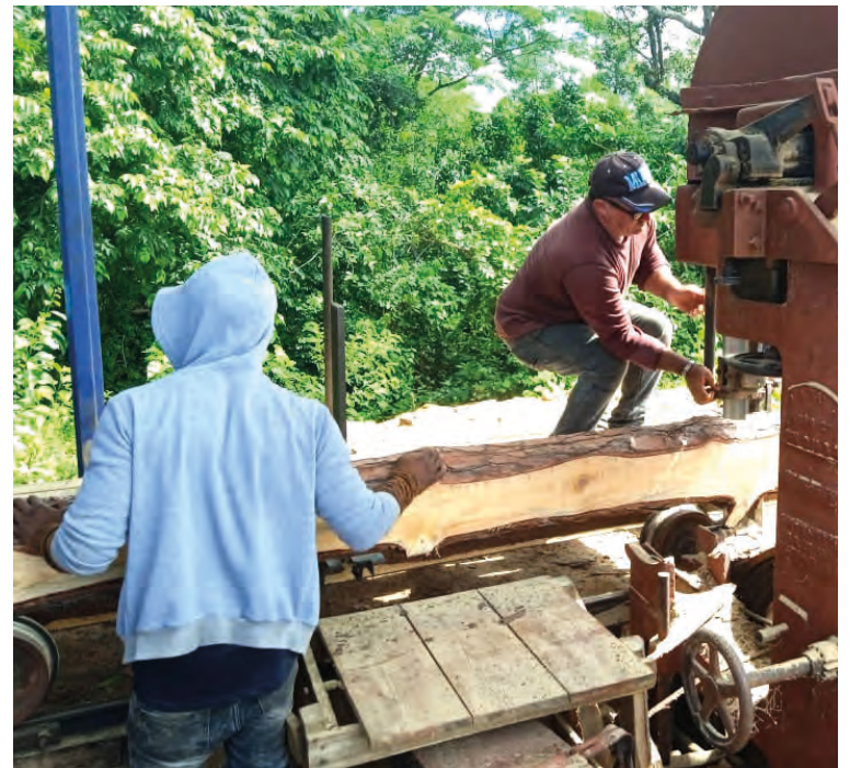
Una máquina con más de un siglo de existencia vuelve a su vida útil y alimenta proyectos de prosperidad.

Actualmente buscan asociación con artistas de la plástica para mejorar el acabado, pues el que brindan no cumple con los estándares de calidad que les garantizarían una mejor inserción en el mercado; Miriala Villacampa, administradora del centro, dice que todavía no