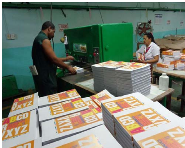
El poligráfico de Holguín produjo más de medio millón de libros para la Feria.

El empeño de este destacado colectivo obrero, acogido al sistema de gestión empresarial y con calidad certificada, estará reflejado en las tarimas de ventas, donde los lectores holguineros encontrarán diccionarios, libros de cocina y otros de gran demanda.