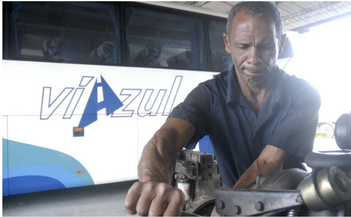
La gestión de la nueva dirección está dirigida a la solución de los problemas que existen en las áreas de taller, fregado y la ponchera.

¿Cuántas roturas, llegadas tardías o necesidad de trasbordos tuvieron el pasado año, lo cual ocasionó males entre los clientes? Si algo