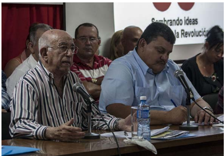
Machado Ventura llamó a los campesinos a no conformarse con sobrecumplimientos y a producir con eficiencia.