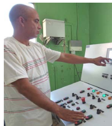
Anner reconoce las ventajas de la migración.