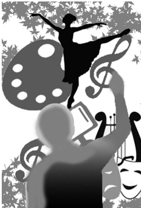
| Ilustración: Malagón

(2) Muchos creen que la belleza y la espectacularidad son necesariamente sinónimos de superficialidad. Otros creen que la densidad debe ser condición de lo profundo y contundente. Lo cierto es que el arte no es por esencia aburrido y gris. En Cuba todavía hay que librar la batalla por la belleza.