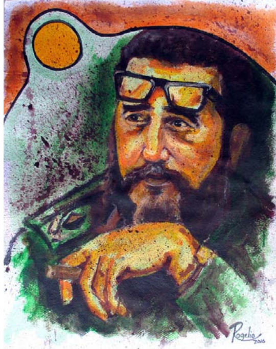
En cada pieza se hace homenaje a la vida de un hombre excepcional.

En esta exhibición, curada por quien suscribe estas líneas, vale señalar la recurrente alusión de la guataca, idea igualmente reiterada de forma minimal en los cuadros, cerámicas, grabados y esculturas del Guajiro. Este instrumento constituye para él un ícono del campesinado cubano, también devenido sello de su obra.