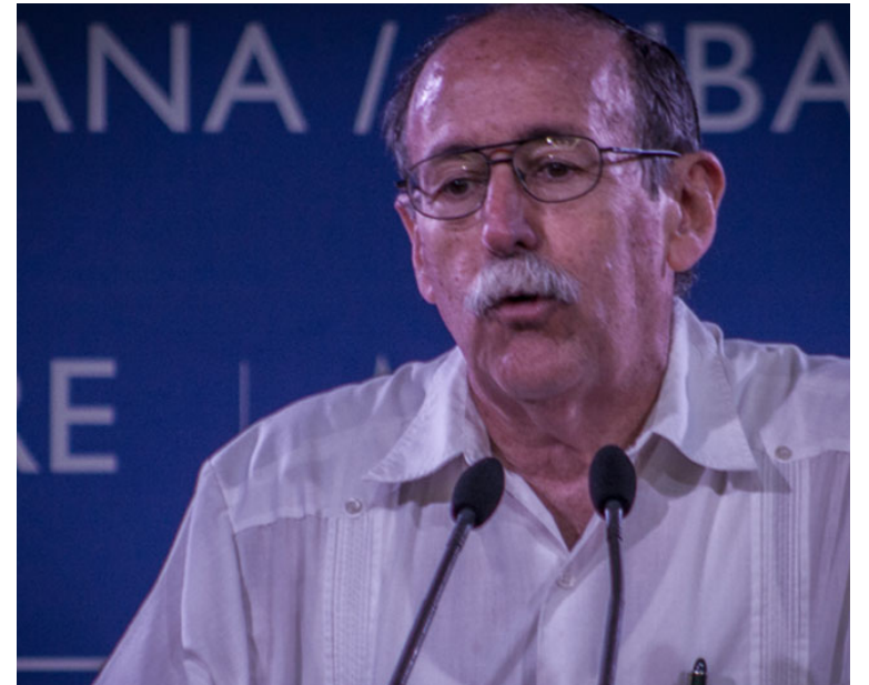
Lage en conferencia de prensa en el Hotel Tryp Habana Libre.

El Centro de Inmunología Molecular (CIM), de La Habana, tras 15 años de investigación, consiguió una vacuna terapéutica de prometedores resultados. El medicamento en cuestión se llama CIMAVax-EGF y podría convertirse en otro de los puentes que enlazan a Cuba con los Estados Unidos.