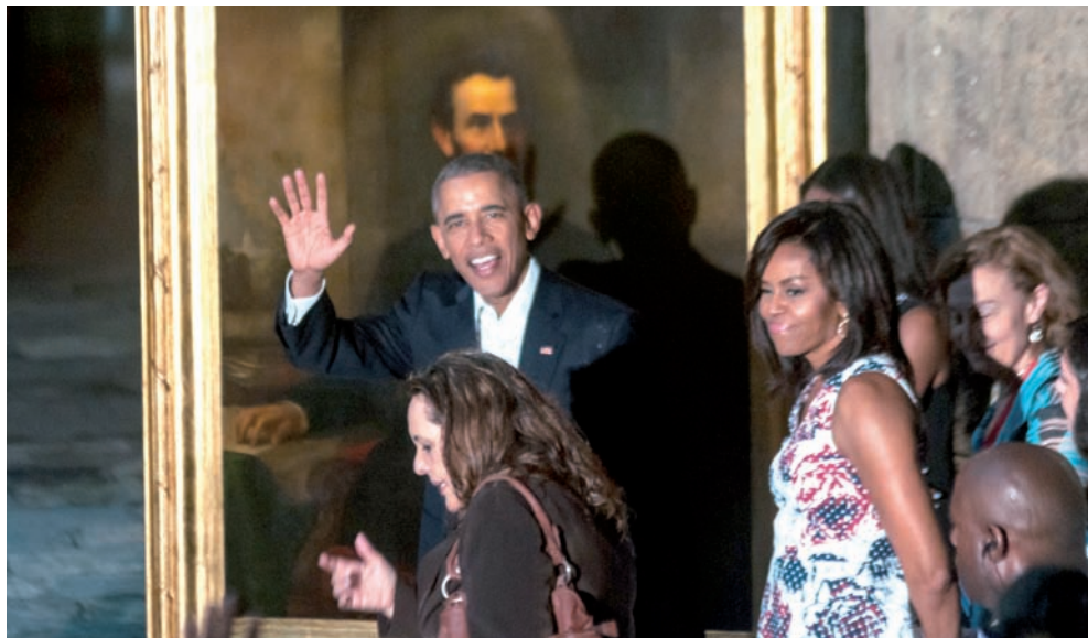
Durante su visita al Palacio de los Capitanes Generales.