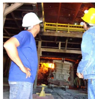
La migración favorece el funcionamiento del horno de arco eléctrico.