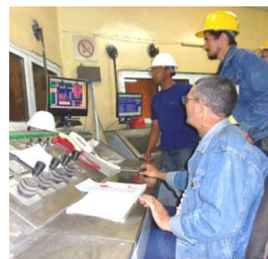
Cada proyecto tiene de componente la consulta con los operarios.