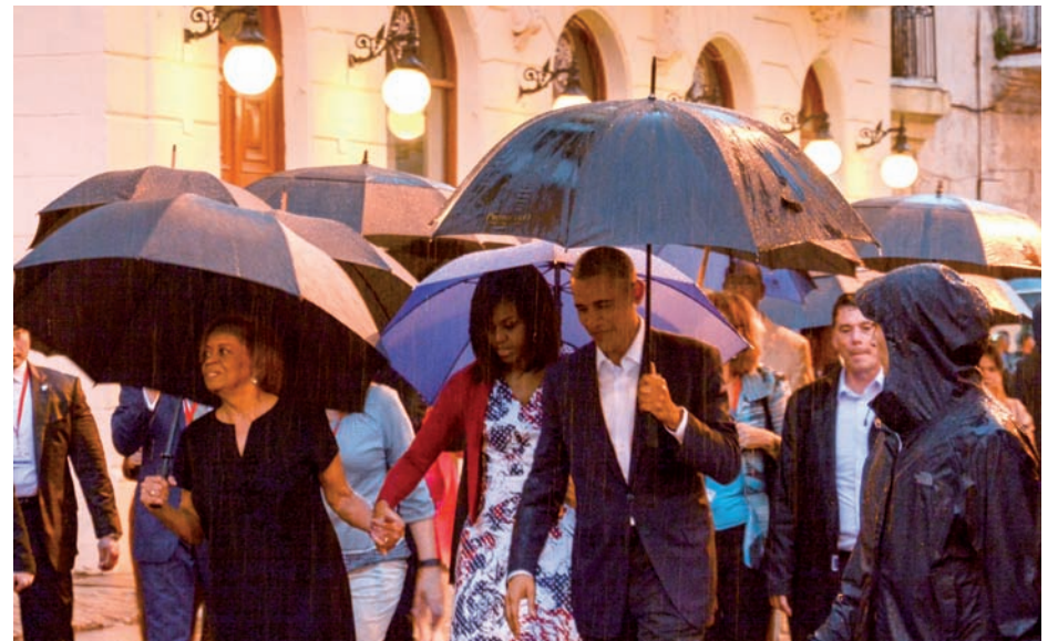
La tarde lluviosa no impidió que el mandatario realizara el recorrido por las calles de La Habana Vieja hasta la catedral, donde fue recibido por el cardenal Jaime Ortega.