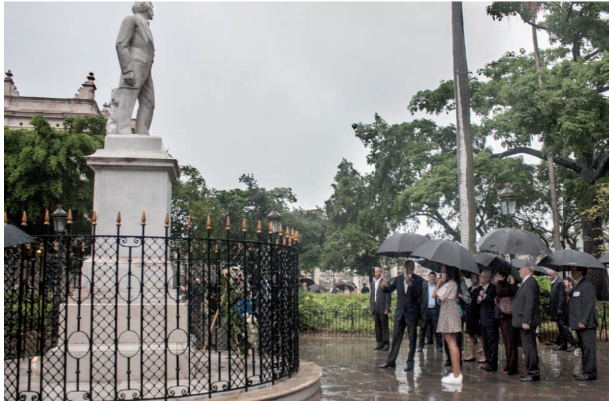
Al pie del monumento al Padre de la Patria, Carlos Manuel de Céspedes, llegó el presidente Barack Obama y la comitiva que lo acompaña.

El presidente Barack Obama, su familia y otros acompañantes fueron guiados en su recorrido por Eusebio Leal, Historiador de la Ciudad