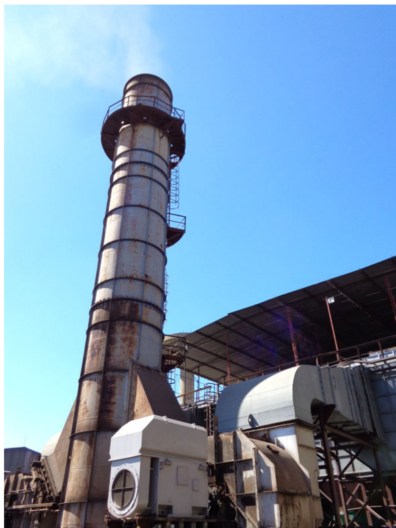
Esos procesos de migración reducen la emisión de polvos a la atmósfera.

Sirva este reportaje como reconocimiento al esfuerzo diario de todos los trabajadores del sector metalúrgico y electrónico de Cuba, cuyo día celebran desde el año 1994 cada 24 de marzo.