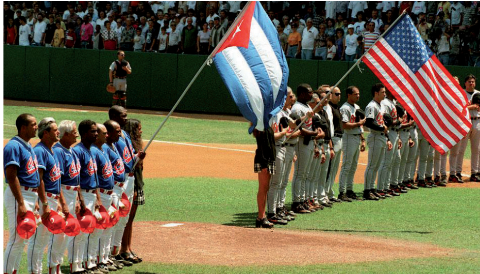
Cuba y Orioles de Baltimore en el Latinoamericano el 28 de marzo de 1999.

Cuba ha mostrado siempre una postura de respeto y consideración hacia el deporte estadounidense, así como interés para establecer vínculos beneficiosos para las dos naciones. Sin embargo, muchas veces ha encontrado delante presiones, dilaciones,