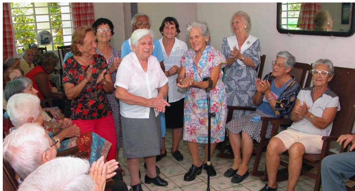
Vida larga y saludable, educación y nivel de vida dignos: índices del desarrollo humano.

Continúa la Mayor de las Antillas posicionándose en un contexto global complejo, buscando espacio, haciéndose notar como nación.