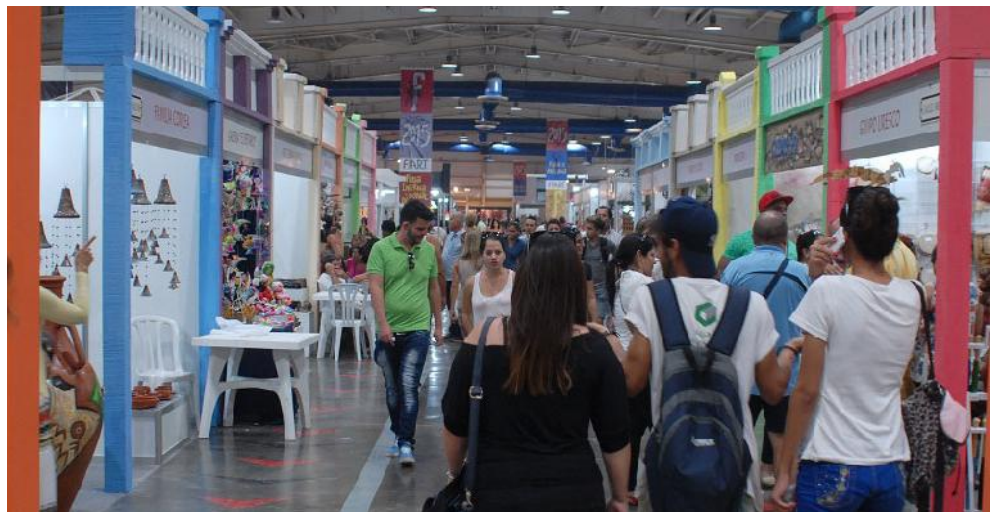
La espaciosa y admirable reproducción de la popular Calle del Medio, de Matanzas, dio la bienvenida a los visitantes con sus más de 10 stands con diferentes artesanías artísticas.

lombia, y a las cerámicas de Haregu, Patrimonio Mundial de la Humanidad, de Bucarest, Rumania; aunque hay que señalar que entre algunos países extranjeros presentes continuaban ofertándose elaboraciones provenientes de la industria, sobre todo de la textil y bisuterías, en contraposición a las afanosas manualidades de los nacionales.