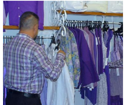
Freixas, un stand imprescindible en Fiart por su contundente representatividad de las confecciones textiles en Cuba.