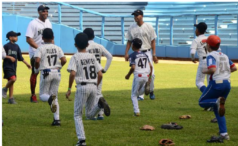
Clínica de béisbol en el Latino.