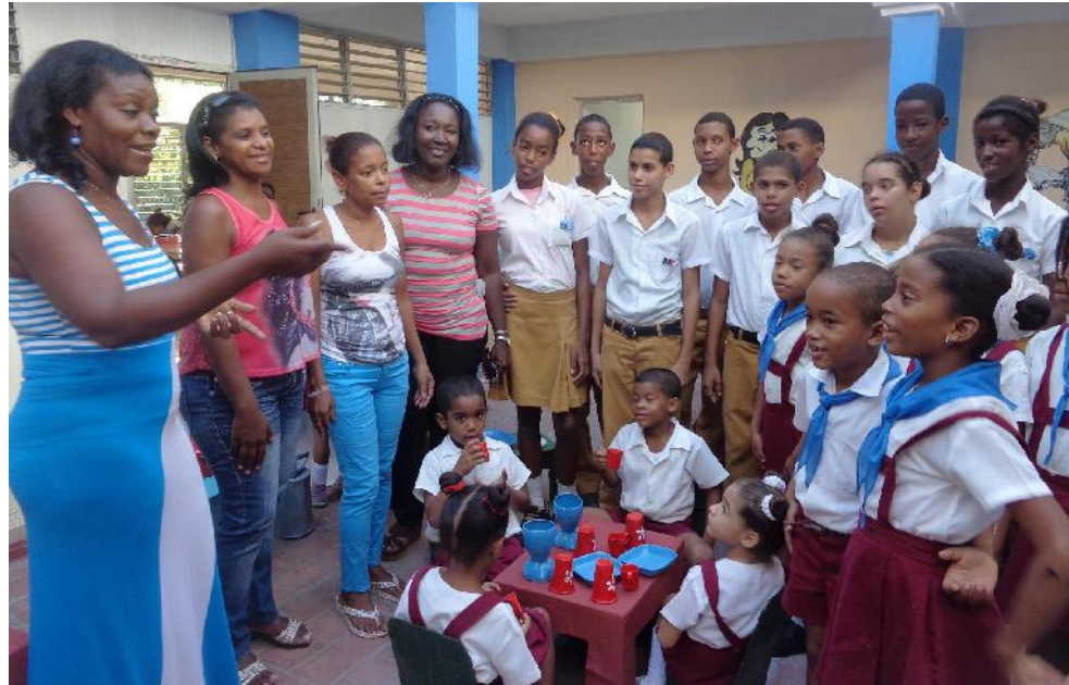
Armonizar cuatro enseñanzas en un mismo centro es tarea que se logra con la unidad del colectivo.

Quizás sea eso lo que más asombra al visitante —no así a los 482 alumnos, sus familiares, y a los 80 trabajadores—, pues solo pensar en cómo llevar a feliz término la educación de niñas, niños y adolescentes de preescolar, primaria, especial y secundaria básica, le pone los pelos de punta a cualquiera.