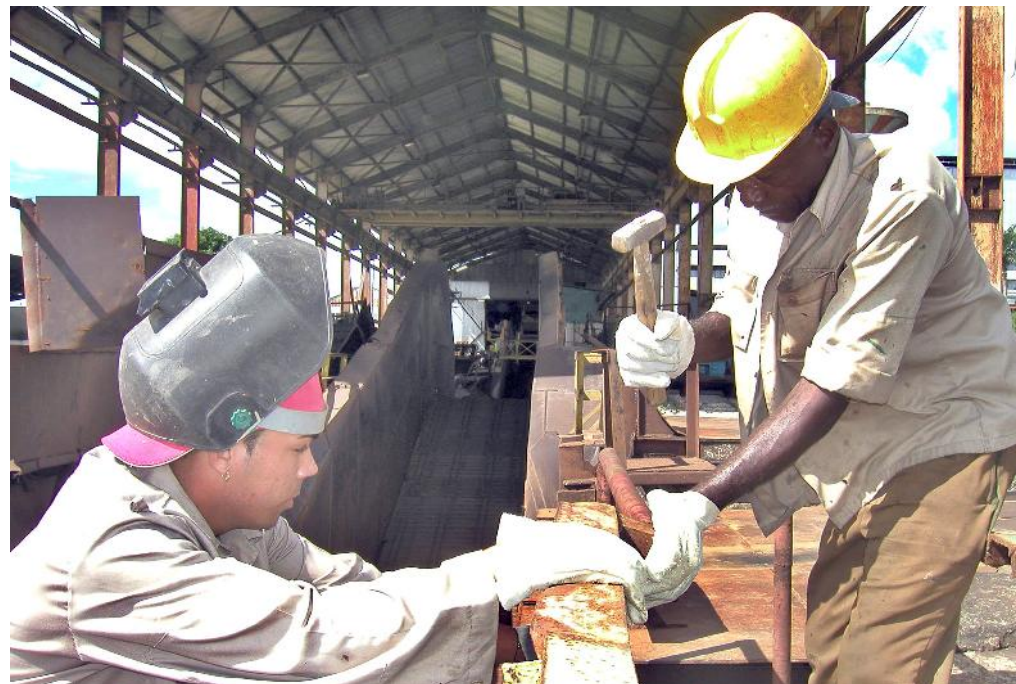
La aplicación de la Resolución 17 sigue generando preocupaciones entre muchos trabajadores.

relaciones de trabajo, su organización y retribución pone en desventaja a empleados y empleadores. En el contexto actual no es un lujo estar al día en cuanto a la legislación en general.