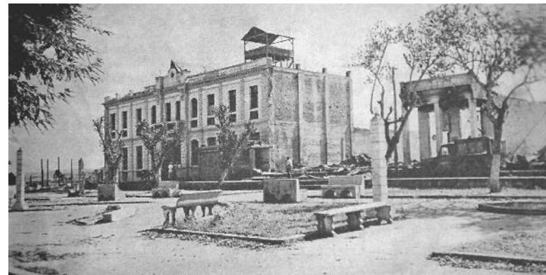
Rendidas una tras otra sus fortificadas posiciones, el ayuntamiento fue el último reducto del enemigo.

Desencadenado el combate, los efectivos que defendían la valla, la planta eléctrica, la descascaradora y Cuatro Vientos no tardaron en rendirse, y sus restantes posiciones quedaron divididas: las garitas en una parte, y en la otra, el ayuntamiento, El Mirador, la clínica y la jefatura de la policía. En la iglesia, al centro del pueblo, fue instalada la jefatura rebelde, encabezada por los coman-