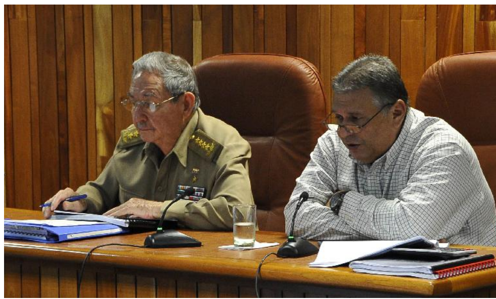
El General de Ejército Raúl Castro Ruz y Marino Murillo Jorge, vicepresidente del Consejo de Ministros y ministro de Economía y Planificación.

Las dificultades luego del primero de enero han sido mayores, expre-