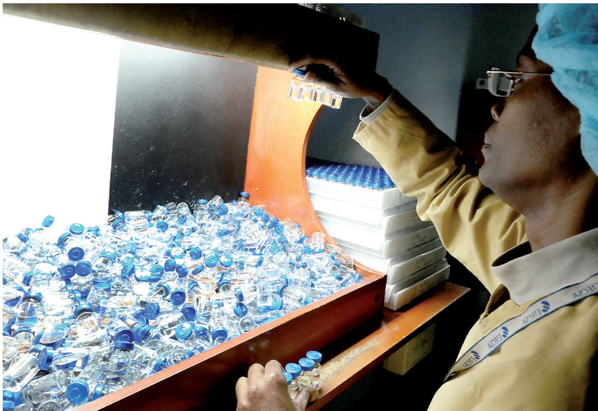
Importante aporte de la biotecnología a la economía.

Entre los meses de enero y marzo la CTC y sus sindicatos desarrollarán asambleas con los trabajadores para la presentación e información sobre el plan de la economía y el presupuesto del año 2016.