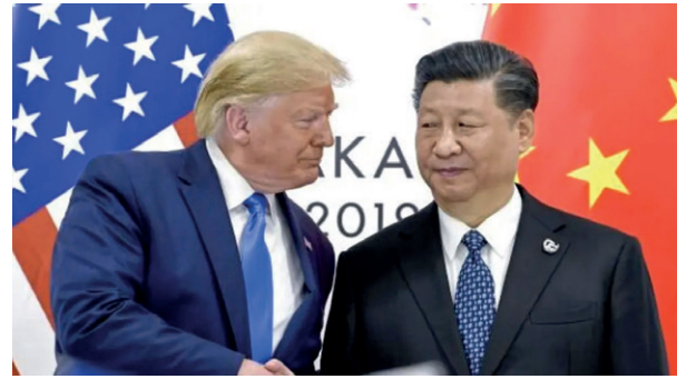
Los presidentes Xi Jinping y Donald Trump durante la Cumbre del G-20 efectuada en Osaka, Japón, junio del 2019.

Con su política arancelaria, el mandatario convirtió al mundo en un mercado donde el comprador nunca se siente seguro. En su opinión valió la pena, al menos eso ha dicho al reconocer que más de 75 países le han contactado para nego-