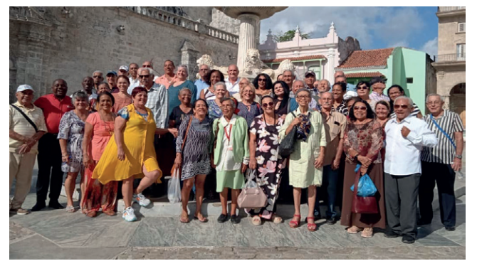
En el ya tradicional encuentro de la CTC con veteranos dirigentes sindicales se destacó su compromiso con el trabajo sindical y con la organización, representación y guía de los trabajadores. Posteriormente hicieron un recorrido por el Centro Histórico de La Habana.