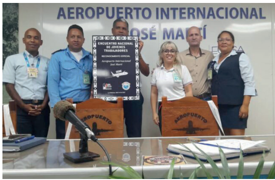
Más de 50 jóvenes destacados de diferentes sectores participaron en un intercambio organizado por la CTC que tuvo como sede el Aeropuerto Internacional José Martí. Su colectivo recibió una placa de reconocimiento por la importante actividad que realizan día a día sus trabajadores.