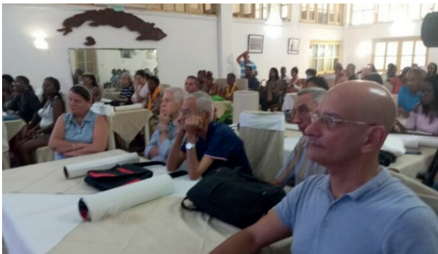
El coloquio Martí antimperialista efectuado en el capitalino Palacio de los Torcedores trató también la trascendencia del Concepto de Revolución expuesto por el Comandante en Jefe el Primero de Mayo del 2000 en la Plaza de la Revolución José Martí.