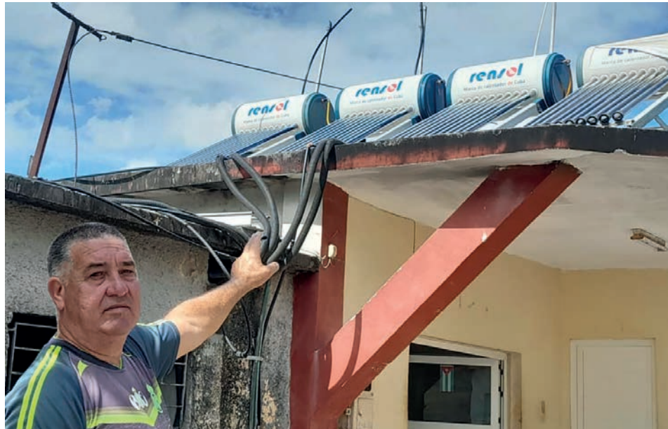
Cuatro centros productivos ya han dado los primeros pasos para el cambio de matriz energética y otros se unirán paulatinamente.