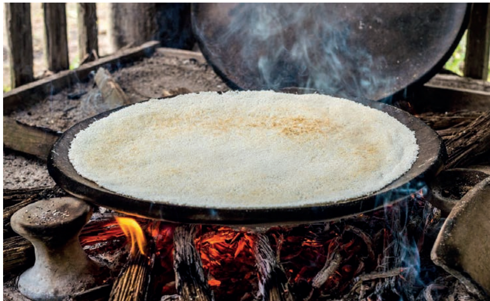
Cocción de la torta de casabe tradicional.

“Al elegirlo por encima del pan estamos favoreciendo a los productores locales y, por tanto, a las economías nacionales. Si lo fomentamos y fortalecemos generamos empleo dentro del país, lo que lleva al desa-