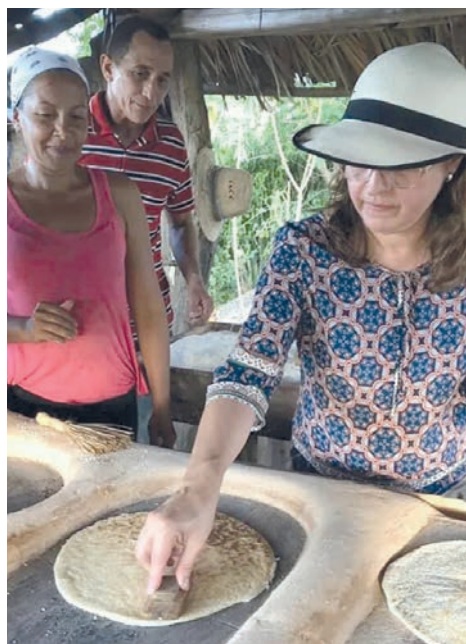
Preparación del casabe en un burén.

rollo local y que implica también la salvaguarda de nuestros valores patrimoniales”.