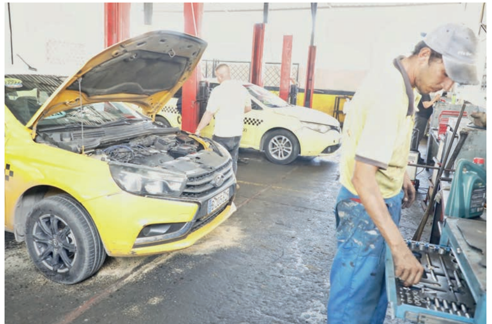
En la Agencia 2 de Taxis Cuba, la sindicalización no es solo aporte: es familia, respaldo y sentido de pertenencia.

Hay orden, higiene y buen trato, ¿cuadra en este negocio la afiliación al sindicato?, fue la pregunta y no de-