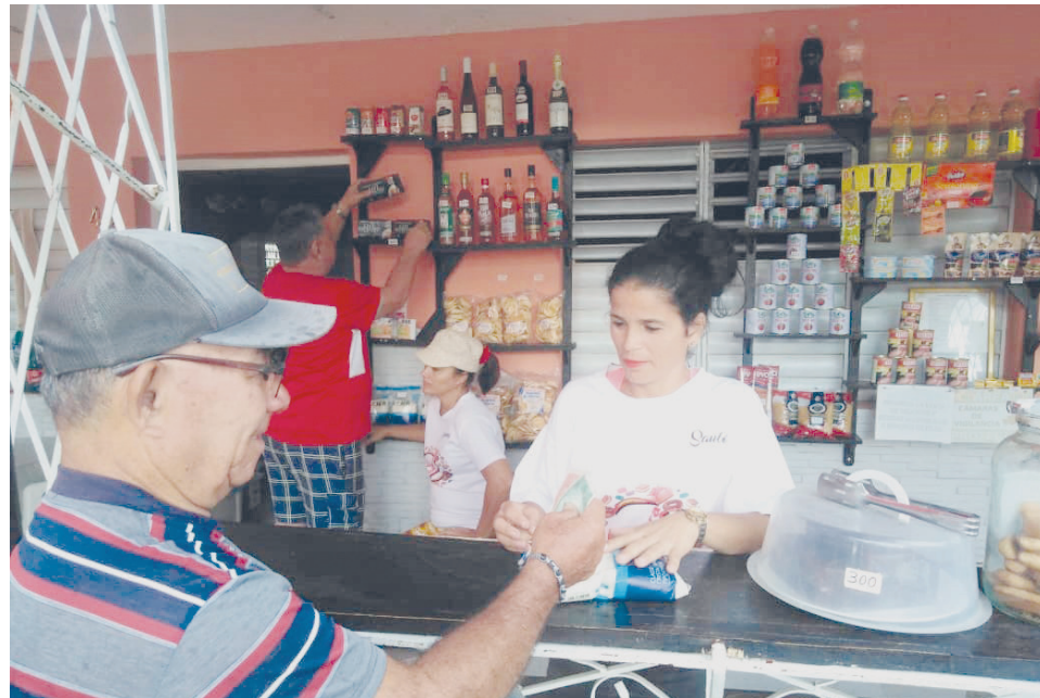
Toca al sindicato representar y tramitar las inquietudes de sus afiliados en el comercio La Violetera, en el municipio avileño de Ciro Redondo.