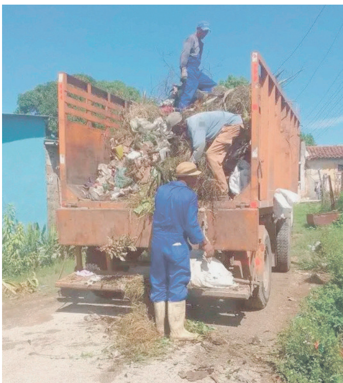
En Almaley, como en una empresa estatal, el sindicato vela por sus afiliados que son los trabajadores.