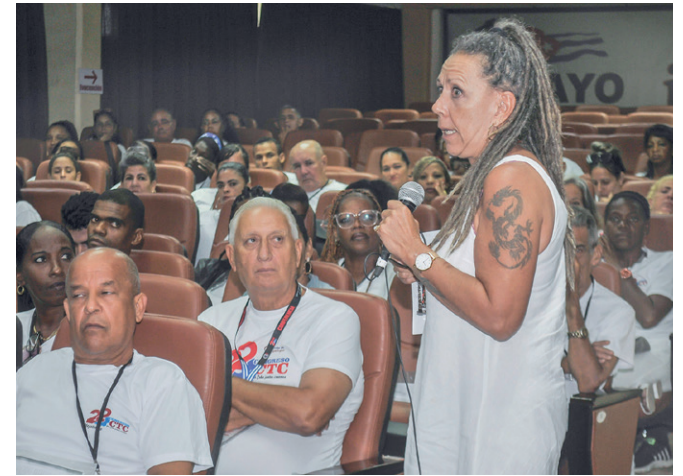
Unirnos por Cuba, un mensaje desde el trabajo no estatal.