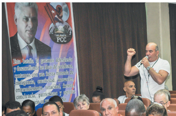
Los aniristas se centran en las soluciones.

“También le entramos con alma innovadora al mantenimiento de la unidad generadora número 2. Reparamos la bomba polimetálica que,