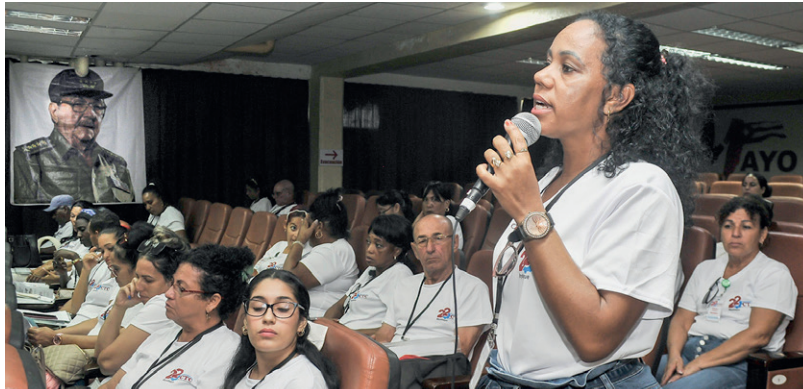
Al dinamismo y preparación de las secciones sindicales y los valores patrios, prestaron atención en Mayabeque.

“¿Por qué hay entidades que no encuentran este camino? La respuesta lleva una