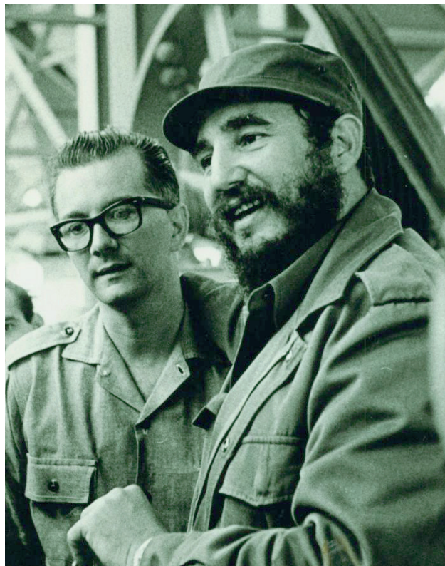
Hart fue el mejor intérprete de Fidel en términos de política cultural.

“Reducir la política cultural de la Revolución a los planteamientos de ese documento sería injusto. Pero ciertamente en esa intervención están los pilares de toda la estrategia posterior.