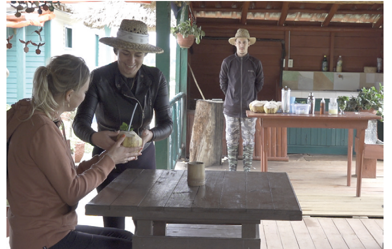
Los jóvenes reciben el legado de las tradiciones.