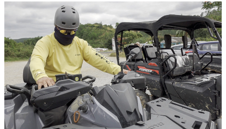
A las caminatas y cabalgatas se suman también, entre las modalidades de recorrido para las georrutas, vehículos modernos, fruto de otro proyecto de desarrollo local impulsado por los especialistas del parque.