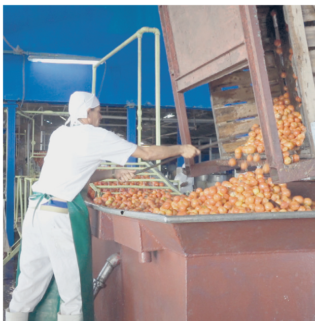
Los picos de cosecha representan un reto, pero el mayor desafío es buscar alternativas para mantenerse a salvo de las interrupciones.

“Somos como una familia; hace unos días había una niña en el pediátrico, necesitaba sangre, se llenaron dos guagüitas con gente