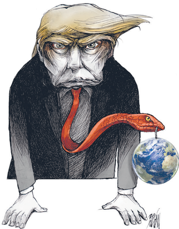
Caricatura Tomada de Foreign Affairs Latinoamérica