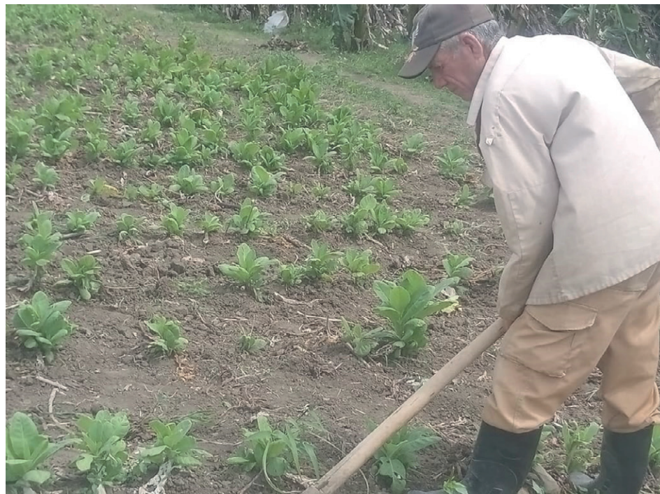
Cheo trabaja por la inmediatez del bolsillo y desestima la seguridad social.

“Ojalá caiga a ver si la tierra afloja”, auguraba el jornalero sin interrumpir su paso de guataquear. “A esto me he dedicado todo el tiempo. Los años pesan, cumpliré 63, con experiencia y fuerzas para echar pa'lante”, suelta en ráfaga el espirituano sin apartar la vista del surco, donde repasa una capadura de tabaco (el brote que germina tras el primer corte).