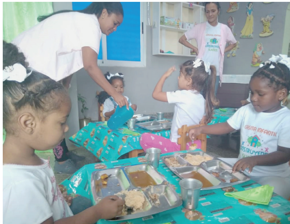
Muchos actores económicos apoyan con alimentos la casita infantil de la Empresa de Cemento Mártires de Artemisa, y los niños viajan con sus padres en el transporte de la fábrica.

Hay una paradoja difícil de ignorar: aún quedan capacidades sin utilizar por la falta de demanda, mientras más de 400 madres trabajadoras —principalmente de los sectores de educación, salud pú-