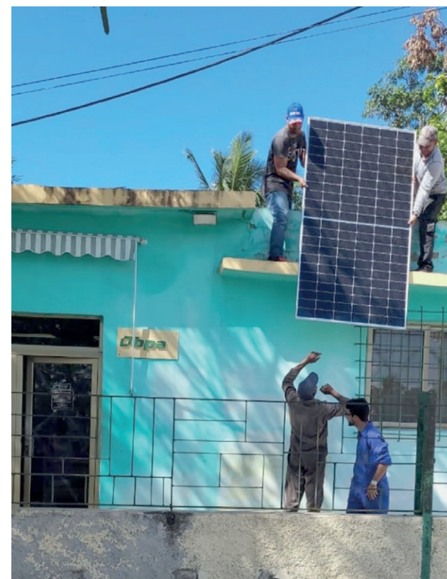
En Xólido no solo creen que las energías renovables son el camino hacia un mundo más limpio y eficiente, sino que paso a paso lo hacen realidad en Santiago de Cuba.

“Igualmente, ciencia e innovación son básicos en nuestra organización, las potenciamos en un acercamiento y mutuo aprendizaje con instituciones como el Centro de Investigaciones de Energía Solar, el Instituto de Proyectos Azuca-