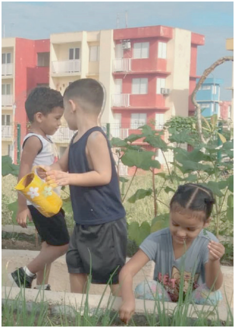
Cada comunidad y los centros aledaños deben sensibilizarse con los círculos infantiles, pues estos forman seres útiles.

hacia gestiones más ágiles, encadenamientos productivos y apoyos locales que sostengan el cuidado allí donde hoy se resuelve con más voluntad que recursos. Las casitas infantiles y los cuidados han surgido con creatividad y compromiso, pero aun así revelan brechas: no todas las entidades pueden sostener una casita ni todas las familias pagar un cuidado. Por eso, fortalecer los círculos infantiles sigue siendo una necesidad estratégica. Atenderlos mejor —como la red más amplia y con vocación universal creada por Vilma Espín el 10 de abril de 1961— implica garantizarles estabilidad, recursos y acompañamiento real. Apostar por la primera infancia es, en definitiva, asegurar el futuro del país.