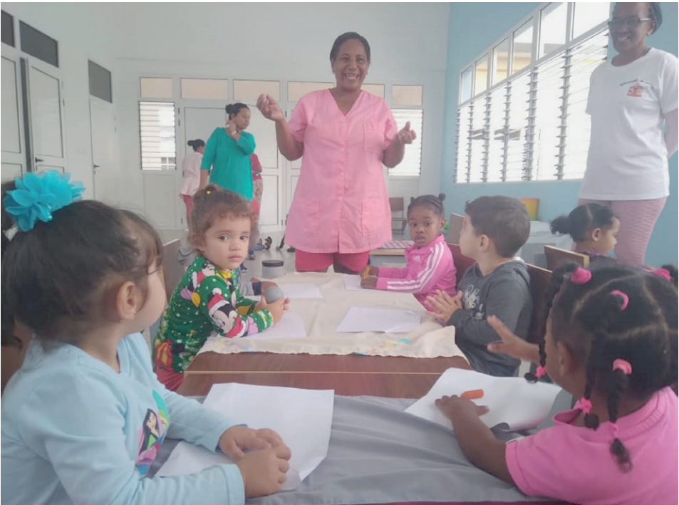
Carrusel de Colores es la primera obra, de lo que será un Complejo Educacional en Caguairán, Mariel, y no solo para trabajadores de la ZEDM.