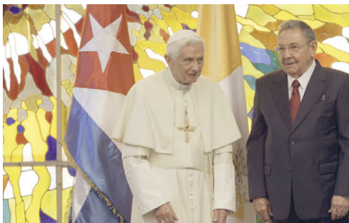
El funeral del pontífice alemán Joseph Ratzinger, quien comandó la Iglesia Católica como Benedicto XVI del 2005 al 2013, tendrá lugar el 5 de enero, a las nueve y treinta de la mañana en la basílica de San Pedro y lo oficiará el papa Francisco. Será

un funeral solemne, como corresponde al cargo que ostentó, y también sobrio para respetar la voluntad de Ratzinger, quien pidió una despedida sencilla. No contará con delegaciones oficiales, exceptuando a Italia y Alemania. La nota de prensa de Matteo Bruni, director de la Oficina de Prensa de la Santa Sede, precisó que el cuerpo del Papa emérito estará en la basílica de San Pedro del Vaticano a partir de la mañana de hoy lunes 2 de enero del 2023 para la despedida de los fieles. El féretro será enterrado en las grutas vaticanas, donde se encuentran las tumbas de los papas, precisó el Vaticano en un comunicado. El papa Benedicto XVI realizó una visita apostólica a Cuba en marzo del 2012 cuando fue recibido por el entonces Presidente de los Consejos de Estado y de Ministros, Raúl Castro Ruz. | YDM | foto: Ismael Francisco