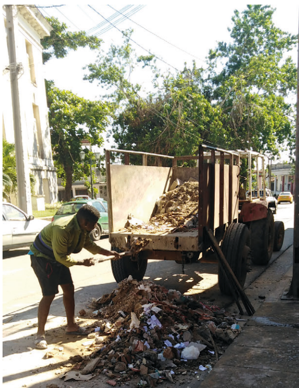
Más de 800 mil metros cúbicos de desechos se recogieron en la provincia.