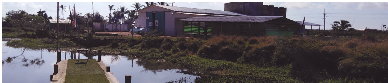
En la imagen Sede del KM 20. MOR (Museo Orgánico Rural para el arte moderno y contemporáneo), de La Coloma.