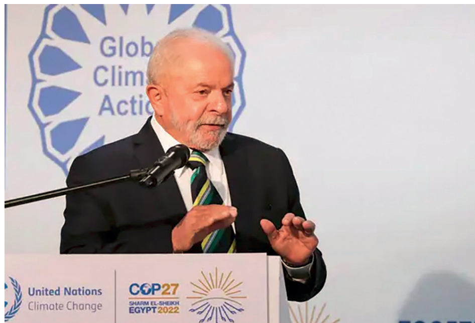
Lula da Silva regresó a la palestra internacional durante la 27ª Conferencia de las Partes (COP27) de la Convención Marco de Naciones Unidas contra el cambio climático, celebrada en noviembre del 2022 en Sharm el-Sheikh, en Egipto. Allí propuso que Brasil sea sede de la conferencia de países del Tratado de Cooperación Amazónica para aunar esfuerzos contra el deterioro del pulmón verde más importante del planeta.

Ello explica por qué la primera acción de Lula, aún antes de