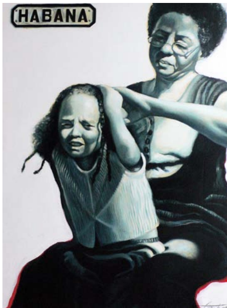
El precio de la belleza. Óleo sobre lienzo. 90x120 cm, 2015.

Con absoluta libertad artística, en Destellos de cubanidad , él nos insta a disfrutar de una amplia diversidad temática: desde sentimientos y emociones sociales hasta determinados juicios, inquietudes y expresiones individuales, dispuestos de manera muy intimista, con ciertos toques líricos. Se trata de su visión e interpretación sobre personajes y situaciones extraídos del entorno en que vive el artista, suerte de fusión del dibujo académico, la abstracción y la figuración expresionista, a tra-