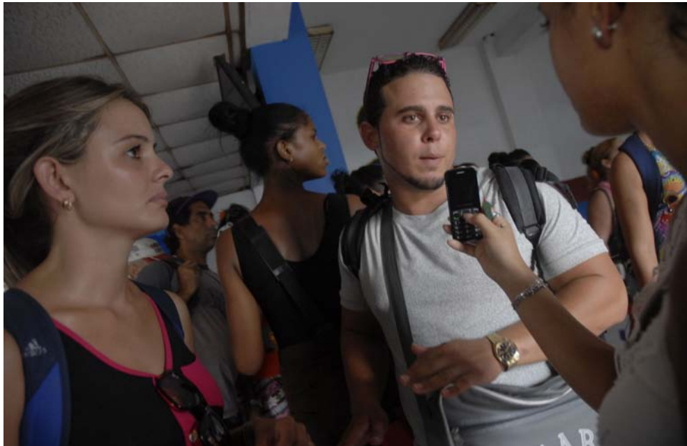
Los estudiantes están entre los que más viajan en camiones y autos particulares los fines de semana.