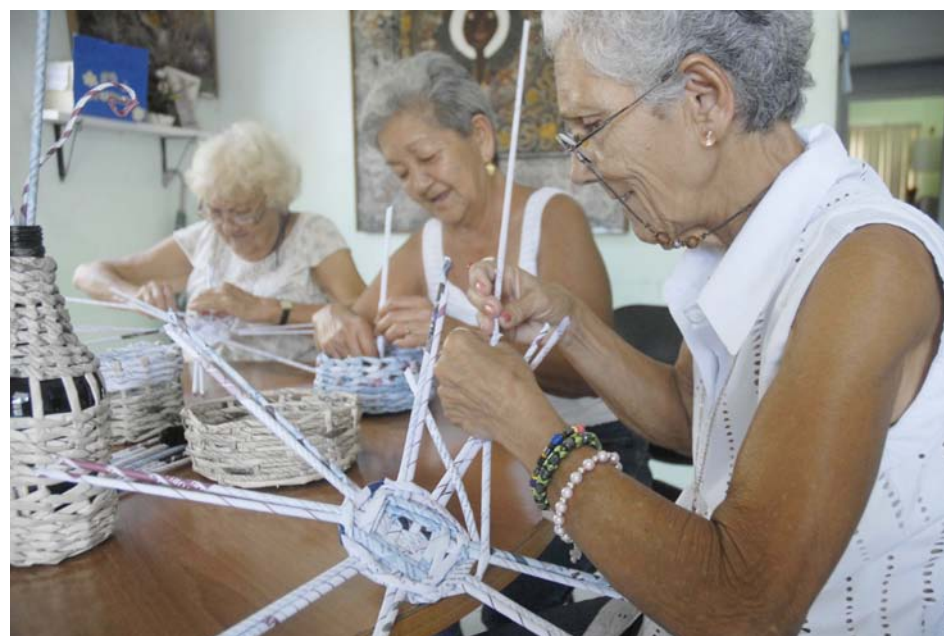
Es vital la ejercitación continua de las personas de 60 años y más, así como expresarles el afecto que les profesamos.

mejor los factores de riesgo de la demencia y de la enfermedad de Alzheimer y sus impactos en los adultos mayores.