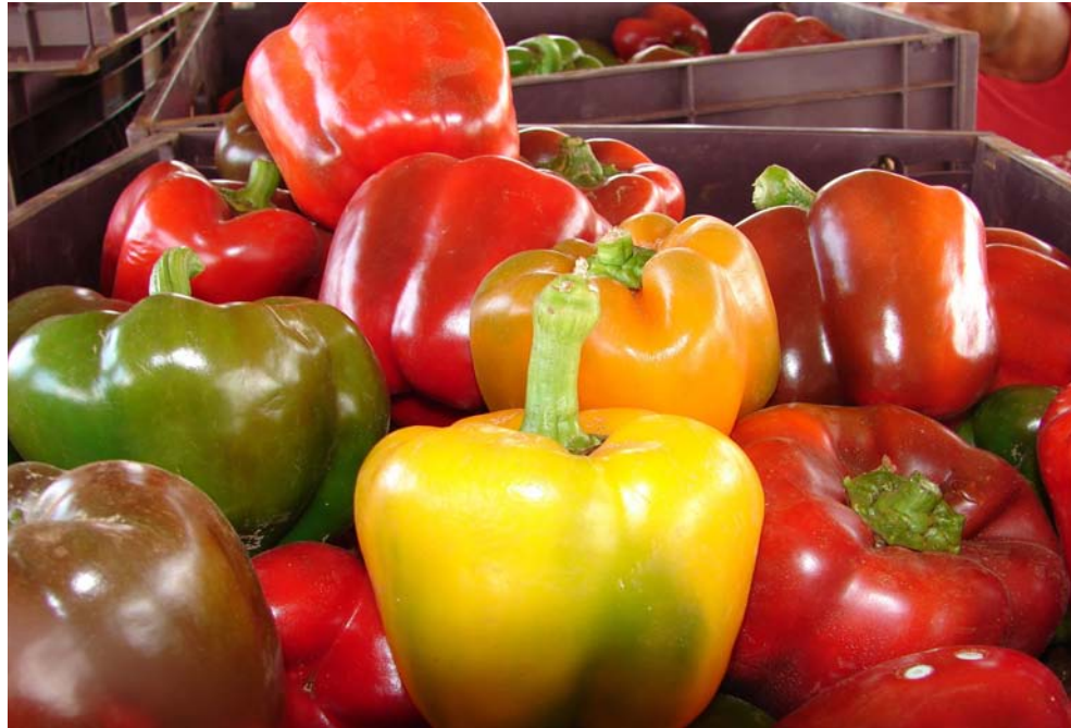
El pimiento que se obtiene en cultivos protegidos se logra con híbridos que no se pueden reproducir en Cuba.