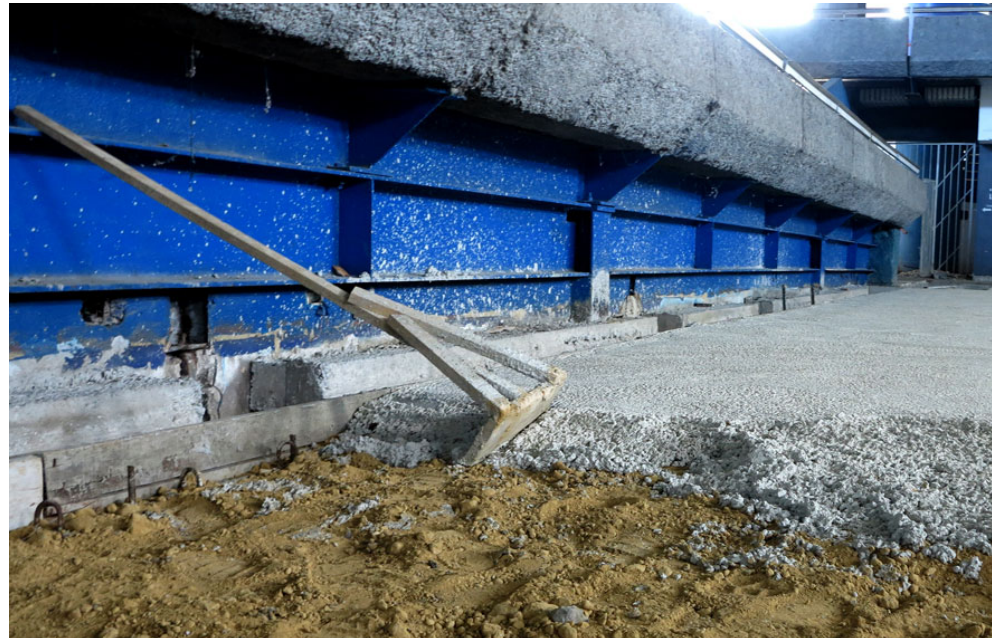
Entre 158 y 211 metros cúbicos de hormigón fueron necesarios para completar el relleno del foso.

Patterson comentó la idea de que el tabloncillo sea instalado antes de finalizar el 2015 y tenerlo listo para acoger eventos deportivos programados para enero del 2016. No obstante, aún restan cuestiones por resolver, como la situación de algunas zonas de