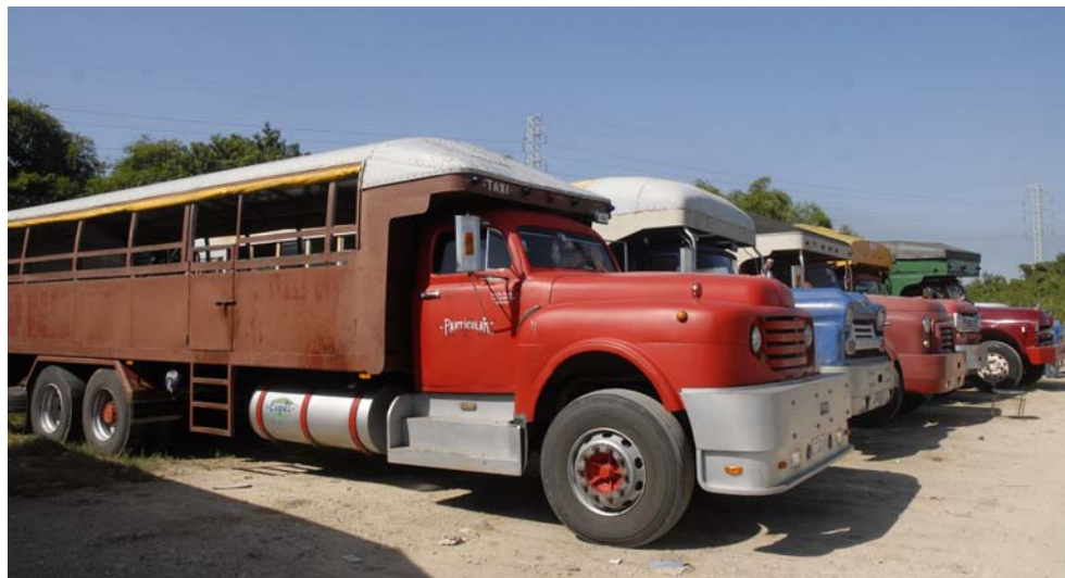
De enero a septiembre se han producido 37 accidentes con consecuencias masivas —el 0,5 % del total de los accidentes ocurridos en el país—; estos han provocado 61 muertos y 475 lesionados.

“En esos casos son revisados, como los ómnibus en las terminales, entre ellas, Santiago de las Vegas, Co-