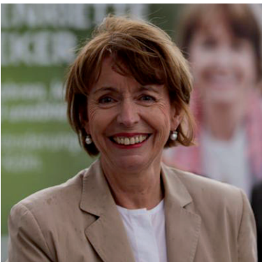
Henriette Reker ganó este domingo la alcaldía de Colonia.

En una cama de hospital recibió este domingo Henriette Reker la noticia de que finalmente sería la alcaldesa de Colonia, ciudad alemana donde se postuló como candidata independiente y en la que dirige los programas de acogida de refugiados que la convirtieron en el blanco de un atentado racista el sábado.