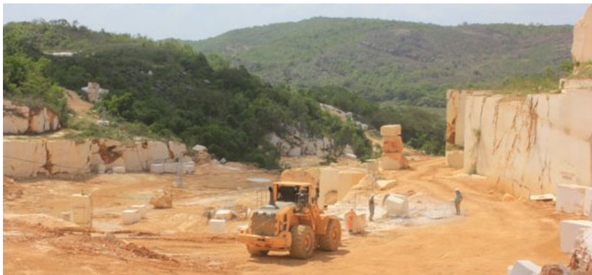
En la cantera de mármol de Granma se aplica un proyecto de explotación ejecutado en Ceproníquel.