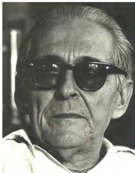
"El legado de Félix Pita Rodríguez pertenece a la cultura nacional", afirmó la destacada poetisa y promotora cultural.

Durante mucho tiempo ella igualmente llevó, de forma sistemática, comentarios y lecturas de textos a las fábricas de tabacos, a la manera tradicional de estos centros; mientras que fue también fundadora del Movimiento Nacional de Talleres Literarios y de los espacios culturales Ágape y Fe de Vida, del Arzobispado de La Habana; en tanto desempeñó el cargo de vicepresidenta de la Campaña