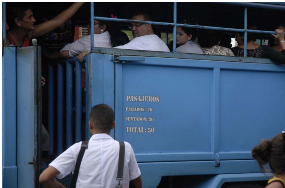
Muchos violan el número de pasajeros que pueden ir de pie.

saliera de la calzada bordeando todo el paseo, a la vez que impactó con una alcantarilla y se volcó varias veces.