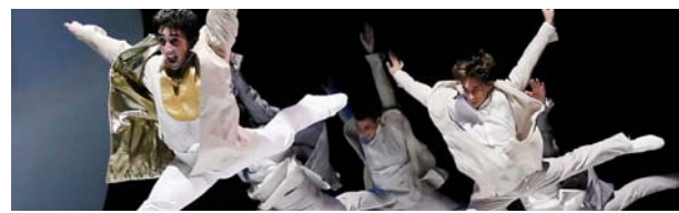
Cenicienta es un gran espectáculo.