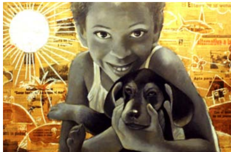
Amistades inocentes. Técnica mixta. 120x80 cm, 2010.

vés de la cual logra una síntesis dramática del trazo y el uso minimalista del color, en cuadros de medianos y grandes formatos.