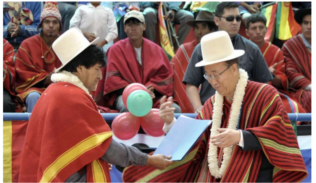
Evo Morales entrega a Ban Ki-moon la Declaración de Tiquipaya para salvar a la Madre Tierra, rumbo a la COP 21.