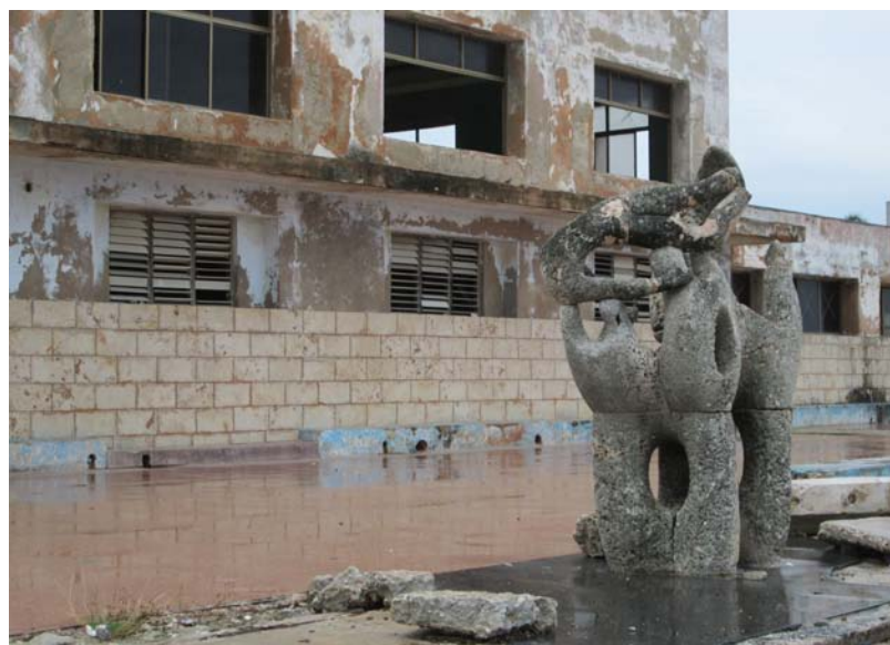
La escultura de Rita Longa y un fragmento de la edificación principal de la escuela: imagen de la desidia.

a solas que acabé ante la lastimada escultura de Rita Longa llamada Memorial Marcelo Salado, realizada en 1971 y que ahora simboliza también la resistencia de una escuela plantada frente al mar, negada a desaparecer.