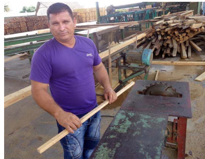
Más de 600 innovadores ayudan a mantener funcionando la tecnología con varias décadas de explotación en la EFI Macurije.

Con ese trabajo se elevó la producción y el rendimiento de las materias primas, para un mayor aprovechamiento de los bosques y menor deterioro del medio ambiente.