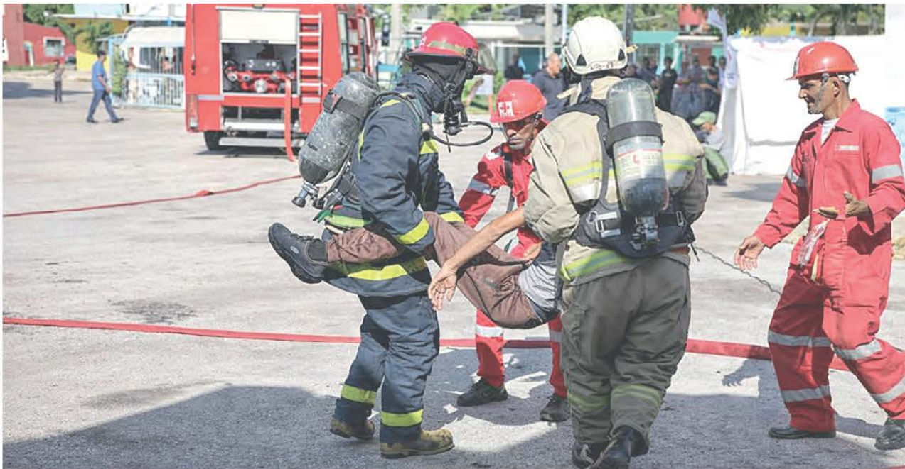
Fuerzas y medios de la unidad de bomberos activos en el simulacro de un incendio.

Diferentes simulacros de evacuación, extinción de incendios y protección de instalaciones con la participación de brigadas especializadas se desarrollaron este fin de semana en el país como parte del Ejercicio Popular de las Acciones en Situaciones de Desastre Meteoro 2026