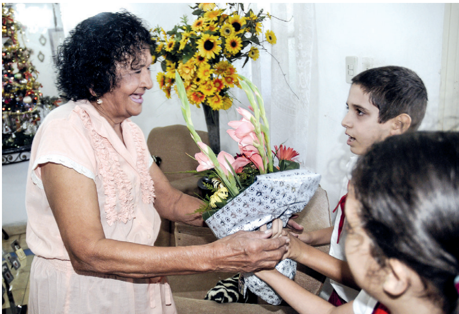
Sus niños la congratulan con flores.

en su tono de voz, y su delicada sonrisa evidencia dulzura, la misma que durante muchos años transmitió a sus niños —así les llama— de ahí que atesore hoy como sus momentos de mayor regocijo las