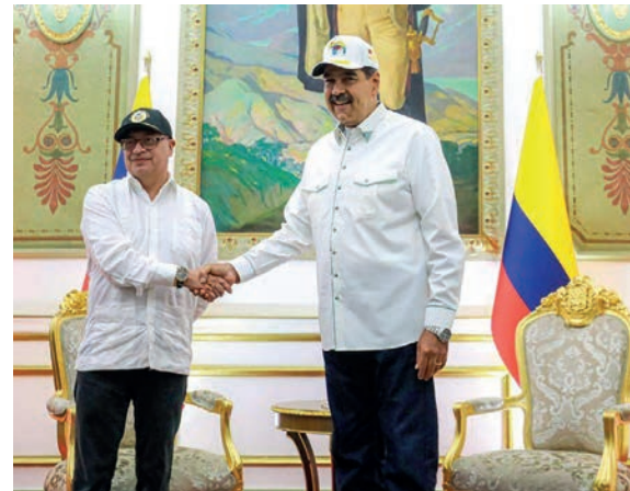
El mandatario venezolano junto a su homólogo colombiano.

Petro declaró que Colombia y Venezuela son “el mismo pueblo, la misma bandera, la misma historia”, y alertó que cualquier intento de intervención militar sin el aval de los países de la región será considerado una agresión a toda América Latina y el Caribe. Además rechazó cualquier intento de fragmentar Nuestra América y evocó el pensamiento integracionista de Simón Bolívar y José Martí.