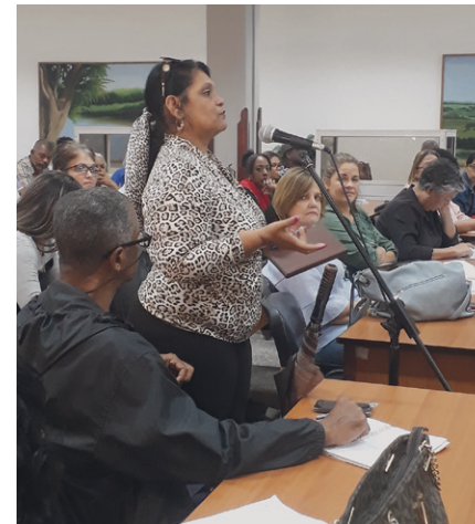
Con este seminario comenzó la preparación para la implementación de mecanismos que flexibilizan la aprobación del salario en el sistema empresarial.