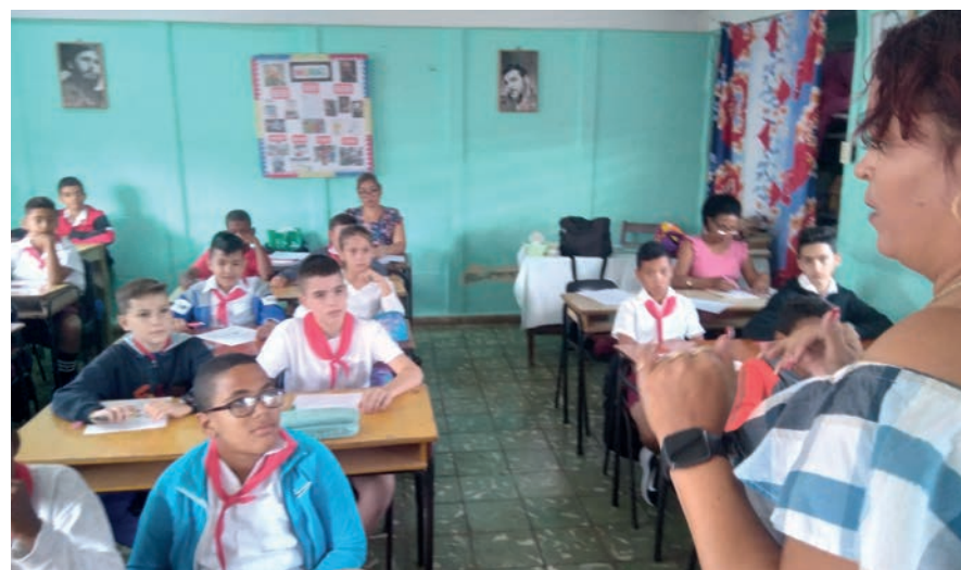
A 12 días del huracán, aún sin electricidad dentro del plantel escolar, retornaron a la docencia en la escuela Orlando Nodarse, de Artemisa.