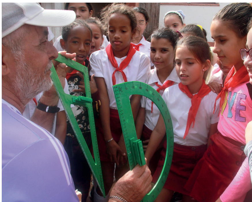
La sapiencia de un educador, a sus 75 años de edad, busca cómo enamorar a sus alumnos de la asignatura preferida, Matemáticas.

Esta fue una de las dos escuelas de la ciudad cabecera con mayores afectaciones, ha-