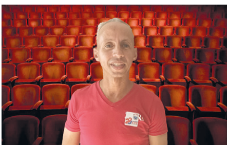
La superación distingue el crecimiento profesional del obrero calificado en instalaciones eléctricas, ahora especialista