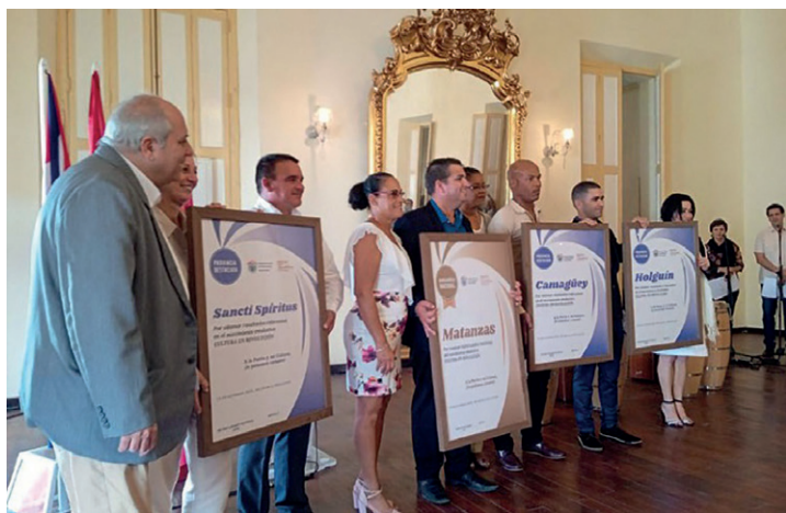
En el acto nacional, celebrado en Matanzas, el ministro de Cultura entregó reconocimientos a los representantes de las provincias ganadoras de la emulación. | foto: Cortesía del SNTC

El Sindicato Nacional de Trabajadores de la Cultura (SNTC) tiene que ser un actor clave en el respaldo a esta labor. Este año, en el que se realizaron las Conferencias Provinciales de la organización, se han abordado temas relacionados con las condiciones laborales, la política cultural y el impacto de la cultura en el desarrollo social. Son reuniones preparatorias para la Conferencia Nacional que tendrá lugar el próximo año, un espacio estratégico para trazar nuevas metas y fortalecer el trabajo en todas las instancias. | YN