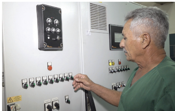
La automatización de la granja avícola 28 de Enero la coloca entre una de las instalaciones más eficientes del país.