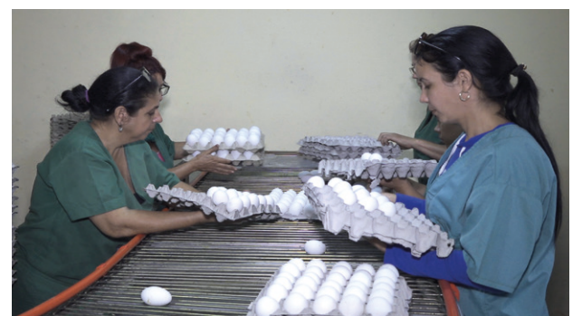
Con la adecuación de la dieta a los parámetros requeridos se logró incrementar la producción de huevos pese al envejecimiento de la masa.