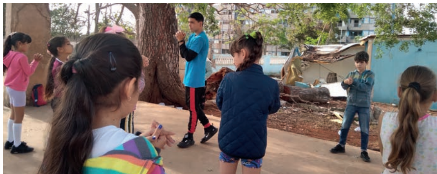
En una sola sesión se reorganizó la docencia en el segundo ciclo de enseñanza en la escuela Orlando Nodarse.