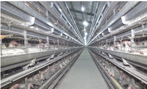
Sin importar las otras funciones que realicen todos trabajan como operarios en estas naves.