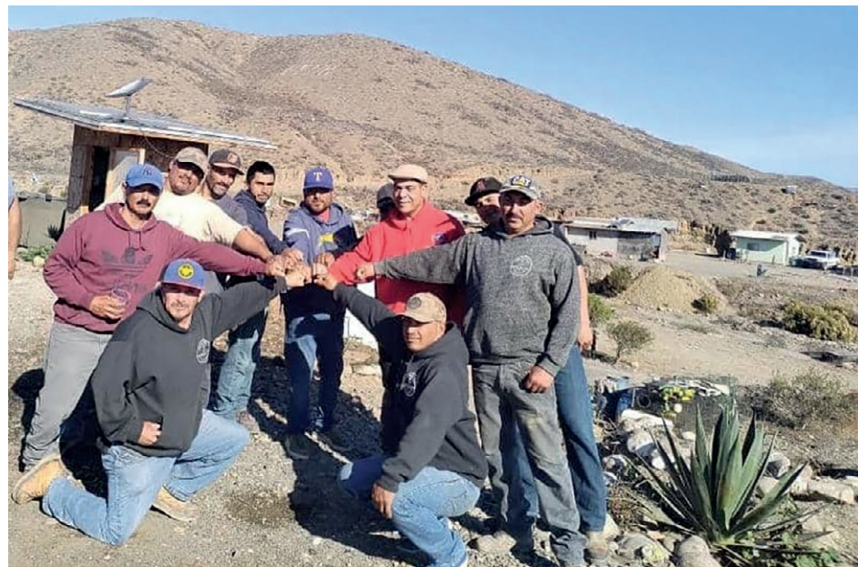
Integrantes de la delegación.

El reencuentro quedó pactado para La Habana en los meses de abril y mayo del 2025, ocasión en la que trabajadores mexicanos se sumarán, como en años anteriores, a la pasantía de superación sindical que auspician la CTC y la Federación Sindical Mundial (FSM), y a los festejos por el Primero de Mayo y el Encuentro Internacional de Solidaridad con Cuba. | Yimel Díaz Malmierca