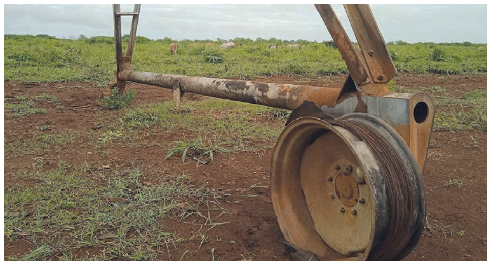
Muchos sistemas de riego de agua, como esta máquina Fregat en el avileño municipio de Ciro Redondo, devienen fósiles en no pocos lugares del país.

el 70 % de caña en aquellas condiciones, que se muelen desfasadas y aumentan el porcentaje de materias extrañas por tallos secos. También las cepas que no se cosechan pasan a la categoría de requeadas y amplían las pérdidas en las industrias.