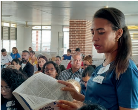
El colectivo de Asel demostró preparación al adentrarse en el análisis del Anteproyecto.