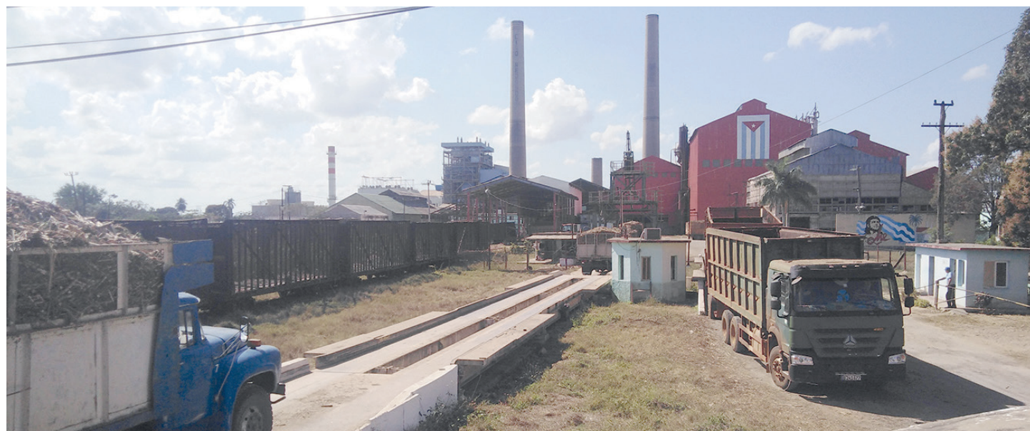
Materia prima de menos calidad deteriora la infraestructura fabril, limita la exportación y reduce casi a cero la fabricación de azúcar para el consumo de la población.

El declive de la industria azucarera cubana es una realidad. Durante la presentación a los parlamentarios del comportamiento del plan de la economía en el primer semestre del 2025, Joaquín Alonso Vázquez, titular del Ministerio de Economía y Planificación, afirmó que al cierre del primer semestre la zafra azucarera tenía niveles de producción de azúcar crudo infe-