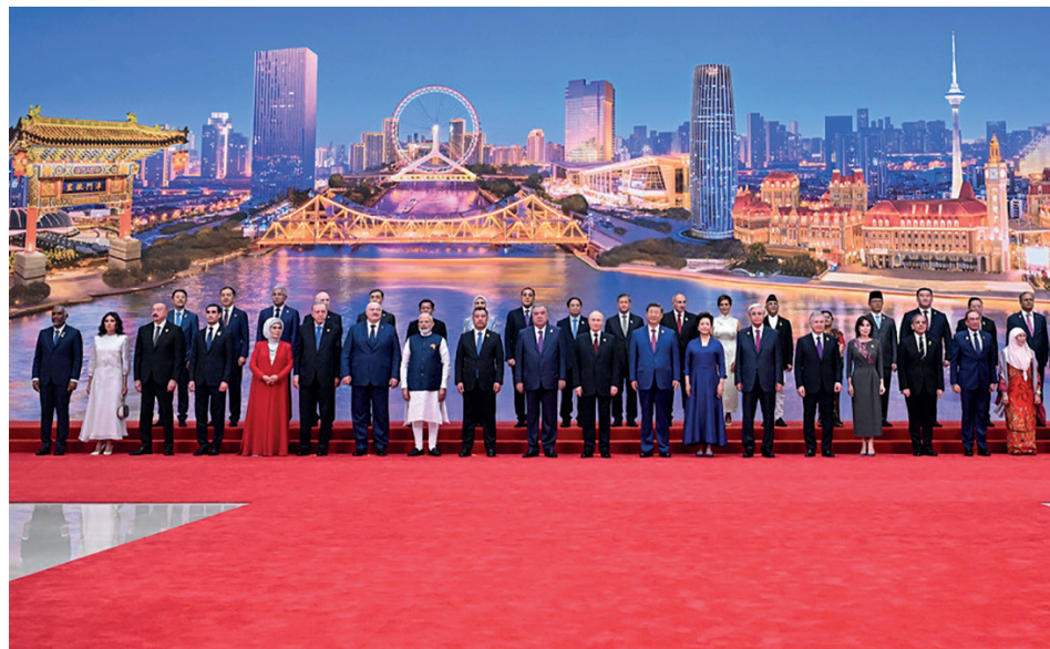
El evento reunió a representantes de más de 20 países y 10 organismos internacionales. | foto: Sergey Bobylev/ Sputnik

Para Cuba y América Latina, este movimiento hacia la multipolaridad ofrece oportunidades tendentes a diversificar alianzas y resistir presiones externas. La Cumbre de Tianjin no es solo un evento diplomático más; es un símbolo de que el mundo avanza hacia un futuro en el que la soberanía y el respeto mutuo son los pilares de las relaciones internacionales.