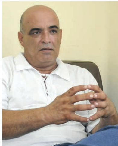
Doctor Reinaldo Ruffin Concepción, director del Instituto Nacional de Salud de los Trabajadores.

A continuación, corresponden encuestas y entrevistas a los miembros del colectivo, y por último, se