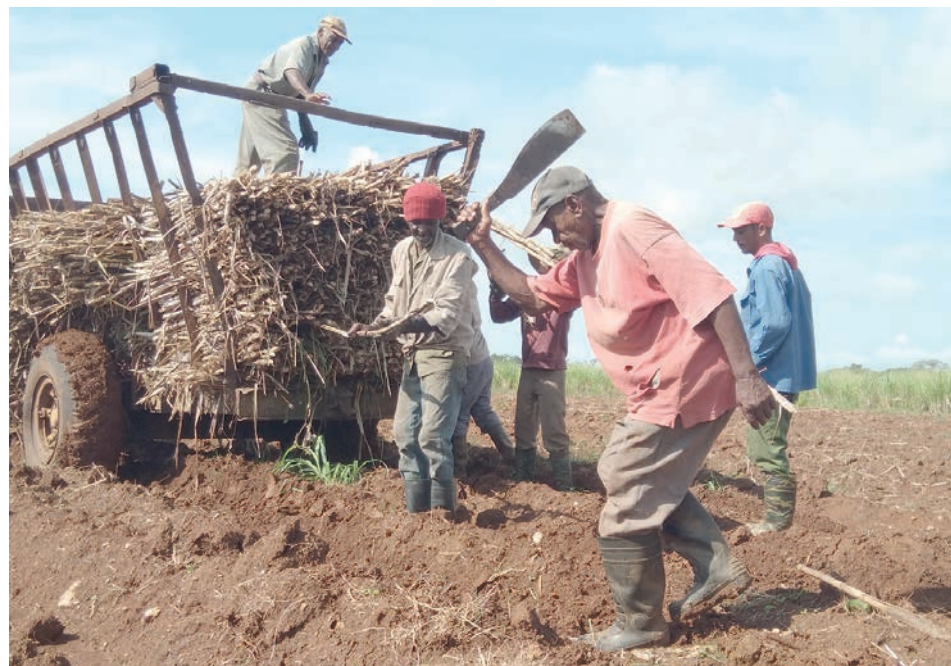
Aunque el impago está igualito, los sembradores en Artemisa no esperan por burocracias.