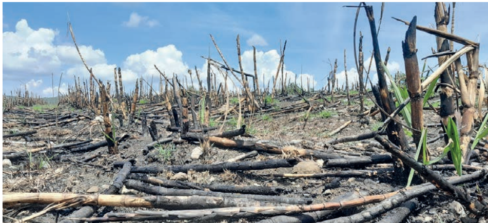
Más de 80 incendios afectaron a los productores y la economía la pasada zafra en Holguín.

Enfatizó que “hay unidades trabajando con el 40, 50, 60 y hasta