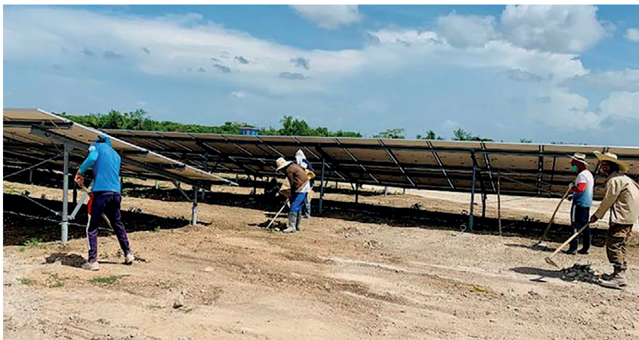
Los trabajadores de la ECM no. 2 concluyeron antes de lo previsto el parque fotovoltaico Providencia, ubicado en el municipio de Holguín.

Brown Ramírez detalló que en días recientes dejaron su impronta en el ya concluido parque fotovoltaico de Providencia, en Holguín, donde hicieron todo tipo de trabajos: movi-