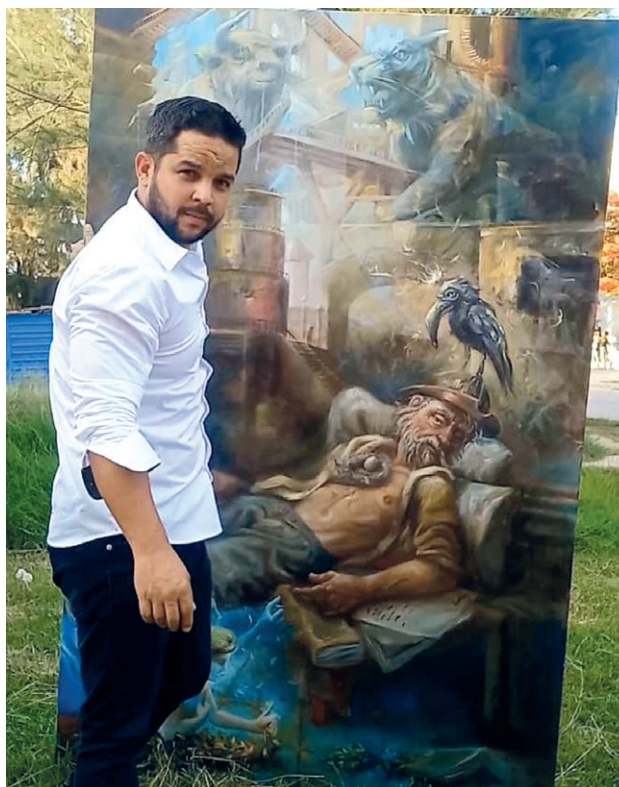
El artista junto a su pieza titulada Inmortal , óleo sobre lienzo, 200x120 cm, 2025.

Revelaciones aborda el concepto del tiempo, no como línea recta, sino cual una red compleja y mutable, que dialoga con diferentes textos de Borges, como su célebre cuento El Aleph . Se trata de tesis pictóricas que devienen laberintos espaciales e igualmente temporales y narrativos, que proponen una experiencia sensorial y cognitiva que va más allá de lo puramente visual.