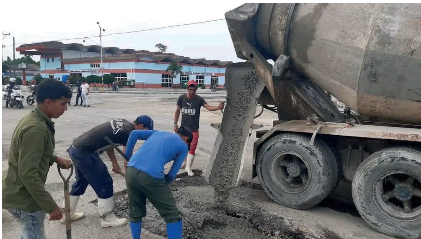
Los jóvenes trabajadores constituyen una fuerza vigorosa a pie de obra en Sancti Spíritus en 26.

La idea, que corre a cargo de Etecsa, se inscribe entre las principales inversiones en el territorio espirituano desde hace varios meses y tienen como fecha conclusiva los días previos a la celebración del acto central nacional por el 26 de Julio.