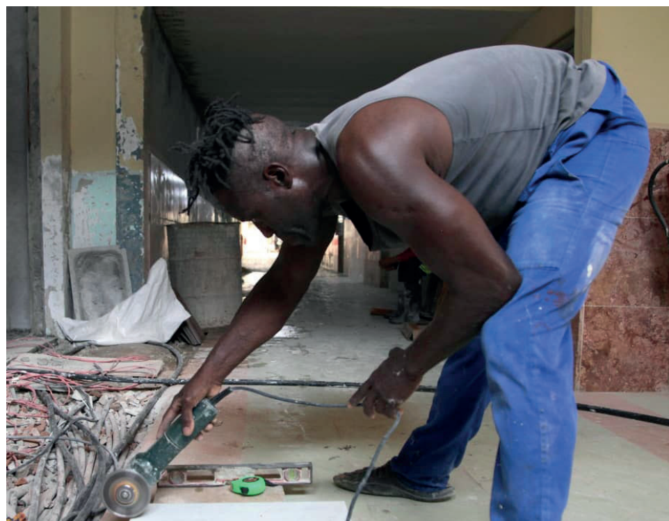
Fuerzas constructoras extienden la jornada laboral con vistas a concluir la remodelación de la unidad quirúrgica del Hospital Pediátrico, antes del 26 de Julio.

La ejecución de un proyecto para el reordenamiento de la circulación vial forma parte de las labores intensas que apuestan también por la vida. Es significativa la cifra de accidentes que pudiera minimizar la