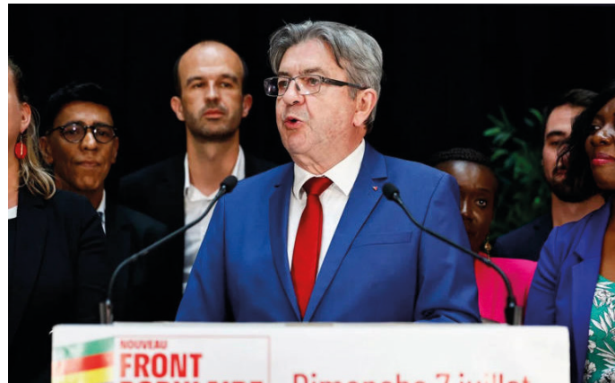
Jean-Luc Mélenchon, lidera Francia Insumisa y NFP.