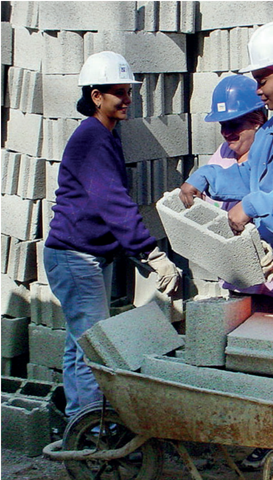
El levantamiento de materiales pesados por las máquinas, sin los equipos de protección adecuados, provoca daños a los Trabajadores

“Somos un centro de investigación que contribuye al desarrollo de la promoción, prevención, atención, asistencia y rehabilitación de la salud de los trabajadores, con un enfo-