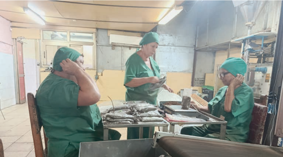
Trabajadoras de la planta donde han diversificado la producción.

La torrefactora también se prepara para incursionar en la venta de café tostado sin moler, en respuesta a nuevas demandas del mercado. “Estamos abiertos a seguir encadenándonos con otras entidades. Esta es una empresa socialista que ha demostrado que, con disciplina e innovación, se puede ser rentable”, concluyó el director.