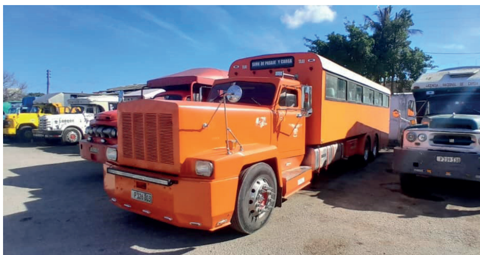
El arrendamiento de ómnibus estatales y los camiones son una opción de viaje a la cual no todos los ciudadanos pueden acceder.

Es claro que, aunque existen pasos de avance para sostener la transportación nacional gracias al esfuerzo de quienes no renuncian a mantener el servicio, la respuesta sigue siendo insuficiente ante una demanda creciente y diversa. El arrendamiento de ómnibus y de camiones ha permitido rescatar medios paralizados, también ha generado desorganización, acceso irregular a recursos y precios que escapan a los topes oficiales. En este escenario, el reto no es solo mantener la rueda girando sino ejercer un control más efectivo que garantice orden, equidad y estabilidad en un sistema que, de lo contrario, continuará reproduciendo sus propias brechas.