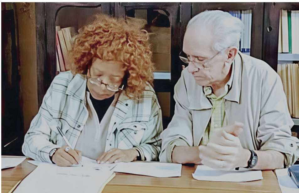
El jurado sesionó en el Centro Cultural Palacio de los Torcedores, lugar emblemático en la historia del movimiento sindical y en particular de los tabaqueros.