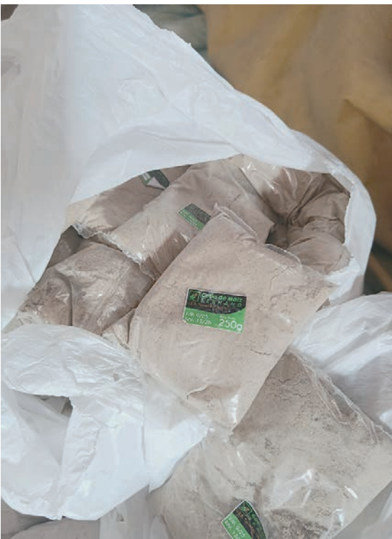
Gofio de maíz producido en la UEB Torrefactora Villa Clara.