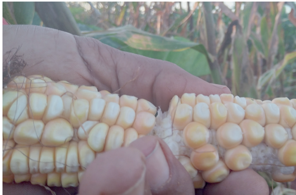
Campesinos artemiseños con cultura en el maíz tradicional, compran la semilla traída del oriente a unos 2 800 pesos por tonelada, igual al precio del transgénico.

país, aunque traten de priorizarlos los recursos no existen. Pero ese transgénico no se ha quedado en la parcela del CIGB. Desde hace un lustro el grano de oro germina en Sancti Spiritus.