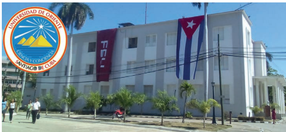
Universidad de excelencia, cuenta con 13 facultades, ocho CUM, tres Centros de Ciencia, Tecnología e Innovación, 3 mil 800 trabajadores y 13 mil 119 alumnos.

En el área de la comunicación, por ejemplo, se han materializado estrategias con las empresas Cárnica y de Bebidas y Refrescos de Granma, Agroindustrial de Granos Las