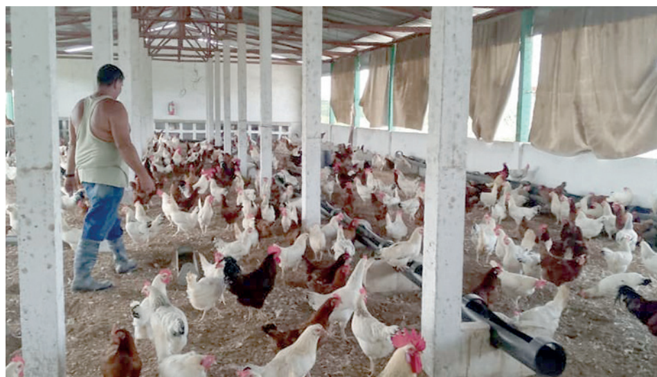
Una decena de cartones de huevos se recogen como promedio, diariamente, en la Empresa Cemento Siguaney.

Venegas Perdomo apuntó que la entidad se encuentra en franca recuperación de la rama porcina. La crianza de cerdos transitó por mo-