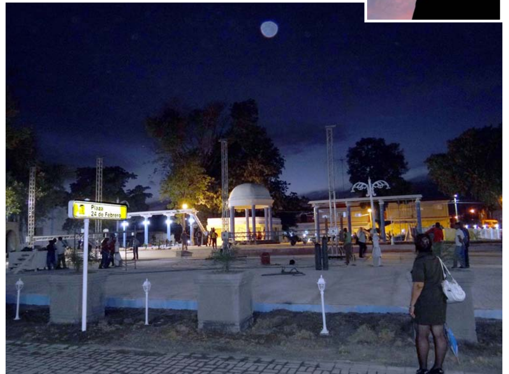
El parque 24 de Febrero, construido en el área que otrora ocupara el zoológico local, está destinado a convertirse en una de las áreas más céntricas de la ciudad.

Un ejemplo muy conocido es el centro gastronómico La Terraza 1870, ubicada en las céntricas calles de Carlos Manuel y La Avenida, cuya edificación se financió a partir de ingresos