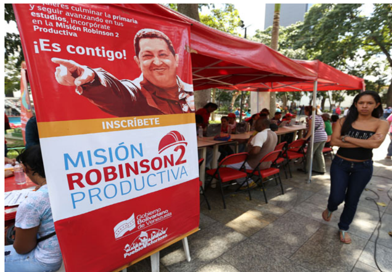
El Gobierno venezolano estima que la Misión Robinson 2 Productiva es una de las estrategias educativas que les permitirá derrotar la guerra económica y psicológica de la derecha contra la Revolución Bolivariana.

En algunos casos – agregó –, llegaron a agredir la me-