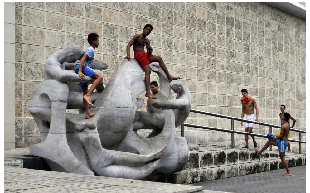
Paseaba frente al Museo Nacional de Bellas Artes, en La Habana, y cuando traté de disfrutar de la obra escultórica Formas, espacio y luz , de Rita Longa, mis ojos no podían creer lo que estaban viendo y comparto con ustedes: ¿Qué hacen la entidad y los padres ante tal desidia?