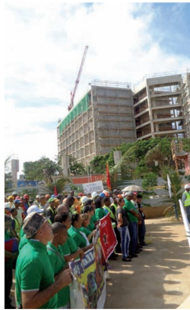
Constructores de Matanzas festejaron su día al pie de una de las obras que incrementará la planta hotelera del país.

Al término de las conmemoraciones por el Día del Constructor en predios matanceros, el Viceminis-