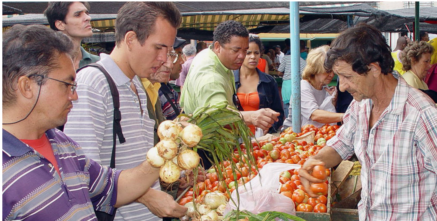
Acercar la oferta es el mecanismo fundamental que tiene el Estado para influir y regular indirectamente los precios.