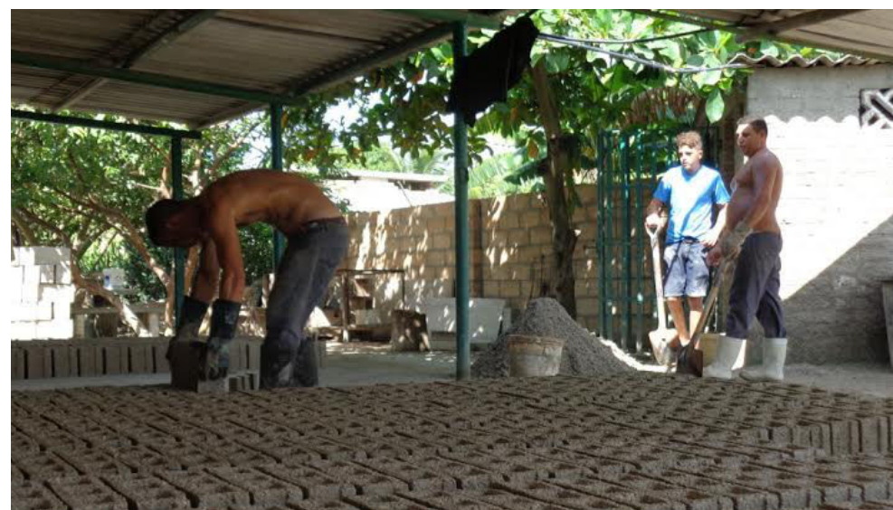
La construcción y elaboración de materiales son de las actividades que acogen mayor número de estudiantes de la enseñanza especial.