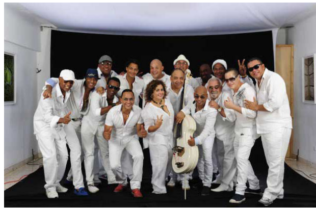
Los Van Van, entre las agrupaciones más destacadas de Clave cubana.

En representación de las disímiles manifestaciones que conforman esa fuerza laboral en todo el archipiélago, visitamos a Clave cubana (CC), entidad perteneciente a la Empresa Artex, en la capital, donde en la comunión del trabajo sindical y el administrativo se evidencian las célebres Palabras a los intelectuales , pronunciadas por Fidel Castro Ruz en junio de 1961 en la Biblioteca Nacional José Martí, cuando expresó que “la Revolución significa, precisamente, más cultura y más arte”.