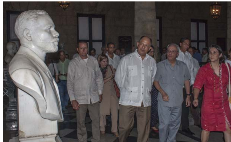
El presidente Luis Guillermo Solís y la comitiva que lo acompaña realizaron un recorrido por el Centro Histórico de La Habana Vieja.

Cuba y Costa Rica establecieron relaciones a nivel consular en 1907, las que fueron interrumpidas en 1961 y retomadas en 1977. Cuatro años más tarde hubo una nueva ruptura hasta que en el 2009 el entonces presidente Oscar Arias, decidió restablecer los vínculos diplomáticos, suceso que formalmente tuvo lugar el 26 de junio de ese año.