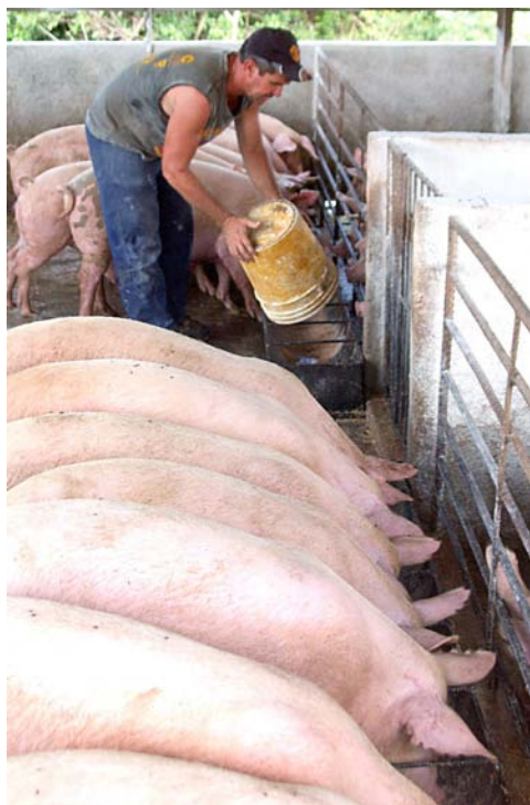
Con los convenios se alcanza una alta rentabilidad.

El programa porcino busca mayores producciones, cuidando el medio ambiente y a sus colectivos obreros. Un diapasón a seguir por el resto de sus similares del Ministerio de la Agricultura.