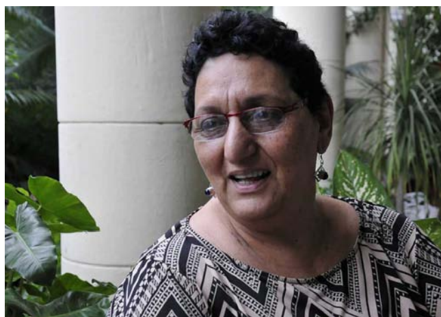
Lorena también ha sido diputada y vicepresidenta del Parlamento Centroamericano, Parlacen.

“El propósito de la visita ha sido encontrarme e intercambiar con el diputado Esteban Lazo Hernández, presidente de la Asamblea Nacional del Poder Popular; establecer una más estrecha relación con el grupo parlamentario de amistad Cuba-El Salvador (Lorena preside el similar radicado en el país centroamericano), así como reunirme con la dirección regional de la Federación Democrática Internacional de Mujeres, y también con representantes de la Unión de Escritores y Artistas de Cuba”.