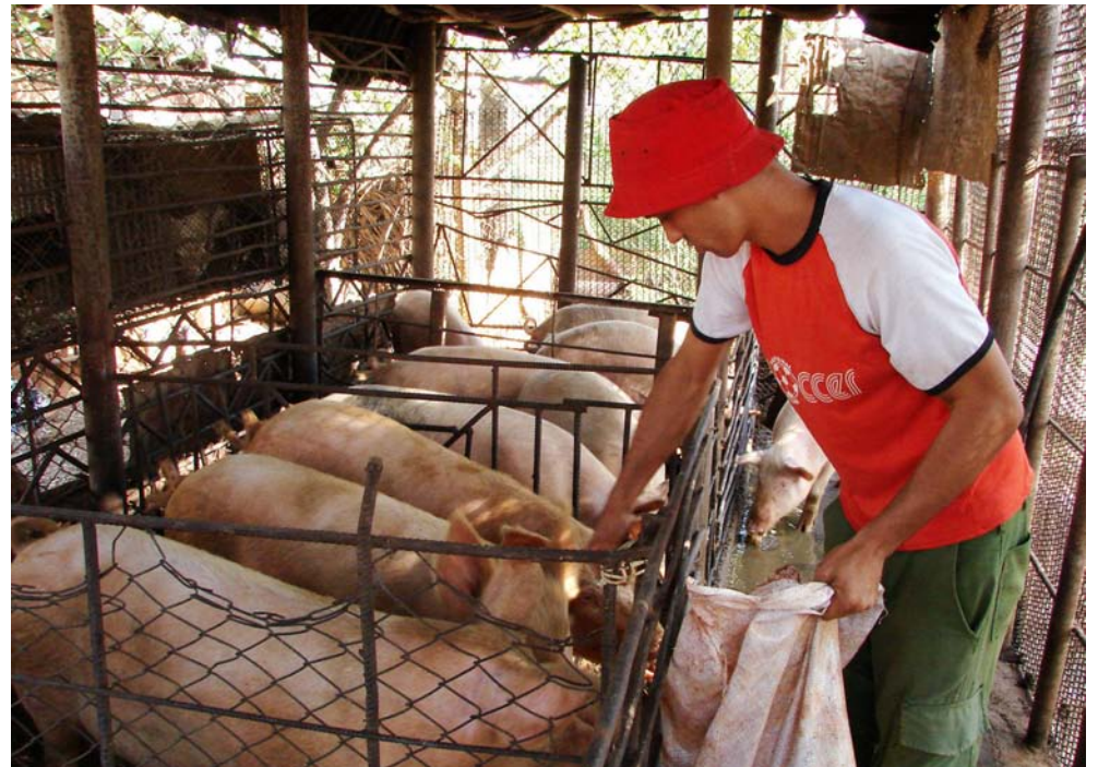
La producción crece en correspondencia con el cuidado del medio ambiente y de los trabajadores.

De la época de bonanza en el país, Carlos recuerda que el récord de producción de carne de cerdo databa de 1989, cuando se obtuvieron 102 mil 403 toneladas; “la aspiración es duplicar esa cifra, con un