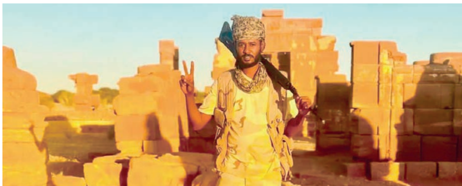
Un soldado de las Fuerzas de Apoyo Rápido de Sudán ante las ruinas de la ciudad de Naqa.

Aquellas tierras, ambicionadas y ocupadas a lo largo de la historia por varios imperios, entre ellos el romano, el otomano y el británico, asimilaron valores y costumbres diversas