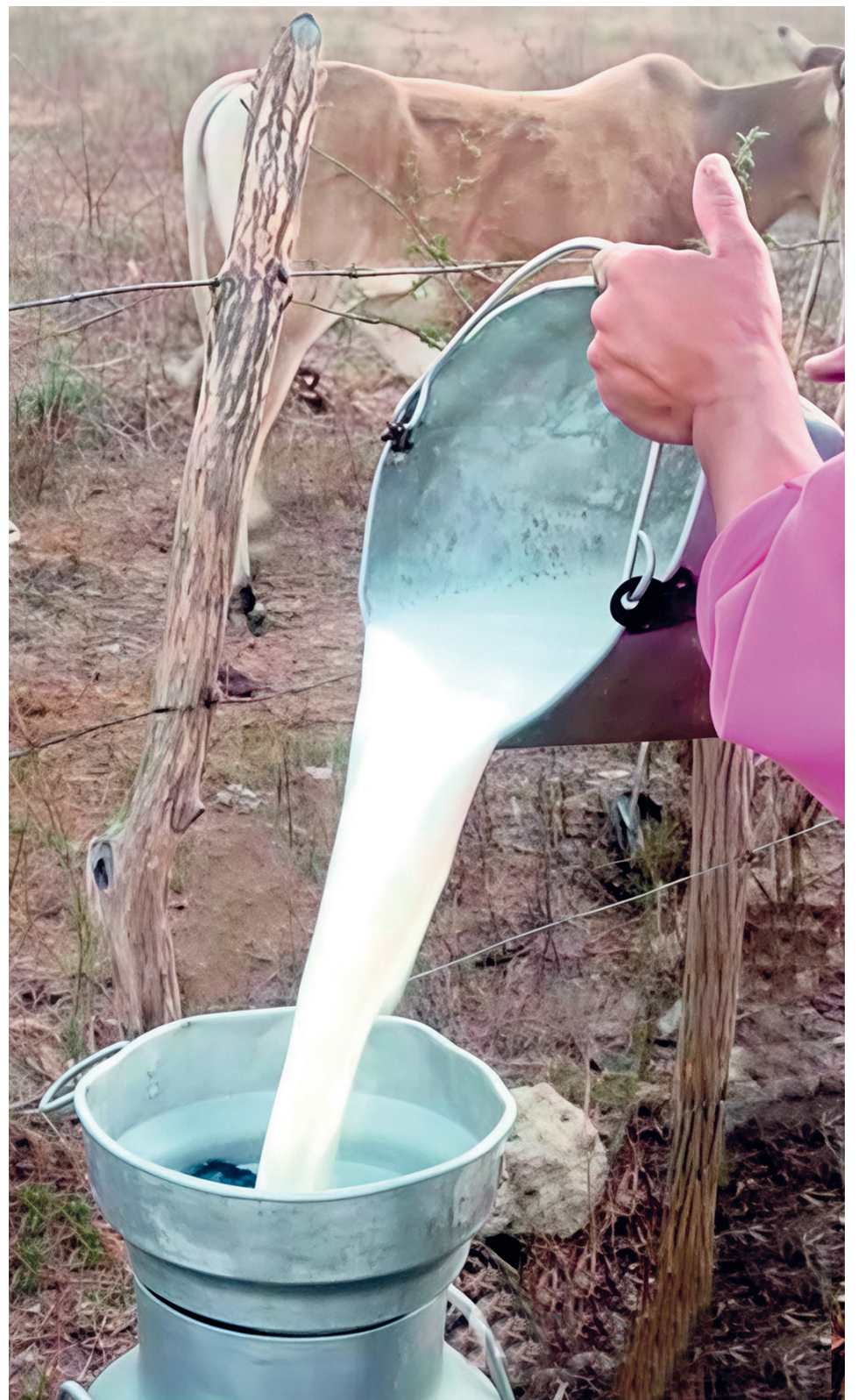
Una extensa cadena de deudas por cobrar y pagar afectó la economía de productores y empresas estatales relacionadas con la producción de leche en Sancti Spíritus.

“La cooperativa debe desempeñar el rol de reguladora entre la comercialización y el productor. La organización con mejores resultados económicos puede con sus fondos llegarle al campesino aunque con ella quede un impa-