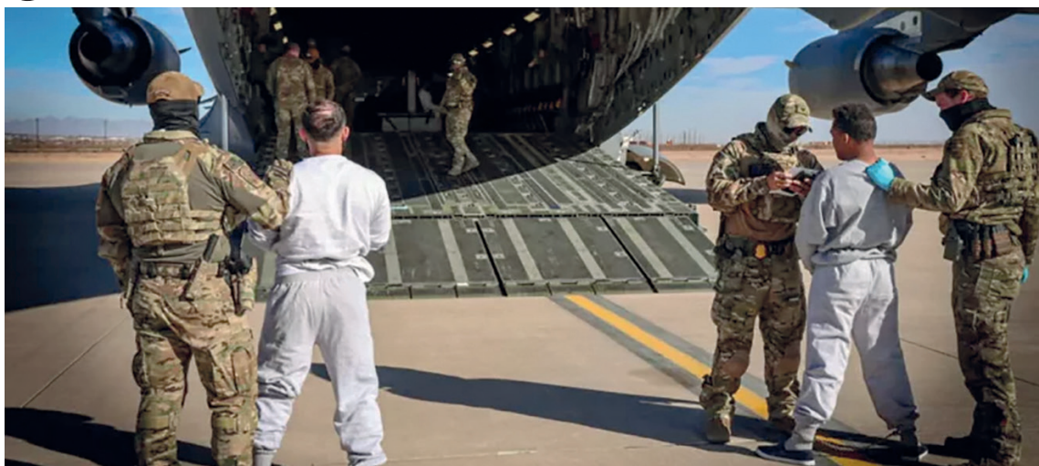
El primer avión militar con inmigrantes apesados en EE. UU. llegó a la Base Naval de Guantánamo el 4 de febrero del 2025.

En el último cuarto del siglo XX, la Base Naval de Guantánamo se utilizó como centro de reclusión