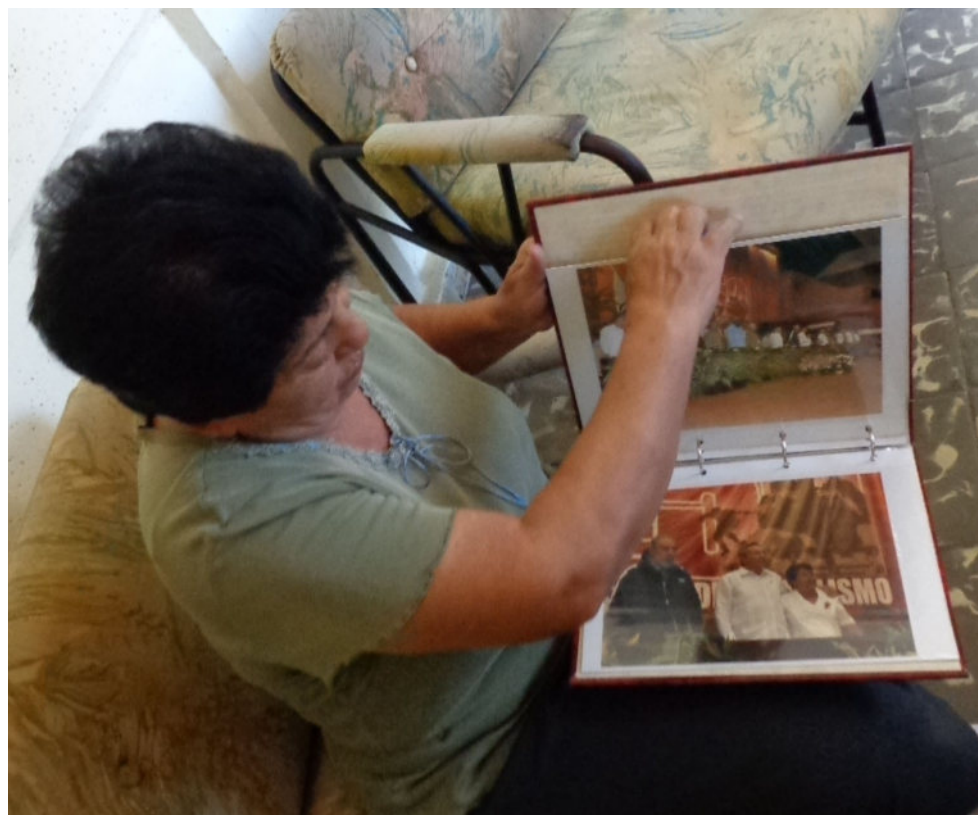
Guarda como tesoro las fotos del VI Congreso del Partido, en lo que ella considera como el álbum de sus quince.

bajar o la búsqueda de alternativas de servicios gastronómicos módicos para una población de 311 habitantes, con un porcentaje apreciable de personas entre 60 y 72 años; asombrosa edad para un municipio cuya expectativa de vida era muy inferior antes de 1959.