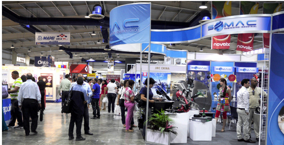
La Feria de la Construcción se ha mantenido entre las preferidas del empresariado extranjero.

No es festinada tal consideración. La construcción es uno de los sectores en los cuales se puede apreciar fácilmente el efecto de los procesos inversionistas.