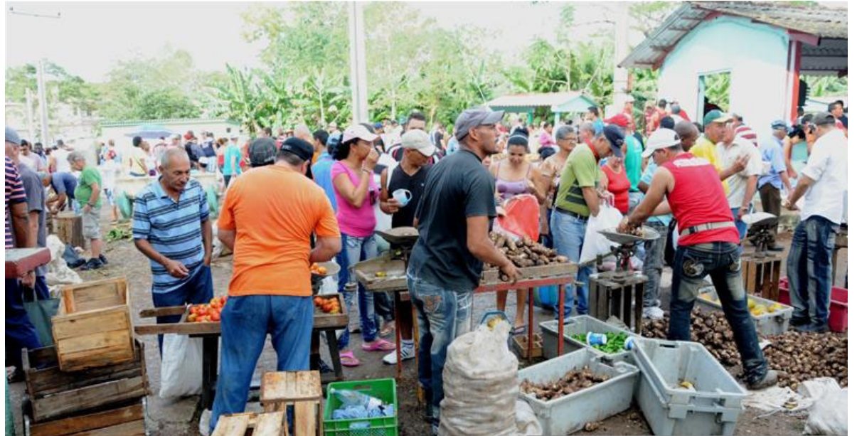
La creciente afluencia de vendedores a las ferias deviene motivo para la creación de nuevos quioscos en Sancti Spíritus.

“Aun así muchos continuaron incumpliendo”, acotó la jurídica, quien considera que uno de los problemas fundamentales se da con las reclamaciones a las empresas del propio sector, las cuales se tramitan obligatoriamente en el órgano de arbitraje, cuyas decisiones no tienen el carácter de ley que poseen las del