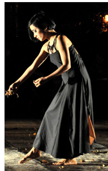
Con la obra Retornos: gente y ciudad comenzó el festival.

Eso sí, algunas de las sedes del Centro Histórico de la ciudad resultan francamente incómodas para el público, que termina agolpándose sobre el escenario. Habría que sacar más espectáculos a la calle y las plazas. | Yuris Nórido