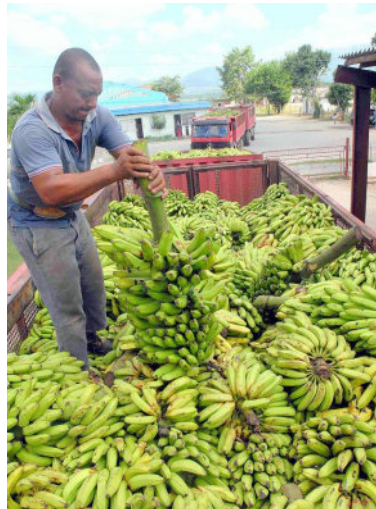
El chequeo de los arribos es básico para determinar la calidad de los productos.