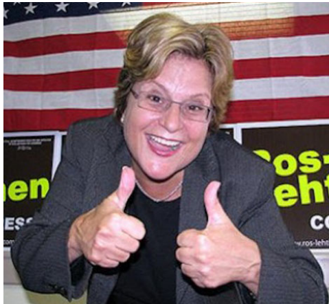
Ileana Ros-Lehtinen.

En relación al denominado “poder inteligente” que combina el convencimiento con la coerción económica y la fuerza militar, una estrategia manejada por la actual administración, la secretaria de Es-