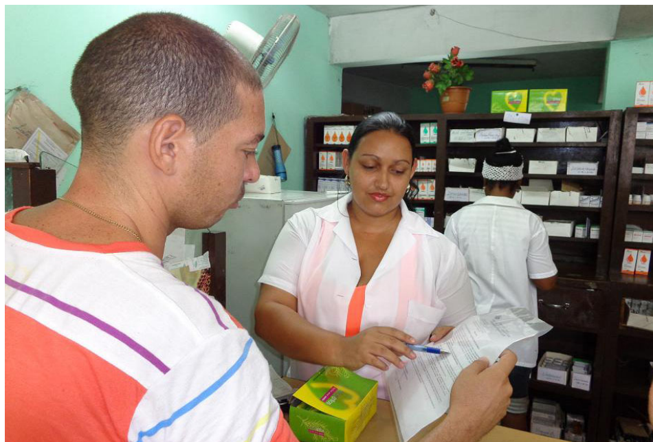
En las farmacias los clientes pueden consultar la Circular que refrenda la calidad de los condones que hoy se venden, aun cuando la fecha de vencimiento estampada dice 2012.

Suárez Ramírez precisó que la dispensación cuenta con “la autorización del fabricante, y la certificación que avala la calidad de los condones, emitida por el Centro para el Control Estatal de Medicamentos, Equipos y Dispositivos Médicos de Cuba (Cecmed), refrendada en una Circular con fecha 4 de abril del 2014”.