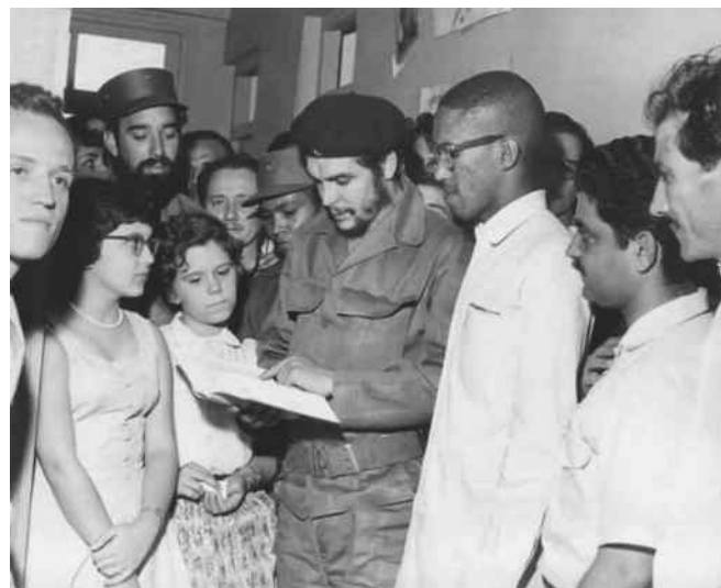
El Comandante Ernesto Guevara, un constante colaborador, durante una visita al colectivo de Verde Olivo.