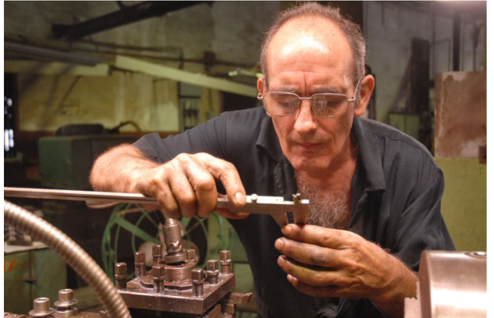
El efecto económico de las innovaciones y racionalizaciones durante el 2013 fue de 757,3 millones de pesos.

El destino que podrá tomar una solución en estas condiciones es realmente incierto y lo más doloroso es que se reducen costos, se alarga la vida útil de equipos y medios; se gana en eficiencia económica y al fi-