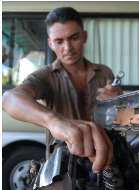
Los innovadores exigen una mejor aplicación de la Ley 38.

nal, el afectado siempre es el trabajador y en estos casos particulares, el país. Considero que la nueva Ley de Inversión Extranjera aprobada recientemente por la Asamblea Nacional contribuirá a darle respuesta.