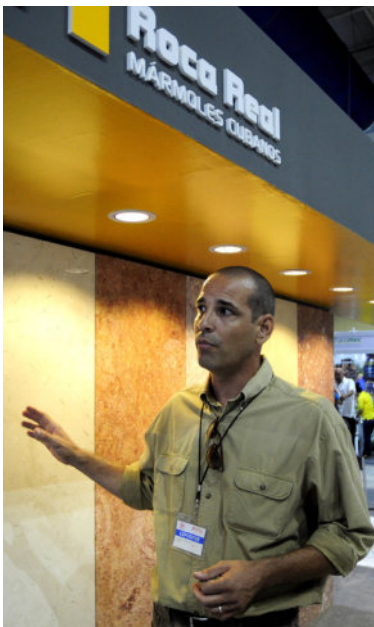
Dentro de la industria de materiales, el mármol es una de las ramas prestas para recibir inversión foránea.