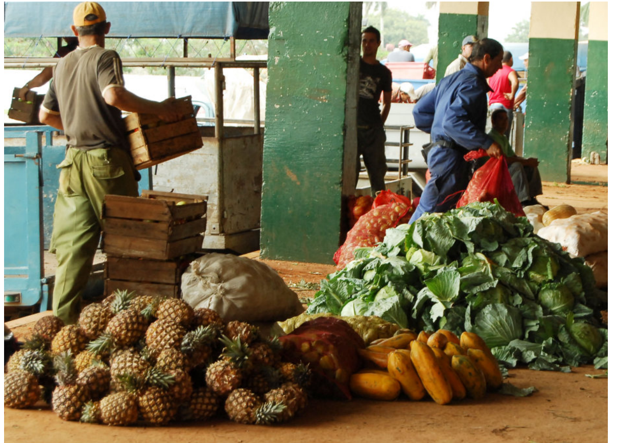
A El Trigal se traen mercancías de toda Cuba y se vende de forma mayorista y hasta minorista.