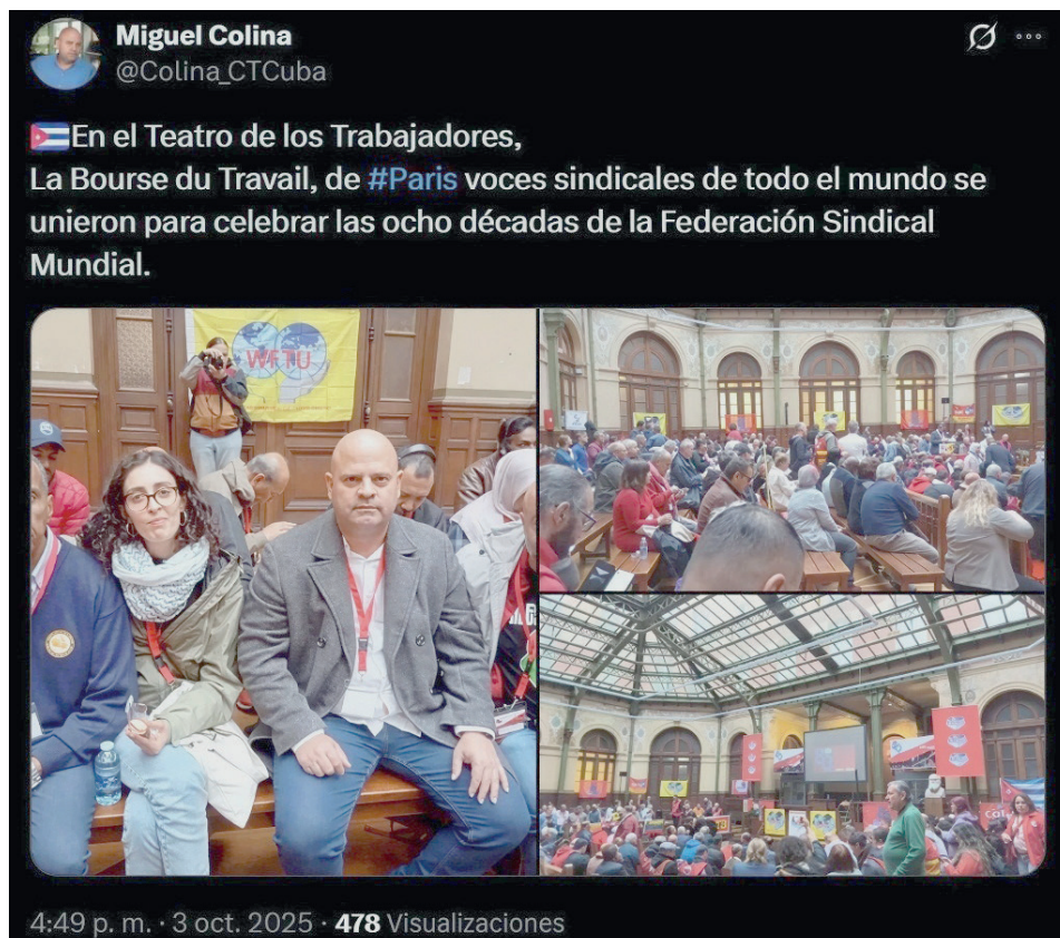
Del tuit publicado por Miguel Colina, presidente de la Comisión Organizadora del 22.º Congreso de la Central de Trabajadores de Cuba.

ción entre el trabajo y el capital; abraza la lucha de clases. Condena las guerras, lucha por la paz y el respeto a la autodeterminación de los pueblos, y no es neutral en cuestiones sociales. La FSM nunca se ha alineado con los monopolios corporativos transnacionales ni se ha puesto del lado de la burguesía. Por lo tanto, es anticapitalista y antimperialista. El legado de su historia y sus mártires seguirá siendo el punto de referencia para el movimiento sindical de clase”.