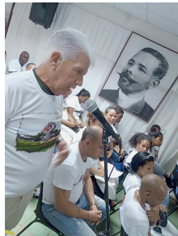
Solo un 19 % de los trabajadores no estatales en la provincia están afiliados al sindicato.

Artemisa, con 78 mil 824 afiliados, tiende al decrecimiento de un año a otro, pero tiene reservas en la incorporación de los trabajadores no estatales, que suman 5 mil 219 sindicalizados, el 19 % del total.