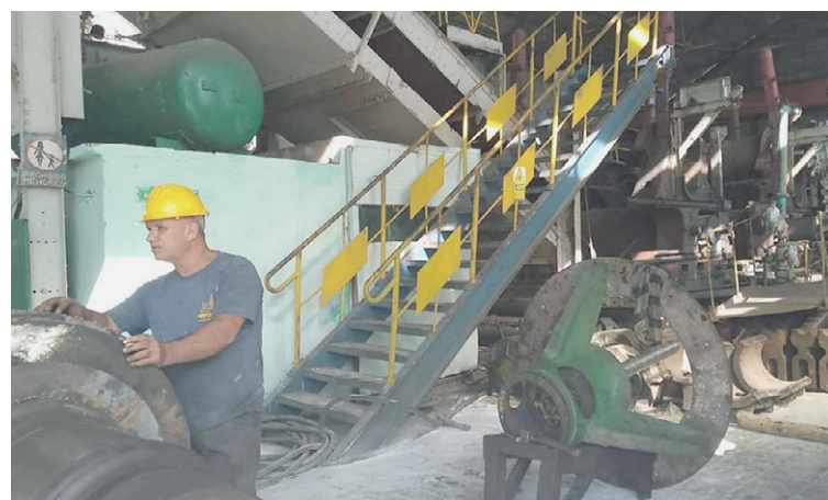
Alistar el ingenio es prioridad, aseguran los trabajadores de la EAA Melanio Hernández.

El descenso en la disponibilidad de la materia prima —equivalente al decrecimiento de la producción cañera—, la falta de lubricantes, las carencias de neumáticos, partes y piezas para la maquinaria y el transporte... constituyen algunos de los obstáculos que sorteó el colectivo en la