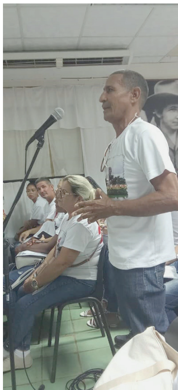
La lección es no cruzarse de brazos.

“En esta campaña 2025-2026 con las 938 hectáreas sembradas garantizamos unas 14 mil 83 toneladas de caña. De estas van a zafra para hacer azúcar casi 11 mil, las restantes son semillas dirigidas a la venta, y dejamos plantaciones de ciclo largo a cortar en la contienda venidera, lo cual mejora el rendimiento, así pagaremos el crédito solicitado al Banco para sostenernos en este tiempo que el central Harlem no molió, y solo producirá meladura, en noviembre”, acotó.