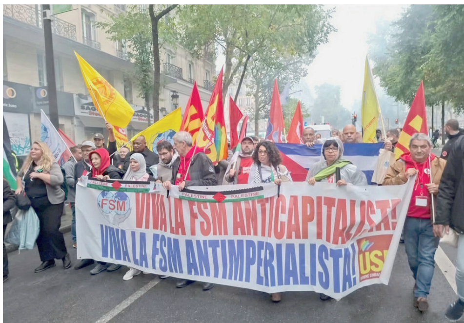
Aniversario FSM en París.

Y añadió: “La FSM se guía por principios de clase; lucha por las reivindicaciones y el bienestar de la clase trabajadora, por una sociedad sin explotados ni explotadores; se enfrenta a la contradic-