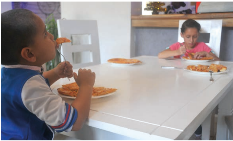
Cumplir el plan de CMM en Isla de la Juventud se traducirá en mayor satisfacción del pueblo.