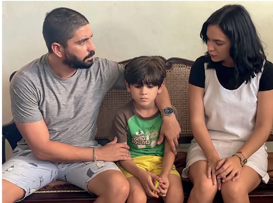
El conflicto de los padres litigantes del niño fue uno de los pilares de la trama de la telenovela.

Otro punto crítico fue la ausencia de escenas necesarias para la continuidad lógica del relato. Muchas veces se crearon expectativas