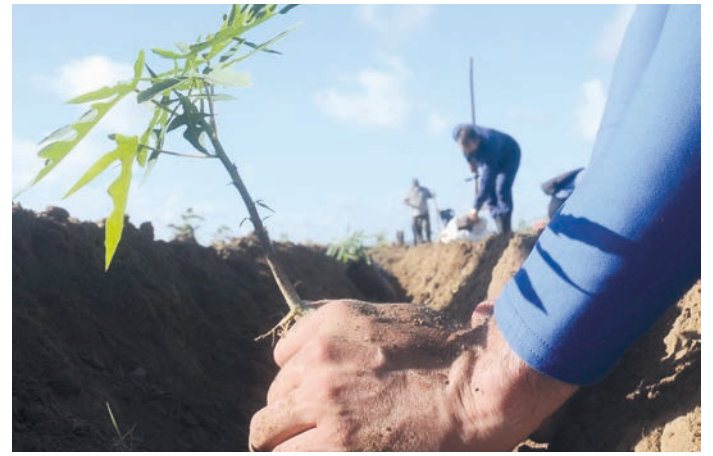
El país enfrenta limitaciones para garantizar la seguridad alimentaria de la población y precisa de una sostenible producción nacional de alimentos.