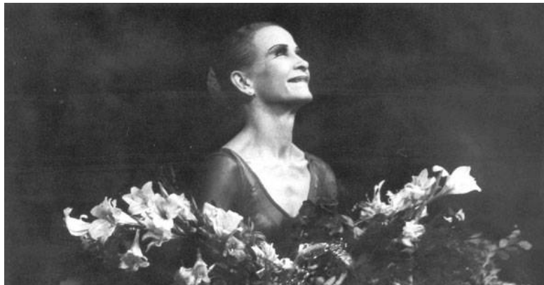
Recibiendo el homenaje de su público.

Maestra de muchas promociones de artistas de la danza, sabe que lejos de los reflectores también se puede hacer una obra grande. Los aplausos después de las funciones son también para ella.