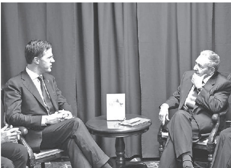
El Presidente cubano con el Primer Ministro del Reino de los Países Bajos, Mark Rutte.