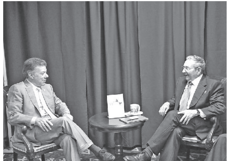
Raúl se reunió con el mandatario colombiano Juan Manuel Santos.