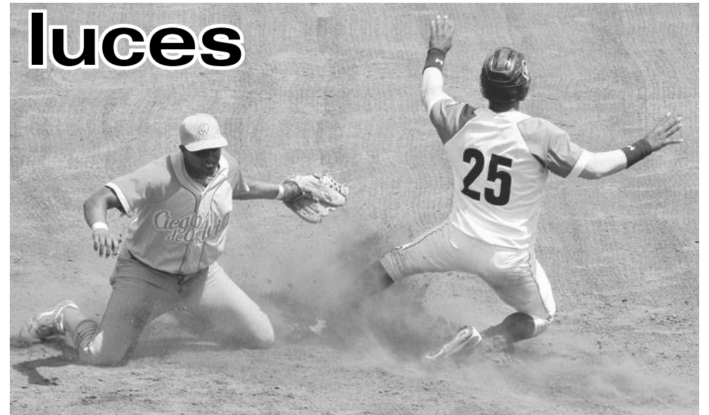
Los dos equipos se entregaron en el terreno y dieron un magnífico espectáculo.

Detrás de las luces de un Ciego de Ávila campeón, nuestro béisbol necesita revisar a fondo conceptos