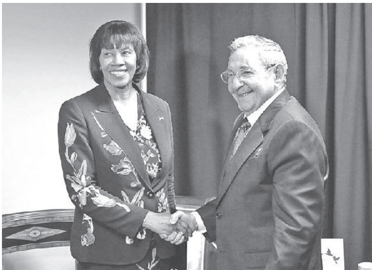
Raúl también intercambió con la Primera Ministra de Jamaica, Portia Simpson.