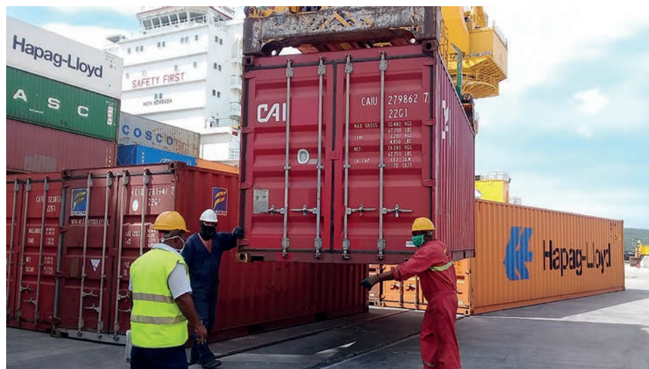
Los portuarios del Guillermon Moncada han mantenido resultados integrales en los últimos cinco años.

Sobre la base de los aportes económicos en el año 2022, y lo que va del 2023, a los portuarios de Santiago de Cuba no se les ha hecho esquivar la distribución de utilidades sistemáticamente, algo