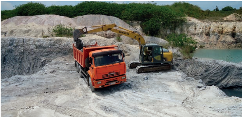
Más de 2 mil 500 toneladas de caolín se producen al año en la fábrica Julius Fucik.

En el Municipio Especial Isla de la Juventud este producto es líder desde el año 1964, cuando el 10 de mayo fue inaugurada por el Comandante Ernesto Che Guevara la fábrica Julius Fucik, única de su tipo en el país