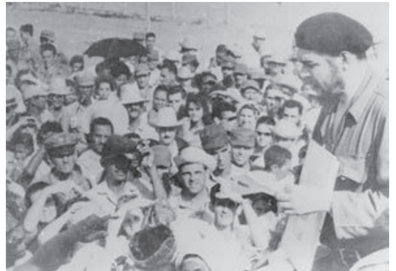
Che en el acto inaugural de la fábrica.

En el Municipio Especial Isla de la Juventud este producto es líder desde el año 1964, cuando el 10 de mayo fue inaugurada por el Comandante Ernesto Che Guevara la fábrica Julius Fucik, única de su tipo en el país