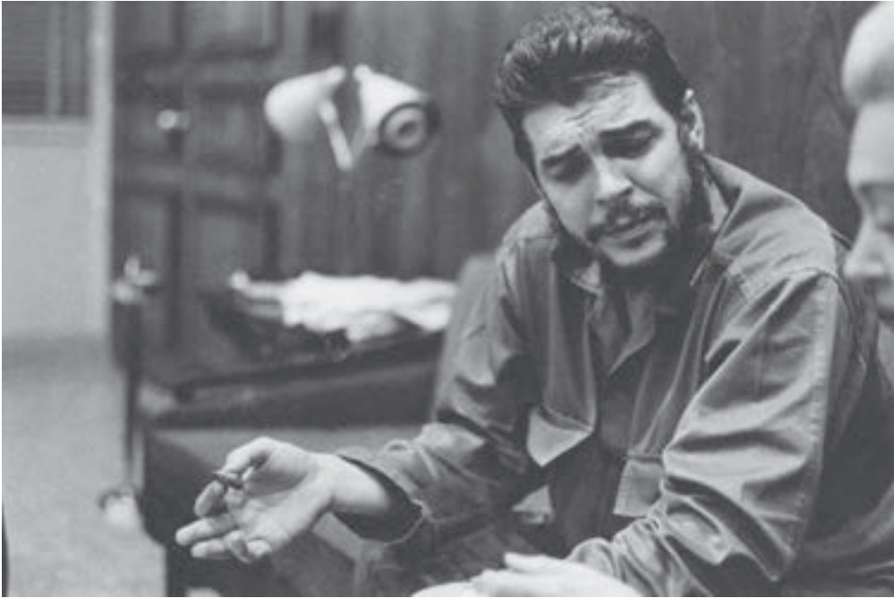
El Che durante la entrevista con Lisa Howard.

En el año 1964 el Comandante Ernesto Guevara concedió dos entrevistas a la prensa extranjera en las que abordó el tema del bloqueo. Su aplicación era reciente, aunque desde el mismo triunfo revolucionario Estados Unidos había emprendido medidas contra Cuba en un intento por hacer fracasar la Revolución. La imposición del bloqueo fue un paso más en esa escalada.