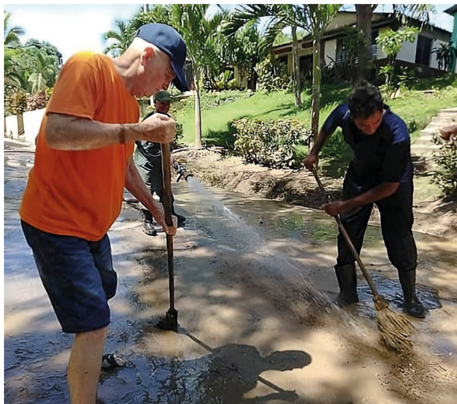
Media Luna fue uno de los municipios más afectados en Granma.