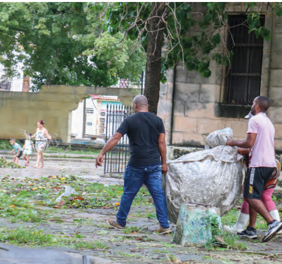
En un esfuerzo conjunto todos los vecinos cooperan para restablecer la normalidad.