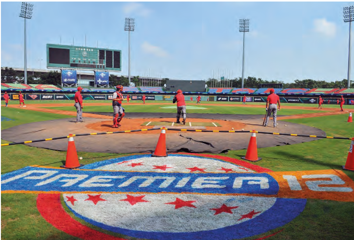
Taipéi de China volverá a ser sede de una ronda clasificatoria.