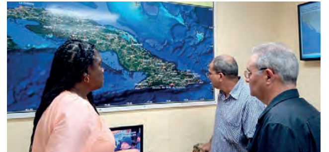
Las máximas autoridades santiagueras, junto a especialistas del Centro Nacional de Investigaciones Sismológicas, se mantienen atentos a la ocurrencia de réplicas y posibles daños.