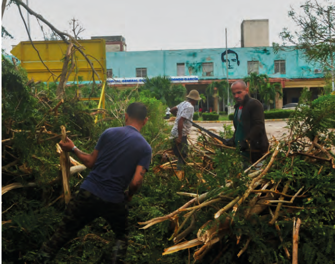
Restaurar rápidamente los alrededores del Hospital Provincial de Artemisa resultó una prioridad.