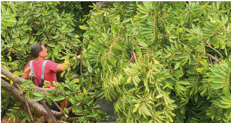
Varios árboles golpearon techos de cubierta ligera, que ocasionaron fracturas y entrada de agua a viviendas.