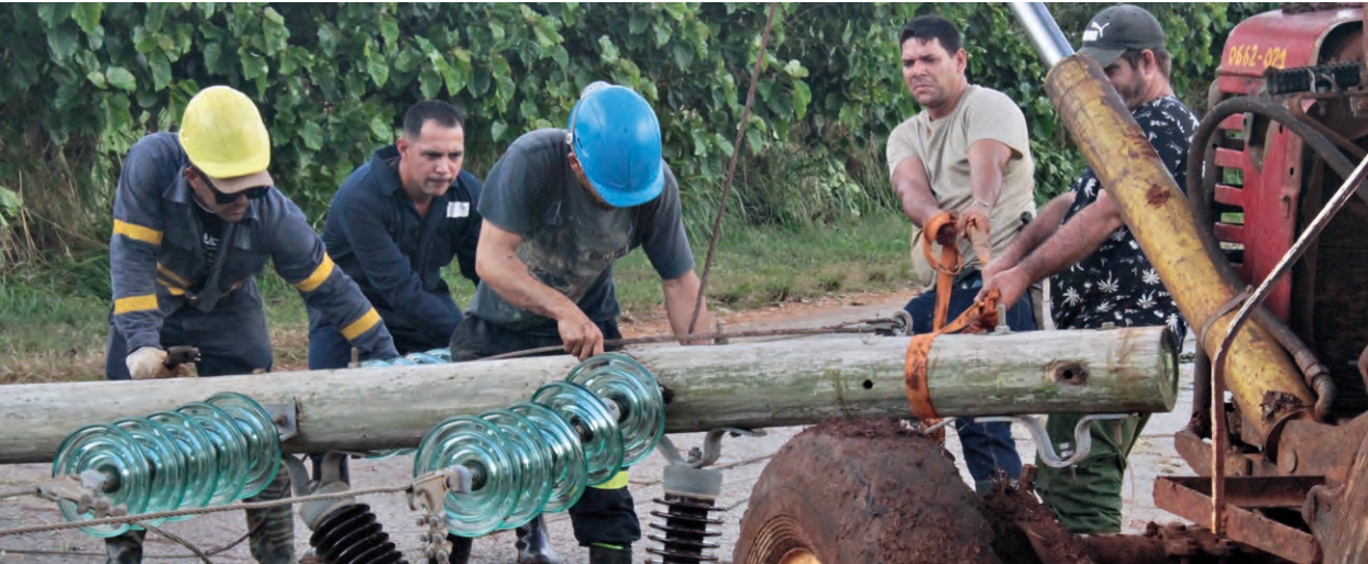
Brigadas de linieros de varias partes del país apoyan la recuperación en los territorios afectados por Rafael.

En la mañana del día 7, cuando ya Rafael estaba lejos de las costas cubanas, y el sol hizo posible ver los destrozos, la gente puso manos a la obra para la recuperación. Las brigadas de linieros, de motoserreros, y las labores de recogida de desechos sólidos, el abasto de agua, y la incorporación del pueblo en general, crecen en la geografía occidental afectada por los fuertes vientos de un huracán que apuró el paso y perdió intensidad en cuanto sintió cubanía. Postes, cables, árboles, techos y paredes fueron tumbados al suelo. No así la capacidad de echar pa'lante, de juntar fuerzas para levantarnos. Estos son días difíciles, pero convencidos estamos, todos, de que ni Rafael ni ningún otro podrá derrumbarnos