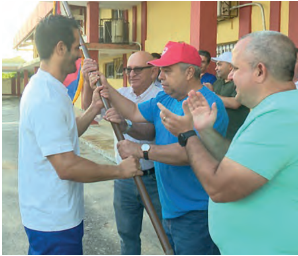
El secretario general de la CTC abanderó al contingente.