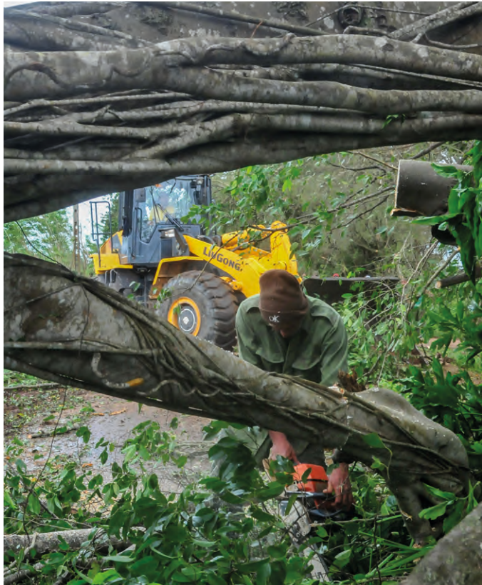
Artemisa fue la provincia más golpeada. Muchos árboles obstruyen la Carretera Central.