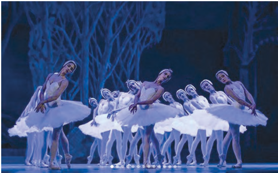
El Ballet Nacional de Cuba (BNC), dirigido por la primera bailarina Viengsay Valdés, fue digna anfitriona del Festival. En la imagen, el cuerpo de baile femenino en el segundo acto de El lago de los cisnes .