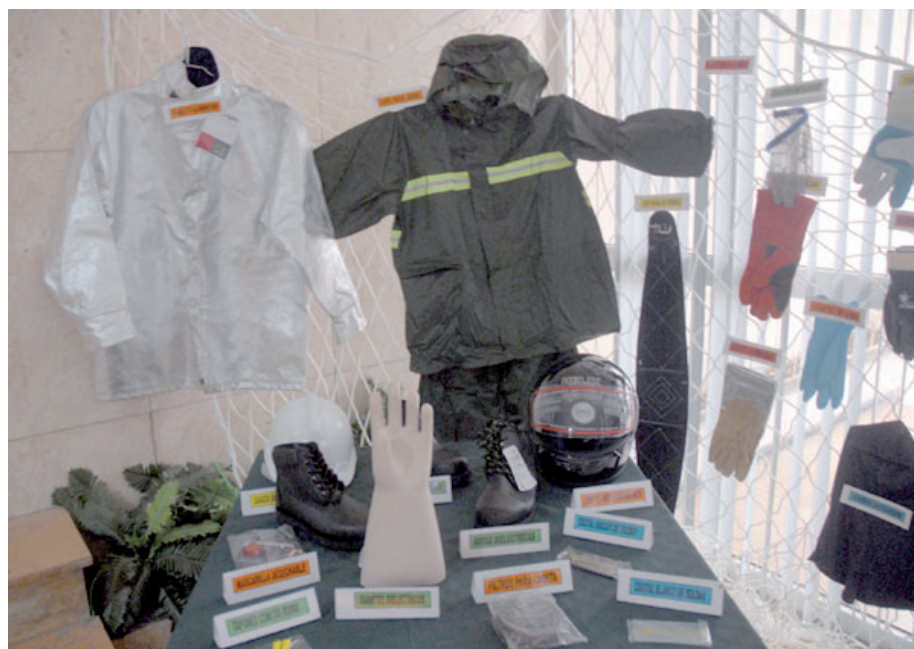
Es preciso alcanzar un comportamiento responsable con el uso de los medios de protección individual.

La temática fue valorada durante la celebración por el Día Mundial de la Seguridad y Salud del Trabajo, ocasión en que se informó que factores organizativos y de conducta provocan un elevado número de incidentes y accidentes laborales, a la vez que aún en los casos en que se dispone de un procedimiento seguro de trabajo, la falta de cultura de seguridad pue-