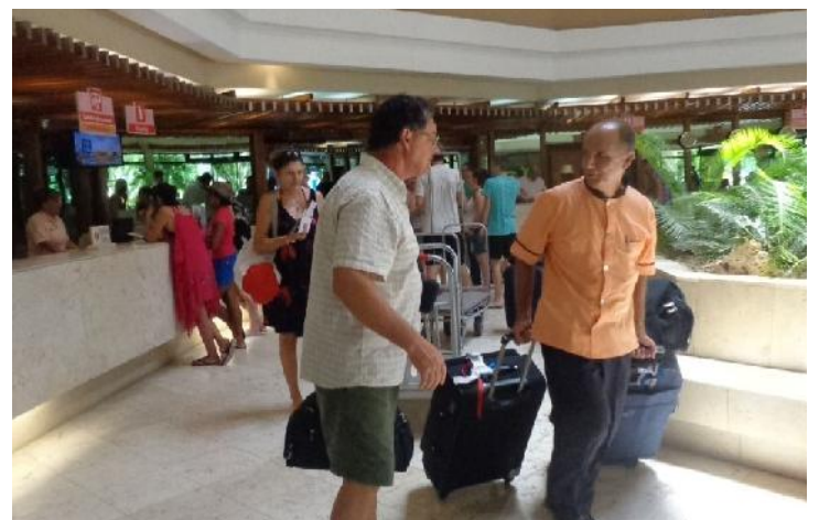
Más de mil turistas diarios como promedio hospeda esta instalación.