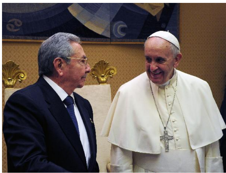
Raúl y el Papa Francisco durante el encuentro que sostuvieron.

Luego, ambos dignatarios pasaron a un salón contiguo y saludaron a las respectivas delegaciones, momento en el que Raúl obsequió al Santo Padre una pintura del artista de la plástica Alexis Leyva Machado (Kcho), titulada Milagro , obra motivada en el fenómeno de la emigración