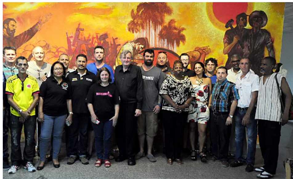
Parte de la delegación asistente al II Encuentro sindical de la construcción y el primero del Frente de Coordinación del movimiento sindical internacional del sector, junto a los miembros del secretariado del Sindicato de la Construcción.

Durante la primera sesión, los participantes extranjeros —más de 96 dirigentes sindicales de 26 organizaciones y 18 países— presenciaron ejercicios demostrativos para prevenir accidentes de trabajo en la em-