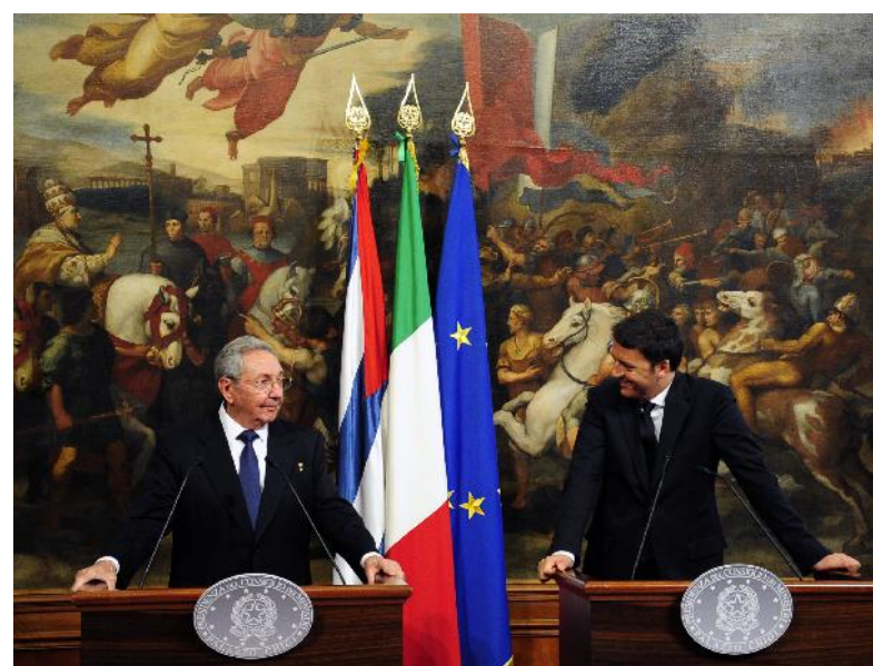
El Presidente cubano y el Primer Ministro italiano en la conferencia de prensa.

Finalmente Matteo Renzi consideró que "para nosotros es un día especialmente importante, pero lo mejor aún está por suceder".