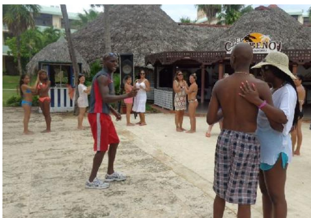
La elevada profesionalidad de los animadores prestigia la entidad.

“Sabemos que aún queda para llegar a la excelencia total, pero de algo estamos seguros. Sol Palmeras seguirá haciendo el turismo que el país merece, que el país necesita”.