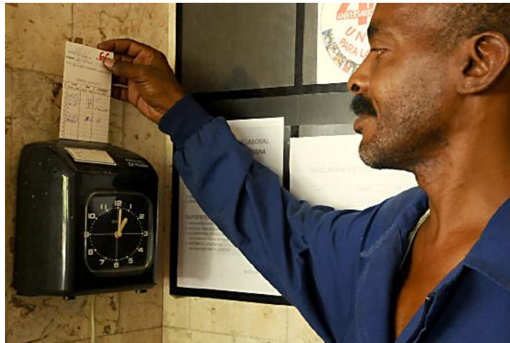
Los trabajadores no están obligados a realizar labores extraordinarias, salvo en los casos y periodos definidos en el Código de Trabajo.

El Código de Trabajo sigue siendo un tema de interés en las cartas de nuestros lectores, aunque han transcurrido varios meses a partir de su análisis y puesta en vigor.