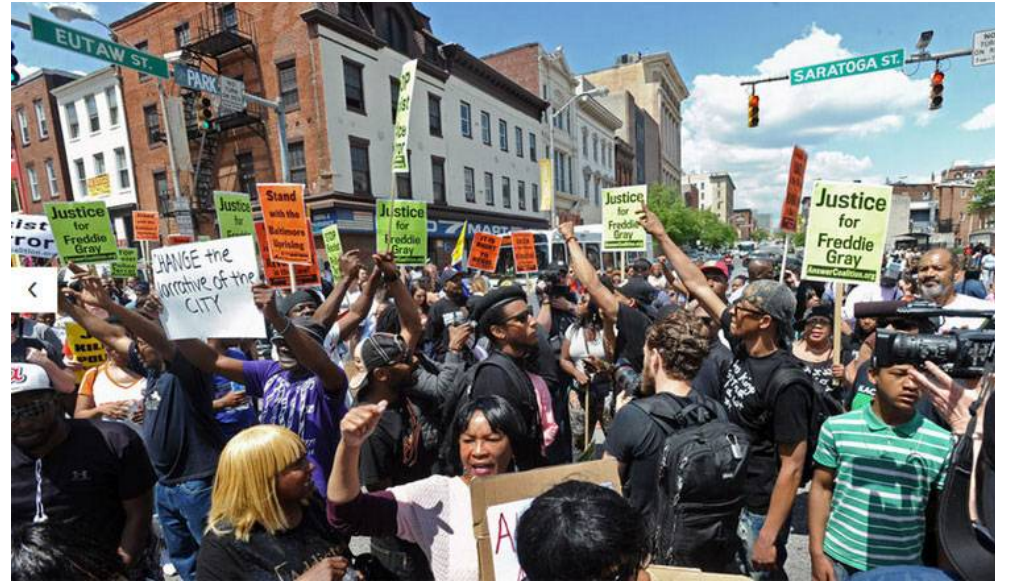
Miles de manifestantes marcharon en Baltimore y otras ciudades estadounidenses como Nueva York, Washington y Boston, en protesta por la violencia policial, que esta vez cobró la vida del afroamericano Freddie Gray, mientras se encontraba bajo custodia policial.