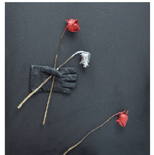
Ruptura de amor . Técnica mixta sobre lienzo.

pictórica que trasciende los límites de la representación. Imaginario, a veces lúdico, con el cual Isis propone incentivar la transformación del mundo.