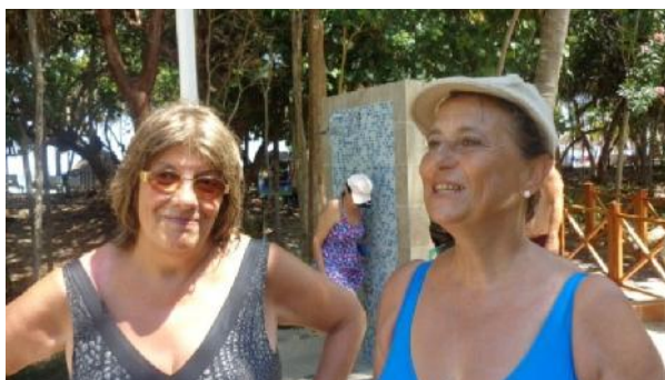
Turistas argentinas lo reconocen como el mejor hotel de la cadena Sol Meliá de los que han visitado en Cuba.