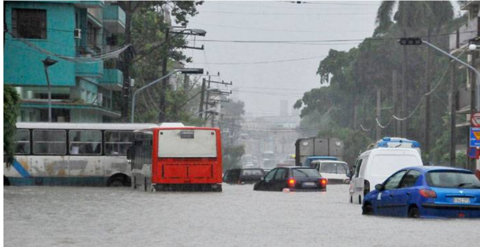
Una obra compleja y costosa está prevista a muy corto plazo para la zona del Pontón, y sus alrededores, donde hubo notables inundaciones por las lluvias de abril último.

Sus planos fueron reevaluados, como otros, con vistas a emplear nuevas tecnologías, pues por el costo, la magnitud y capacidad constructiva que requieren, las labores de drena-