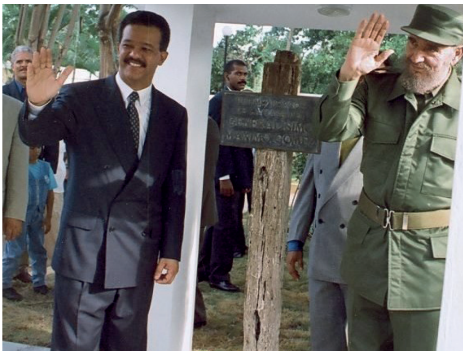
Junto al Presidente de República Dominicana, Leonel Fernández, en la visita a la casa de Máximo Gómez en Baní, República Dominicana, el 23 de agosto de 1998.

Durante el agradecimiento por la imposición de la Orden del Mérito de Duarte, Sánchez y Mella, en el grado Gran Cruz Placa de Oro, evocó a “las tres Antillas que han de salvarse juntas, o juntas han de perecer, las tres vigías de la América hospitalaria y durable, las tres hermanas que de siglos atrás se vienen cambiando los hijos y enviándose los libertadores, las tres islas abrazadas de Cuba, Puerto Rico y Santo Domingo”, como hace más de cien años dijo Martí. Por eso al Apóstol se le quiere como el dominicano que él reconoció ser, o como cubano, sin egoísmo.