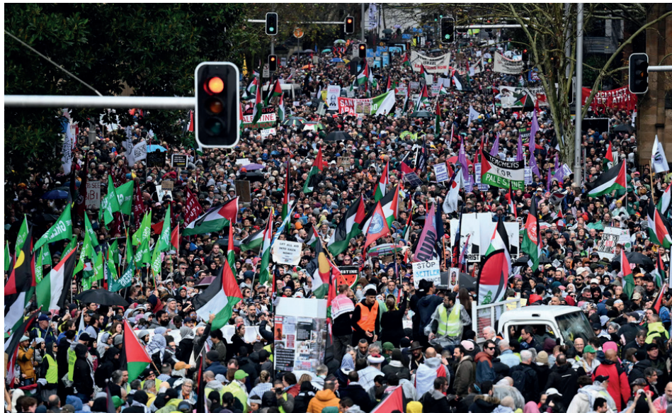
La marcha sobre el Sydney Harbour Bridge partió de la estación de Wynyardy en una inmensa columna humana de casi 3 kilómetros que repletó los 30 metros de ancho del vial.

Organizaciones de derechos humanos israelíes como B'Tselem acusaron al Gobierno de Benjamín Netanyahu de instaurar “un régimen