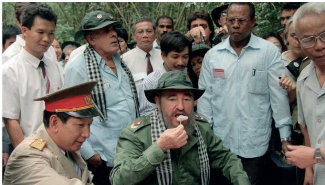
Durante su visita a la red de túneles subterráneos usados por los vietnamitas en su lucha por la independencia y la reunificación, el Comandante en Jefe Fidel Castro usó un sombrero del Viet Cong y degustó algunos de los alimentos básicos que les permitieron sobrevivir a la guerra.

Al hablar en la recepción, Fidel sostuvo que se cumplieron los sueños de Ho Chi Minh cuando dijo que nada es más preciado que la independencia y la libertad. “El porvenir, decimos hoy con más convicción que nunca, es del socialismo, otros se derrumbaron —añadió— pero nosotros seguiremos resistiendo, y ya comenzamos a avanzar”.