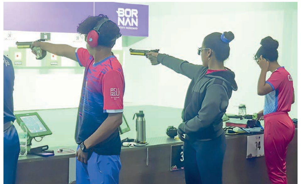
Hasta el 23 de agosto se celebrará este evento multideportivo.