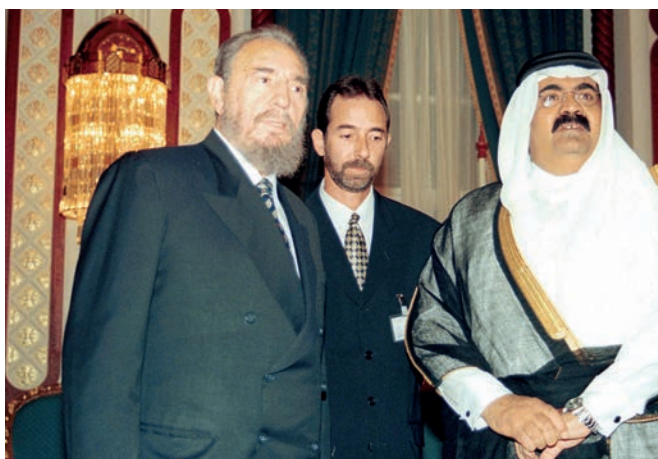
El Presidente de los Consejos de Estado y de Ministros de Cuba, Comandante en Jefe Fidel Castro Ruz, y su Alteza Jeque Hamad bin Khalifa, Emir del Estado de Qatar, durante la visita efectuada por el líder cubano a la nación árabe.

O también puertorriqueño... o el cubano que soy.