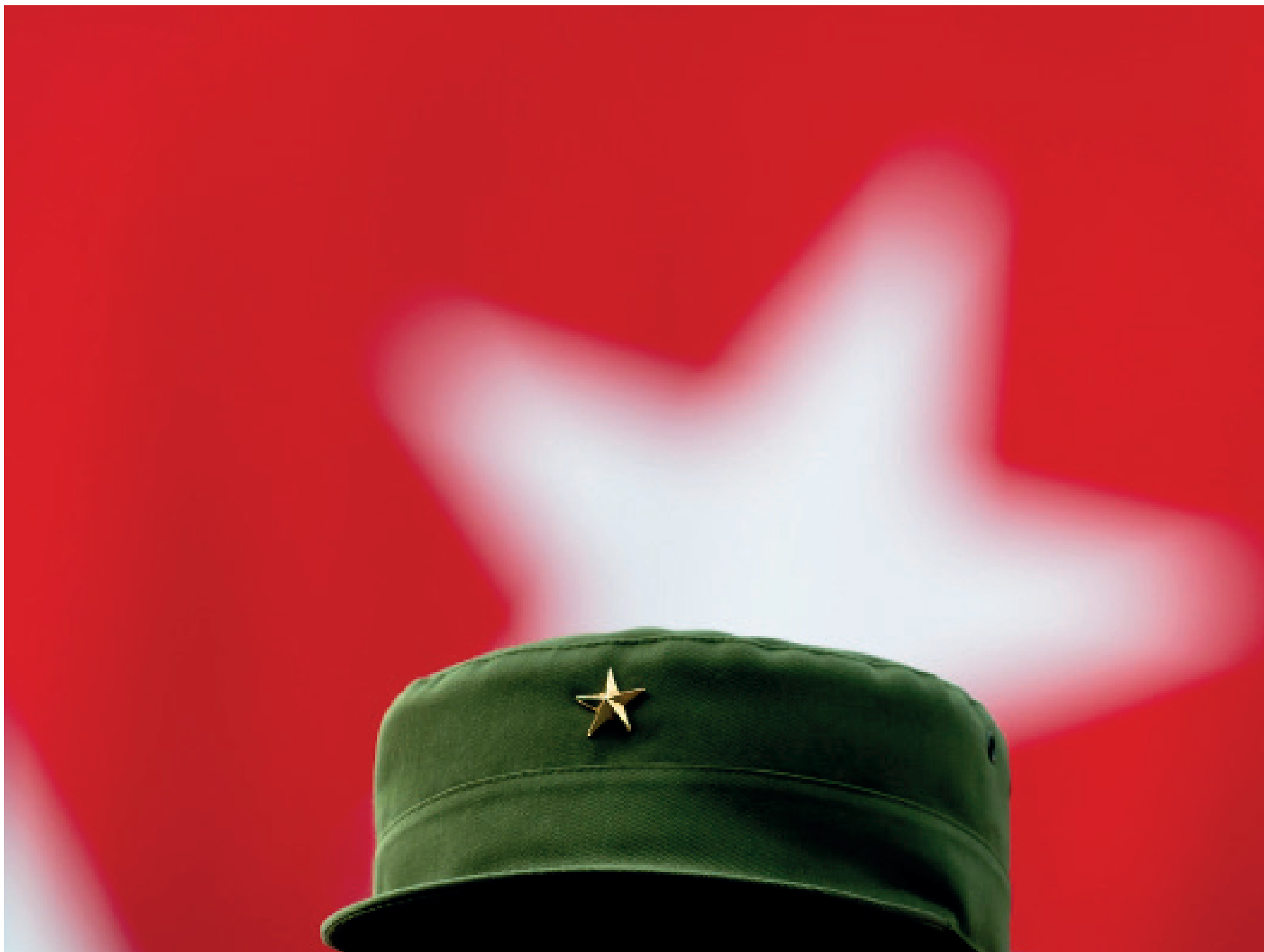
La estrella de Fidel. | foto: Roberto Chile

Precio 1.00 peso | ISSN-0864-0432 Año LVI No. 32