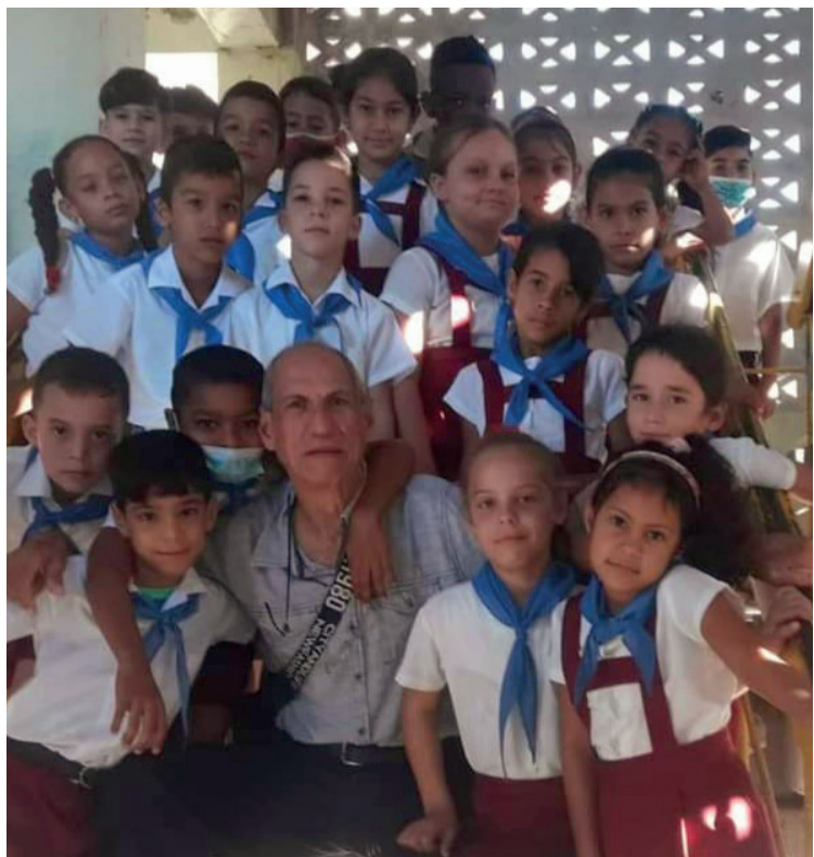
Para los niños ha vivido este hombre, que con casi siete décadas de vida no ha acudido a la jubilación.

De más está decir cuánto lo congratuló el instante en el que le otorgaron el Título Honorífico de Héroe del Trabajo de la República de Cuba: “Recibir este reconocimiento te dice que no ha sido en vano todo lo que has hecho. La parte espiritual del reconocimiento moral no te lo quita nadie. Vendrán otros momentos importantes pero nada como cuando me dice un estudiante ‘maestro, lo que usted sembró en mí’ o viene un abuelo y me da las gracias ‘porque enseñó a mi nieto’. Es que son distintas generaciones que he educado en un mismo pueblo y por eso creo que nadie pudo sentir en Báguanos que no lo representé en esa inolvidable ocasión”.