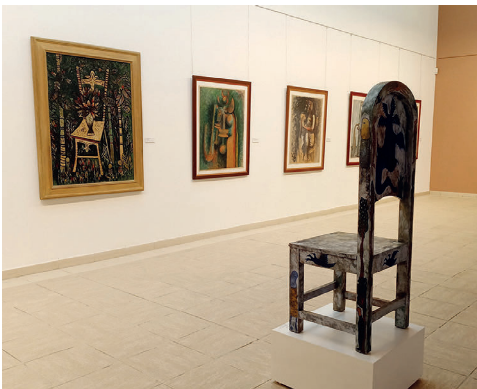
Es interesante el diálogo con las obras de otros grandes maestros. Frente a la célebre La silla de Lam , Mendive ha ubicado su propio asiento.

El título ofrece muchas pistas. Evoca los años en los que el niño que fue Mendive iba atesorando las experiencias, las imágenes que luego devolvería en creaciones maravillosas. A ese niño le encantaba el pan con dulce de guayaba. El Mendive de hoy sigue apostando por la felicidad de las pequeñas cosas. La realización personal es uno de los pilares de su visión del universo.