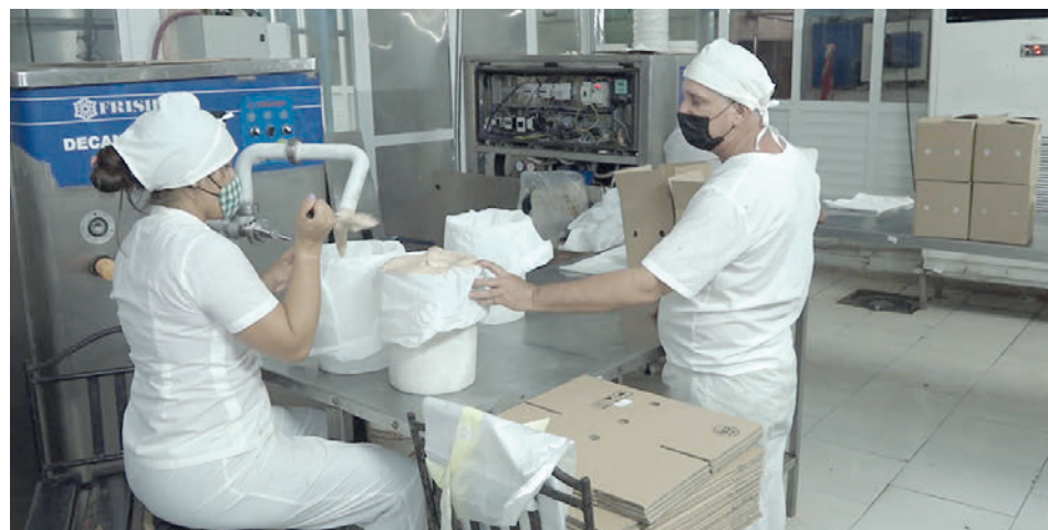
La producción de helado es una de las líneas que se mantiene por el encadenamiento con actores no estatales que facilitan la importación de materias primas.

Desde el año 2012 tienen un crecimiento sostenido y aunque este no da respuesta a la demanda de la población, logran presencia en el mercado interno. Coppelia y otras cafeterías especializadas en el expendio de helado son evidencia de ello.