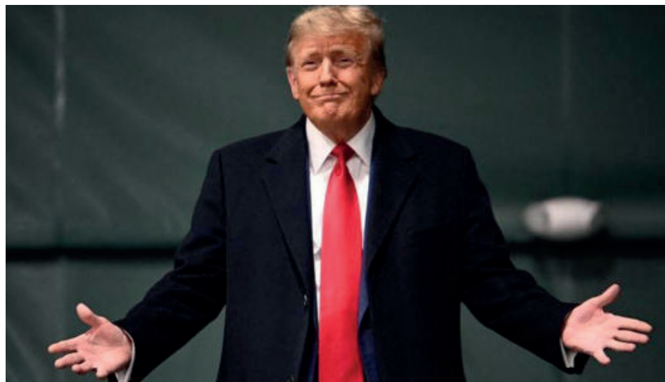
Además de las felonías por las que será condenado en Manhattan, Donald Trump tiene pendientes varios casos civiles por agresiones sexuales a mujeres, por evadir impuestos y por irregularidades en sus empresas. En tribunales penales deberá enfrentar además el caso de los papeles de Mar-a-Lago, el juicio por intentar manipular los resultados electorales en Georgia, y el vinculado al asalto al Capitolio el 6 de enero del 2021.

El juez Merchán anunció que dictará sentencia el 11 de julio. El delito de “falsificación de registros comerciales en primer grado” podría ser penado con multas de hasta 100 mil dólares por cargo, libertad condicional o supervisa-