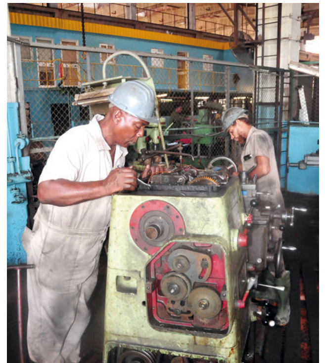
La importancia de no perder el know how en las especialidades que requieren de una alta calificación constituye una inquietud del colectivo.

Catalogada como Sociedad Anónima con capital 100 % cubano, la empresa también realiza actividades secundarias relacionadas con servicios de metrología, venta mayorista de oxígeno y acetileno, sustitución, reparación y mantenimiento de válvulas y cilindros,