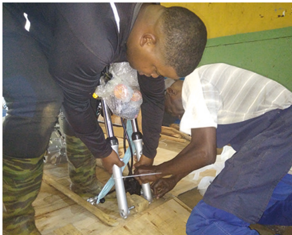
Los operarios ensamblan partes y piezas de las primeras motos marca Diana.