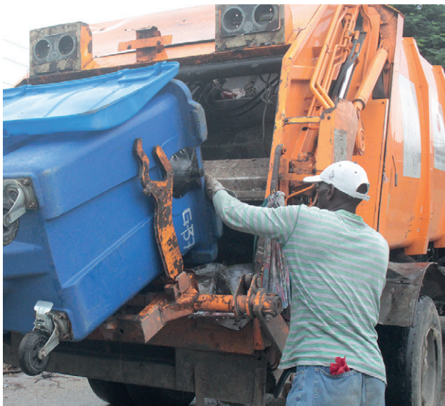
La Empresa de Servicios Comunes en el municipio tiene establecida la recogida diaria de los desechos sólidos.