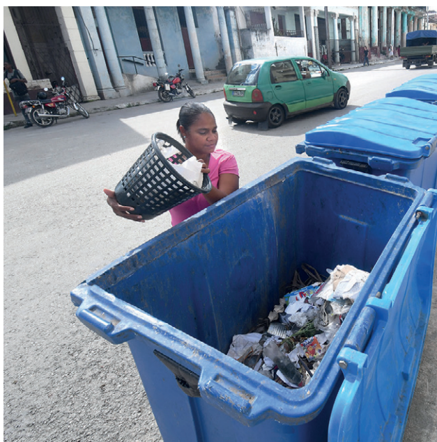
Los pobladores también contribuyen a la conservación de la higiene.

Los pilares de la gestión son aprovechar al máximo los recursos humanos y materiales, y el hecho de que la mayoría de los trabajadores habitan en la localidad. ¿Será posible clonar este ejemplo en otros municipios?