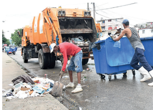
Una escena cotidiana.