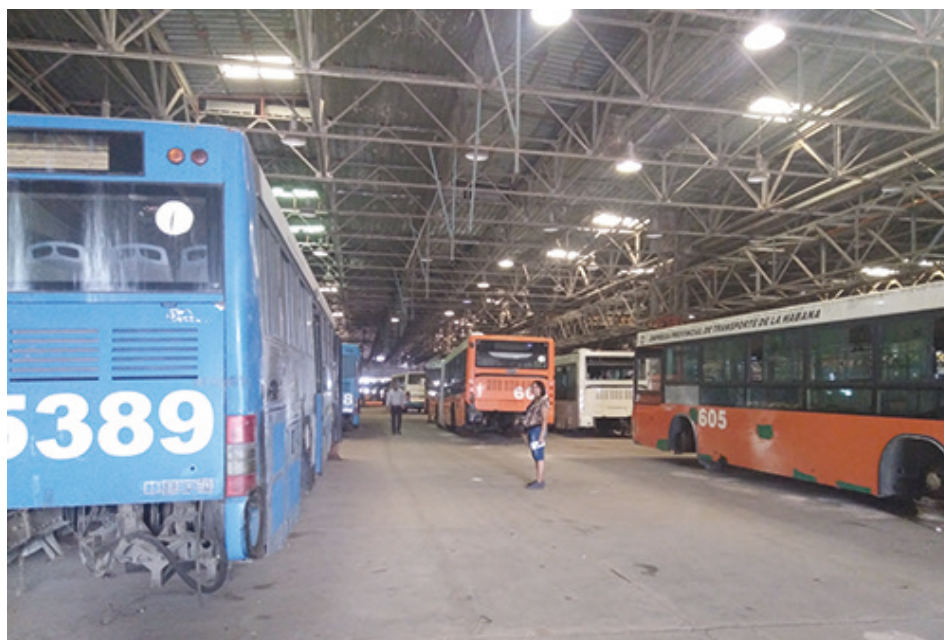
Crecen los contratos y los clientes, ahora reparan 100 ómnibus de la Empresa de Transporte de La Habana.

Conocimos que la venta se prevé a través de la Empresa Comercializadora Divet, con posibilidad de llegar a todas las provincias.