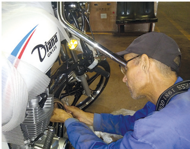
Esta producción es menos compleja, al venir semidesarmada.