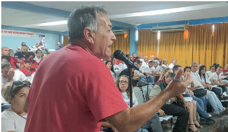
Unos 150 delegados asistieron a la Conferencia Provincial 22 Congreso de la CTC en Sancti Spíritus.

“Se buscan alternativas para incrementar la