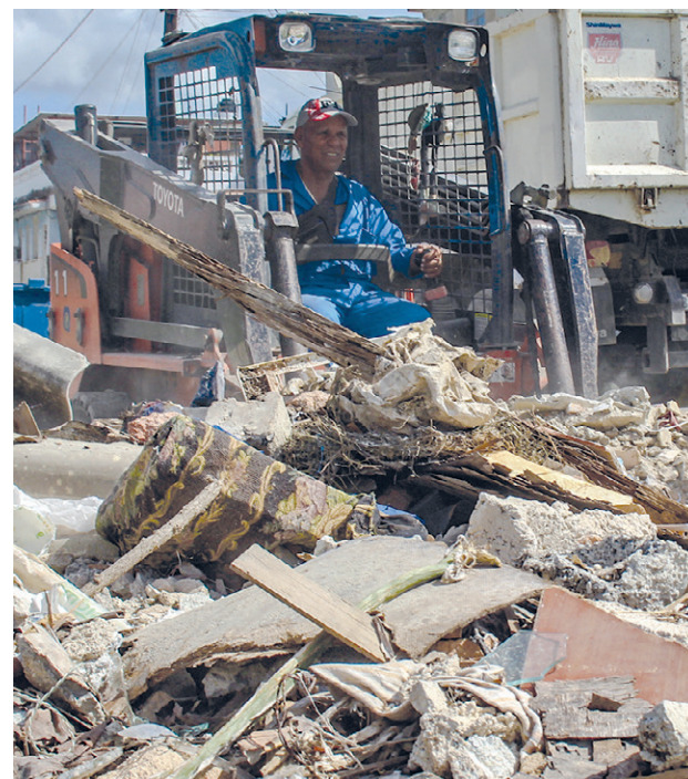
Seis brigadas que combinan juventud y experiencia constituyen la principal divisa de la empresa.