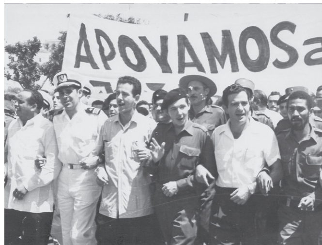
En 1959 Raúl encabezó la celebración del Primero de Mayo en La Habana, ya que el Comandante en Jefe Fidel Castro Ruz se encontraba fuera de Cuba.