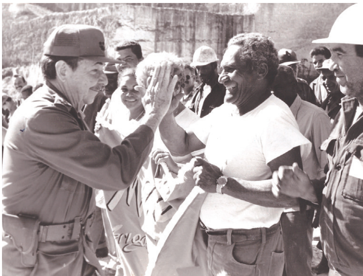
En contacto con trabajadores de la construcción.