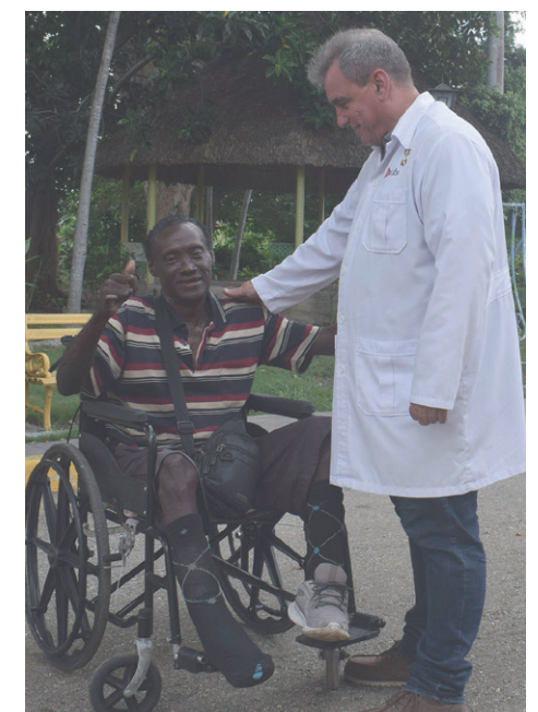
La estrecha relación con los pacientes es fundamental.