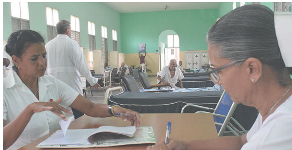
Un colectivo de excelencia labora en el hospital.

“El proyecto dispone además de dos naves con gallinas ponedoras atendidas por el Grupo Avícola. El cartón de huevos se vende a solo 300 pesos a los trabajadores; de los puercos se encarga el Grupo Porcino. También tenemos dos espejos