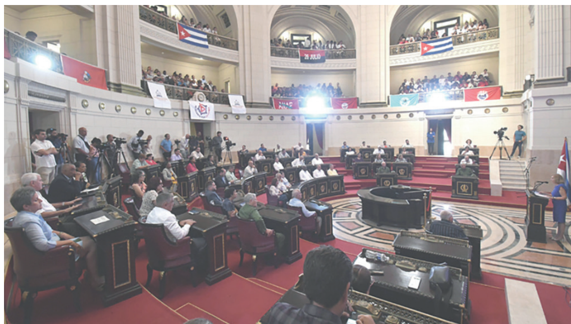
Audiencia Pública Parlamentaria en el Capitolio Nacional.

presentan a Cuba como un estado fallido, mientras que cada día crece el peligro de una guerra.