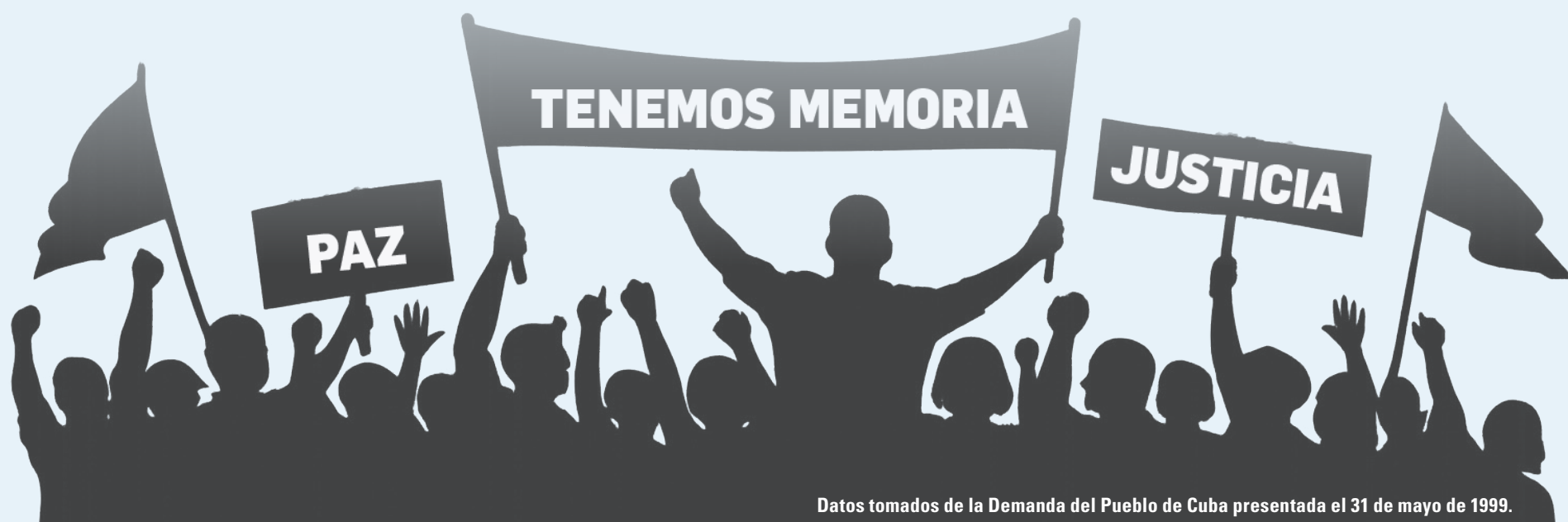
Datos tomados de la Demanda del Pueblo de Cuba presentada el 31 de mayo de 1999.

3 478 personas fallecidas y 2 099 con algún tipo de discapacidad