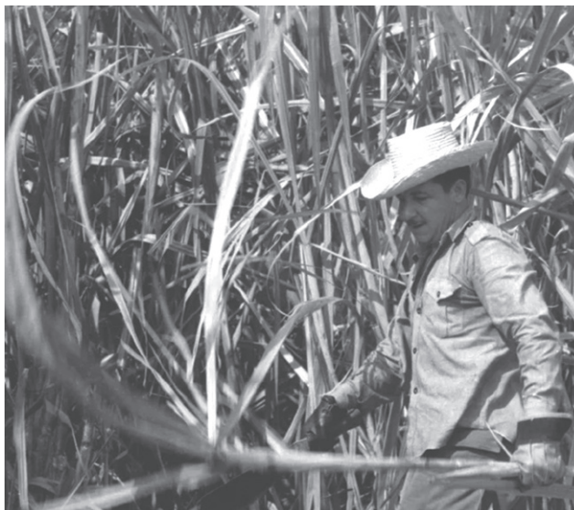
En la década de los setenta del pasado siglo participó en labores de la zafra azucarera.