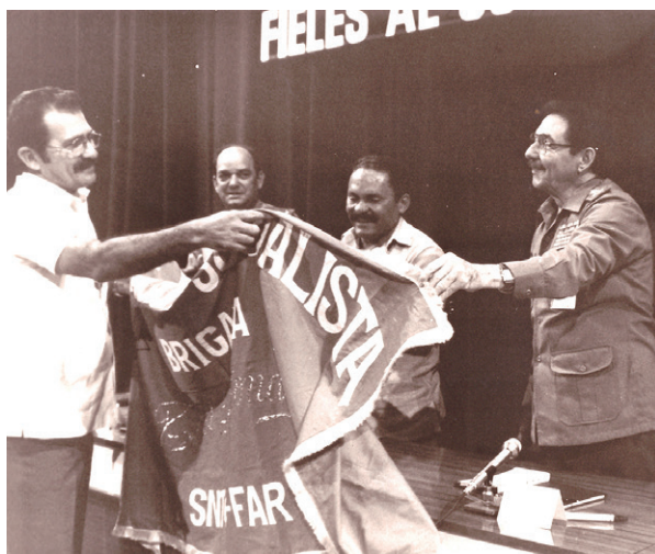
Durante la entrega de un reconocimiento al Sindicato Nacional de Trabajadores Civiles de las FAR, en la actualidad, Trabajadores Civiles de la Defensa.