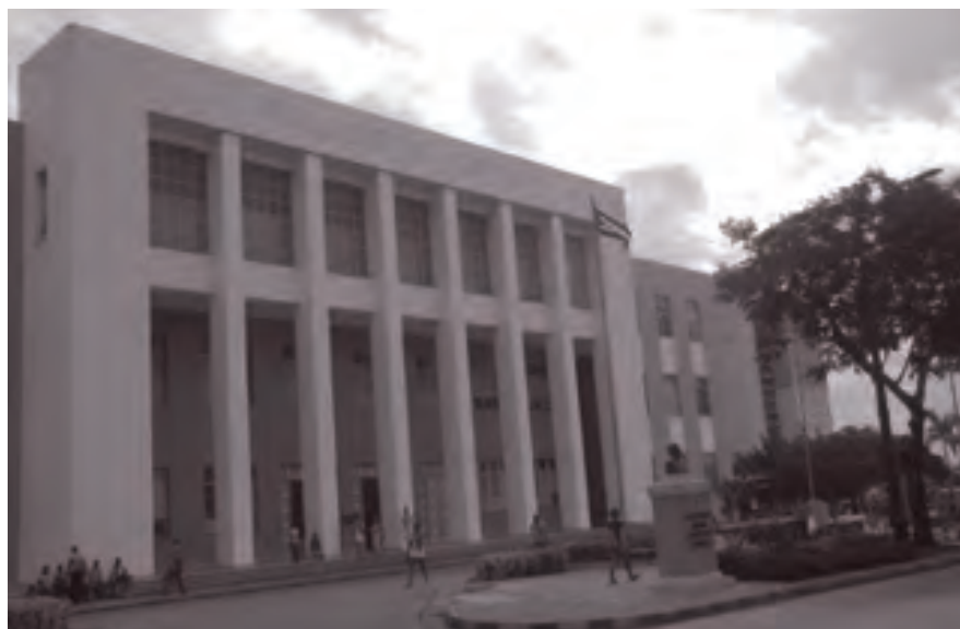
Palacio de Justicia, donde los asaltantes al retirarse fueron detenidos, pero la rápida reacción de Raúl Castro Ruz hizo prisioneros a sus captores con lo que salvó la vida de sus compañeros que hubiesen sido torturados y ejecutados.