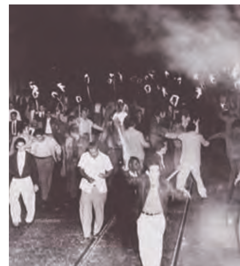
La Generación del Centenario desfiló en la Marcha de las Antorchas.

Era mucho más que una consigna. Estaban decididos a cumplir el mandato del Héroe de Dos Ríos.