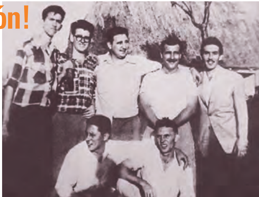
Junto a Fidel un grupo de futuros moncadistas.

El 27 de enero de 1953, a las 11 y 30 de la noche, partió de la escalinata de la Universidad de La Habana hasta llegar a la Fragua Martiana la histórica Marcha de las Antorchas para esperar el 28, día en que se cumplían los 100 años del nati-