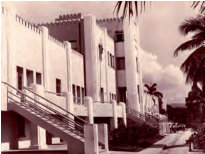
Cuartel Moncada, en Santiago de Cuba, objetivo central de las acciones.

Los hechos sucesivos le dieron la razón a Abel. Ya Fidel y los patriotas cubanos tenían un glorioso punto de partida para continuar la obra de los libertadores: un 26 de Julio.