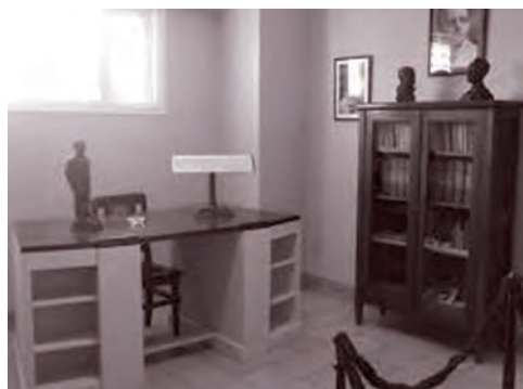
El apartamento de Abel y Haydée en 25 y O.