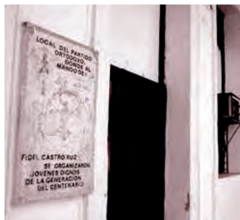
Tarja colocada en el local de Prado 109, en La Habana, donde Fidel realizó un intenso trabajo para captar a jóvenes dispuestos a combatir al batistato.

Ya para la fecha en que Abel y Fidel se conocieron, este llevaba semanas de intensa actividad en Prado 109, sede de las oficinas nacionales del Partido Ortodoxo, un lugar ideal para conspirar y hacer contactos debido a la gran cantidad de personas que a él acudían, por lo que no levantaba sospechas. Allí pulsaba criterios, e iba nucleando a jóvenes que coincidían con su valoración de la única salida posible a la situación del país.