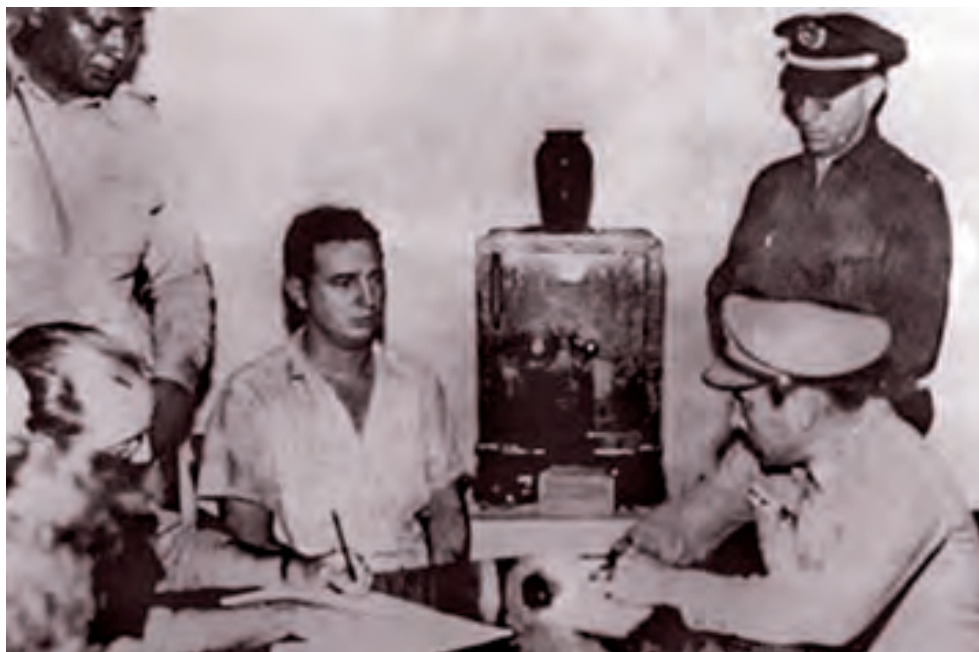
Fidel presta declaración en el Vivac de Santiago de Cuba. En la foto aparece el teniente Sarría, quien evitó el asesinato del líder de la Revolución y otros moncadistas.