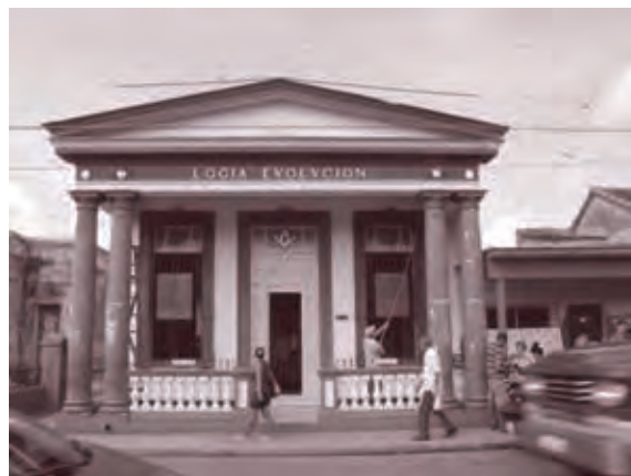
Un número importante de los asaltantes procedía de Artemisa, quienes tuvieron como uno de sus centros de conspiración la loggia Evolución.