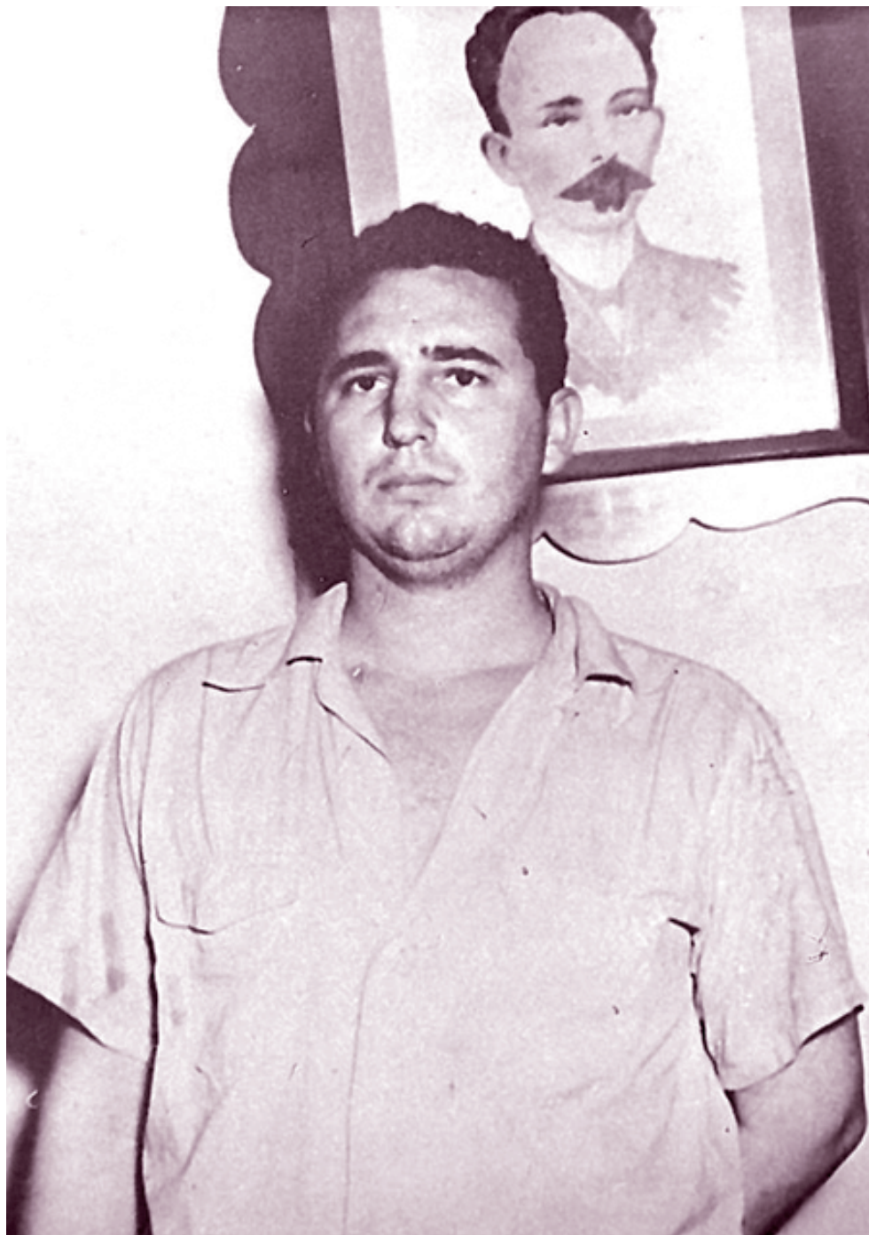
La foto que se convirtió en símbolo.

Siempre tuvo absoluta confianza en el futuro, como la tuvieron los que lo acompañaron en aquella gloriosa jornada. Sabían que podían caer en el empeño, pero sus ideas no se podían matar. Ellas continuarían inspirando la acción de los continuadores de su obra, hasta la victoria final.