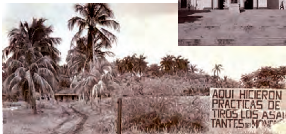
Los revolucionarios recibieron entrenamiento en áreas de la Universidad de La Habana, en el Club de Cazadores simulando ser deportistas, y en diversas fincas.