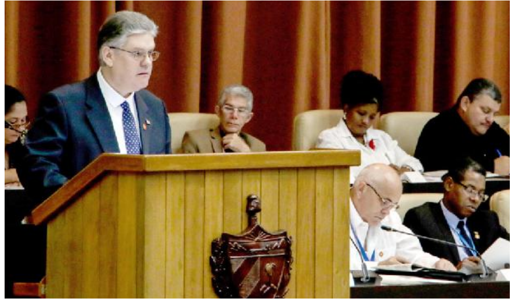
Alejandro Gil Fernández, ministro de Economía y Planificación.