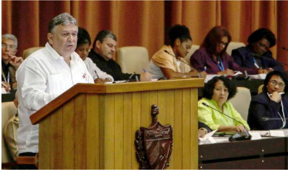
Marino Murillo Jorge, jefe de la Comisión para la Implementación y Desarrollo.