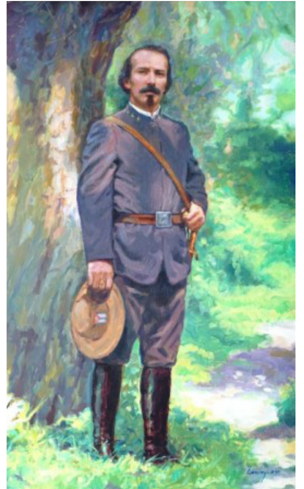
Céspedes, obra de artes plásticas de Amaury de Jesús Palacio Puebla.

José Martí, Apóstol de Cuba, realizó el análisis certero de aquella utopía democrática al reconocer que Céspedes no creía en una autoridad dividida pues "la unidad del mando era la salvación de la revolución; que la diversidad de jefes, en vez de acelerar, entorpecía los movimientos. Él tenía un fin rápido, único: la independencia de la patria. La Cámara tenía otro: lo que será el país después de la independencia. Los dos tenían razón; pero en el momento de la lucha, la Cámara la tenía segundamente. Empeñado en su objeto, rechazaba cuanto se lo detenía". (1)